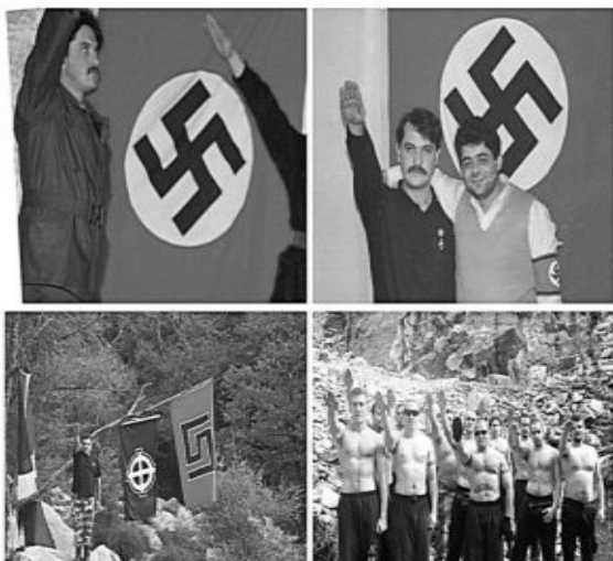
Χρήστος Παππάς, Νίκος Μιχαλολιάκος, κάτω Ρουμπακιός, και Ηλίας Κασιδιάρης

κρύβουν την ταυτότητά τους! Για αυτό και την εξελίσσουν! Ο μαϊάνδρος, τα χρώματα που χρησιμοποιούν (μαύρο άσπρο κόκκινο) τα συνθήματα “αίμα τιμή” και “πάνω από όλα το έθνος” είναι μετεξελίξεις του ναζισμού[16]. Εξάλλου το λένε καθαρά στα ιδεολογικά τους κείμενα ότι παλεύουν για το αίμα, για την ράτσα, για την φυλή, όπως και οι πρόγονοί τους οι ναζί[17].