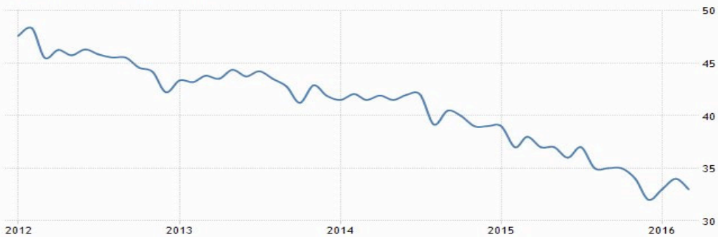
UKRAINE CRUDE OIL PRODUCTION