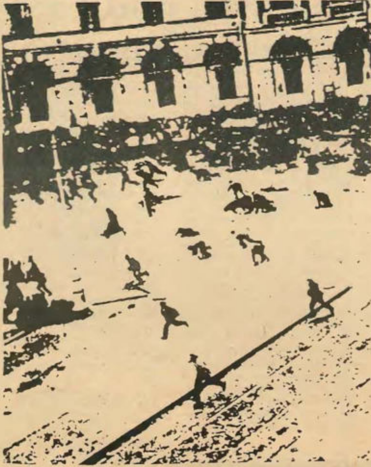
Η σύμπτωση της αλλαγής των περιστάσεων και της ανθρώπινης δραστηριότητας ή αυτοαλλαγής δεν μπορεί να συλληφθεί και να νοηθεί λογικά παρά σαν επαναστατική πράξη.

καπιταλισμό και συγκεκριμένα στο μονοπωλιακό καπιταλισμό τεράστιες πηγές του πλούτου ξεοδεύονται σε μη παραγωγικά έργα όπως είναι: η διαφήμιση,