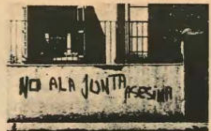
Συνθήματα στοὺς δρόμους τοῦ Σαντιάγο: «Κάτω ἡ Χούντα τῶν δολοφόνων».

Ὅπως εἶδαμε τὸ MIR ἀποτελεῖ σήμερα μαζὺ μὲ τὶς ἄλλες ὀργανωμένες δυνάμεις τῆς ἀριστερᾶς στὴν Χιλὴ ἕνα ἐπαναστατικὸ κίνημα πού ἀγωνίζεται ἐνοπλὰ στὴν στρα-