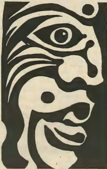
τάρας τον 13ον αιώνα ή του Κυπριακού Λαού τον 20όν. Μ' αυτό το θέμα συνδέονται:

λής. Ανέλασε την εμπνευσή του από την Κυπριακή πραγματικότητα στηρίζοντας το πάνω σε ιστορική βάση. Το θέμα είναι η εκτέλεση δια πυρός των καλογέρων της Καν-