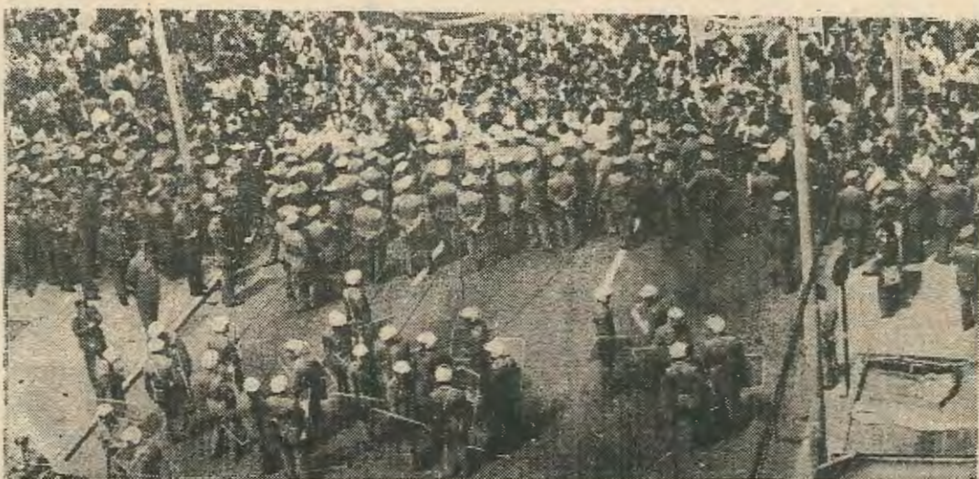
Νεολαία εκδύσε την ακόλουθη ανακοίνωση:

Σχετικά με την παναπεργία στην Ελλάδα και την απροκάλυπτη επίθεση της αστυνομίας ενάντια στο εργατικό κίνημα η Σοσιαλιστική