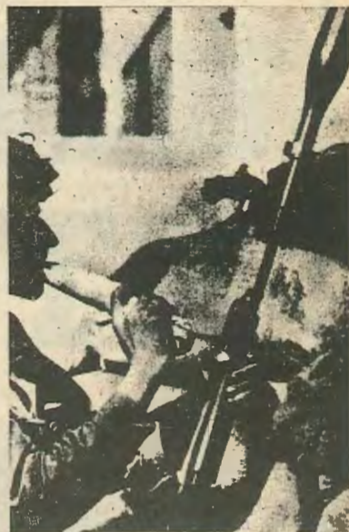
γματοποιηθούν τα ιμπεριαλιστικά σχέδια. Μια Γαλλική επέμβαση θά σημαίνει αίματοκυχία πράγμα που η Γαλλία δεν μπορεί ν' άντέξει. Η κρίση στο Λίβανο φαίνεται να συνεχίζεται για πολύ καιρό ακόμα.

Με την απόρριψη της Γαλλικής προσφοράς από την άριστη ήγεςία του Λιβάνου θά'ναι κάπως δύσκολο να πρα-