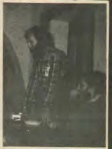
άνθρωπους οι οποίοι συνεργάστηκαν με το Φράνκο και παρουσιάζονται σήμερα σαν οι μετανοήσαντες ή δημοκράτες.

Σήμερα όσο ποτέ άλλοτε το Ισπανικό κίνημα χρειάζεται διεθνή συμπαράσταση.