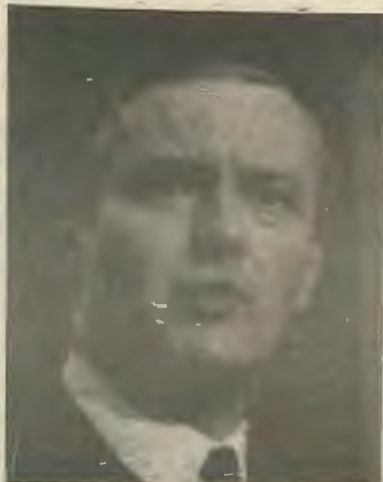
Α. Μπέν, άριστερά πτέρυγα.

νομε πολλές εξελίξεις στο παραδοσιακό αυτό προτύργιο τ' καπιταλισμού.