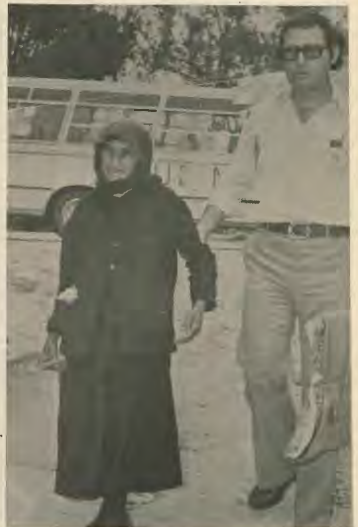
Τη στιγμή που κερδίσαμε το ψήφισμα οι ξεριζωμένοι Κυπρίων συνεχίζονται και...