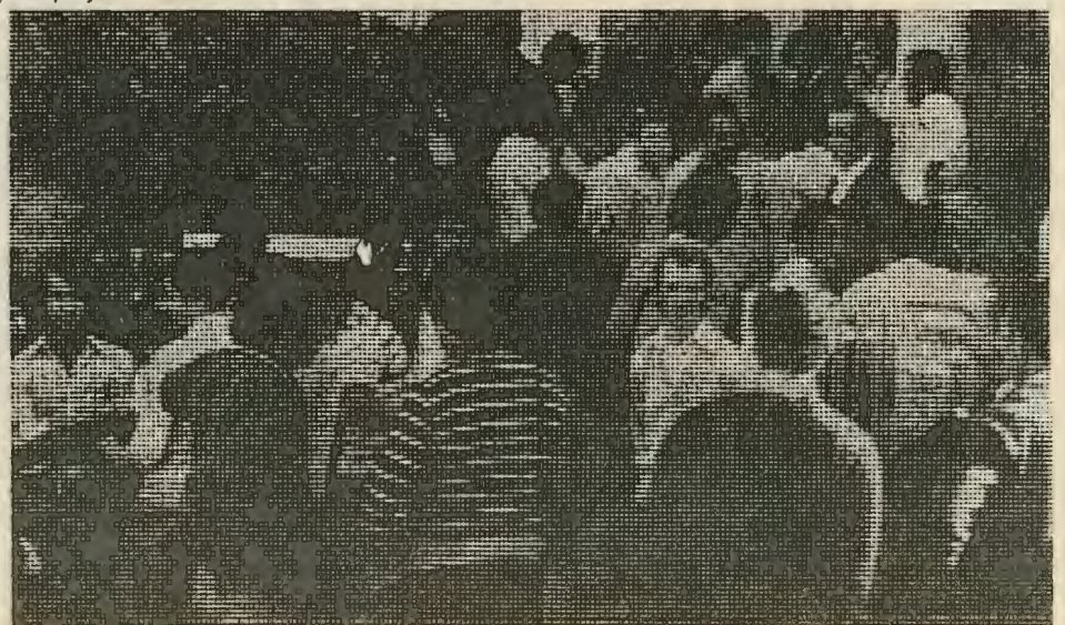
...Οι άνεργοι εργάτες ξενητεύονται