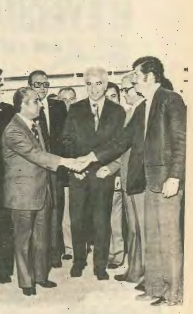
Κυβέρνηση και συνεργατισμός από διωμηχανικό συγκρότημα της Πόφου.

Οι πρόσφατες ένεργειες της διεύθυνσης του Συνεργατισμού είναι μόνο ένα μικρό δείγμα των κακών που μπορεί να προσήνσει, άν δέν μπει το κίνημα κάτω από οδοαστικό λαϊκό έλεγχο κι άν οι οργανώσεις της εργατικής τάξης δέν άγεληθούν έγκαιρα και σωστά το ρόλο τους. Η έπέμβαση του προέδρου και ή τάση των εργατικών συνδικάτων να κατασείνουν κάθε σορά στή διατήρηση του καθεστώτος, είναι θέματα μιά τακτική, αλλά μόνο προσωρινές. Εμβαλλωματικές λύσεις υποοεί να δώσουν στα προβλήματα των ένοιαζόμενων. Τό δικαίωμα της άπεργίας δέν υποοεί να νοτισοποιείται άπό τα συνδικάτα μόνο σαν μέσο εκβίασμο ή άπειλής άλλά σαν μέσο άποτελεσματικής διεκδίκησης των εργατικών δικαίων. Δέν είναι θέμα «παρανοήσεων» άπό την εργοδοσία και το κράτος ποός τους ένοιαζόμενους είναι θέμα άδυναμιστικής διεκδίκησης να να κερδίσουν οι ένοιαζόμενοι αυτά που τους άνήκουν.