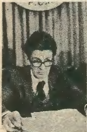
ΕΝΡΙΚΟ ΜΠΕΡΑΙΝΙ ΚΟΥΠΕΡ

Το Ι.Κ.Κ. πρέπει να προσπαθήσει στη δημιουργία ενός ενιαίου εργατικού μετώπου χωρίς συνεργασίες με τη δεξιά και να διεκδικήσει την πολιτική εξουσία. Οι συνθήκες στην Ιταλία είναι ώριμες για μεγάλες αλλαγές του εργατικού κινήματος, που θα επηρεάσουν όλη την Ευρώπη. Δεν πρέπει να χαθούν αυτές οι ευκαιρίες.