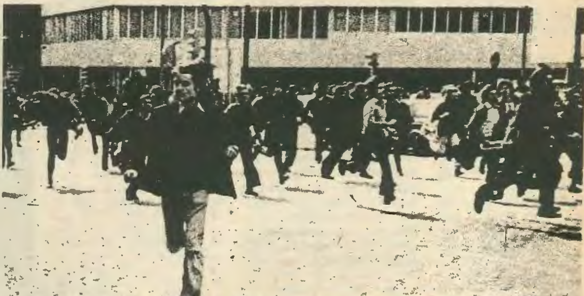
Διαδήλωση νεαρών εργατών στη Μπαρσελώνα.

άριστερών τάσεων μέσα στα σοσιαλδημοκρατικά και σοσιαλιστικά κόμματα της Ευρώπης. Τα ίδια τα κόμματα στράφηκαν προς τα άριστερά, τουλάχιστον αυτά που βρίσκονταν στην αντιπολίτευση. Αλλά η στροφή τους έφερε μεγάλη μαζική υποστήριξη. Παραδείγματα τέτοιας εξέλιξης είναι η Γαλλία, η Ισπανία, η