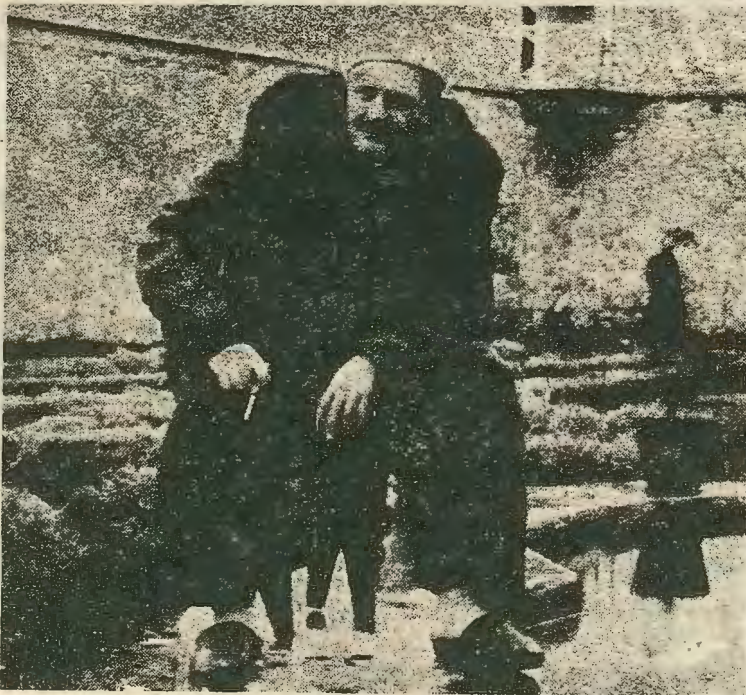
Ὁ Ναζιμ Χικμέτ στὸ προαύλιο τῆς φυλακῆς τῆς Προύσας (10 Μαρτίου 1946)

Ἐπίσης πρέπει νὰ μεταφραθοῦν βιβλία ἱστορικοῦ καὶ πολιτικοκοινωνικοῦ περιεχομένου σχετικὰ μετὴν Τουρκία καθὼς καὶ Ἑλληνικὰ στὰ Τούρκικα. Εἰδικὰ γιὰ τοὺς Τουρκοκύπριους προοδευτικοὺς διανοούμενους ἔχουμε πλήρη ἀγνοία καὶ δὲν ὑπάρχουν μεταφράσεις ἔργων τους πού θὰ τοὺς γνώριζαν καλύτερα στοὺς Ἑλληνοκύπριους ἐργαζόμενους, τὴ στιγμή πού ἐγίνε Ἐκκάθηρη ἡ ἀνάγκη ἑνὸς ἀντικατοχικοῦ μετώπου Τουρκοκυπρίων καὶ Ἑλληνοκυπρίων ἐργαζομένων.