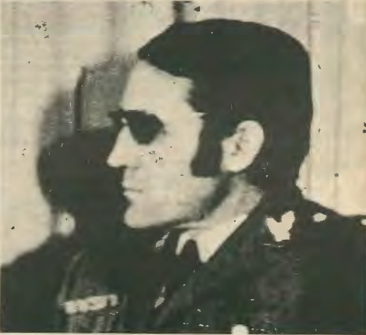
Έβανς: ο μέλλων δήμιος της Επανάστασης

δεκατίας ή δεξιά ήγεςία του διώχτηκε και εκλέχτηκε Προσμηάτας του κόμματος ο Φελίππε Γκονζάλες, ένας νεαρός δικηγόρος, ήγεςτης της άριστερας πτέρυγας. Με μια επαναστατική τοποθέτηση κάρφερε να κερδίσει τις εργατικές μάζες και να υπερφαλαγγίσει κατά πολύ το Κ.Κ. του Σαντιάγο Καρίγιο. Κάτω όμως από την πίεση, τις απειλές και τις υποσχέσεις της Σοσιαλιστικής Διεθνούς (για την Σ.Δ. θα μιλήσουμε αργότερα) το PSOE νέρωσε το πρόγραμμά του και δέχτηκε την έγνοια της μεταδόσης στη Δημοκρατία και έτσι διατηρεί στην ουσία στην εξουσία τη δεξιά κυβέρνηση Σουάρες.