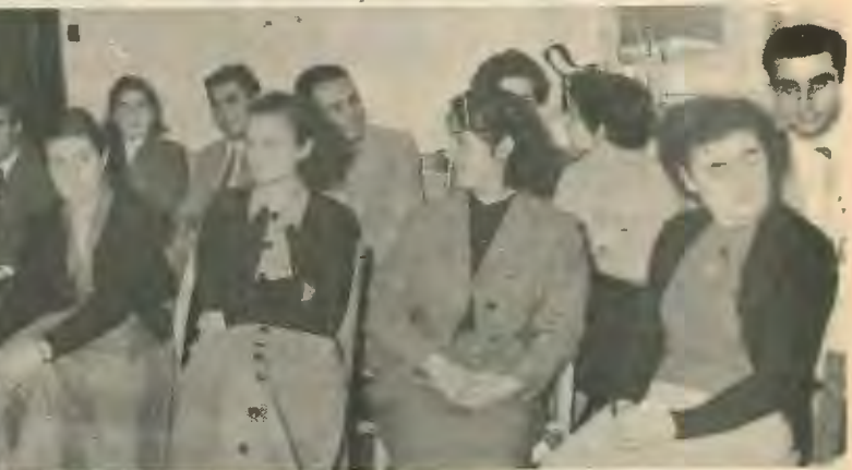
Έλληνοκύπριοι και Τουρκοκύπριοι διδάσκαλοι σε κοινή εκδήλωση στο Διδακταλικό Κολλέγιο Μόρφου (1954).

Και η πορεία για τη δημιουργία αυτόων των προϋποθέσεων δεν φαίνεται κοντινή ούτε τόσο οισιόδοξη. Γιατί η συντεχνιακή ηγεσία, όπως συνέχεια τονίζουμε και πολεμούμε αυτή την γραμμή, κρατά τους εργαζομένους μακριά από αυτή τη διαδικασία με τους συμβιβασμούς της μπροστά στο κεφάλαιο, που στέκουν τροχοπέδη