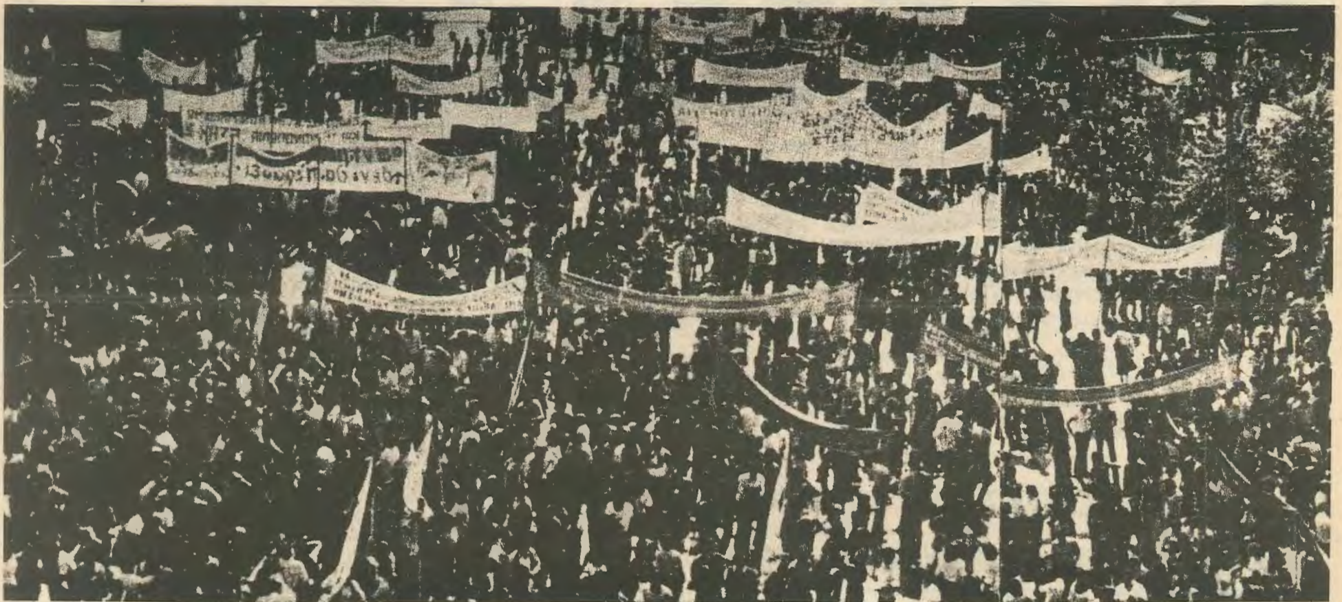
Από τη συγκέντρωση στις 4 Μάη '78 στο Πεδίον του Άρεως για τον γιορτασμό της πρωτομαγιάς.

πό την εκστρατεία της δεξιάς για δήθεν «επικείμενη σύμπτωση λαϊκού μετώπου» και για να κερδίσει ίσως την λαϊκή βάση του υπό διάλυση Κέντρου, ανακοίνωσε ότι «Το ΠΑΣΟΚ κατέδρασε αυτότελες στις εκλογές του 1977 με δικό του κυβερνητικό πρόγραμμα. Και στις επόμενες εκλογές θα κατεβεί αυτότελες, με δικό του βελτιωμένο πρόγραμμα για την μεγάλη αλλαγή στην χώρα μας». Αφησε όμως ανοικτό το δρόμο για επί μέρους συν-