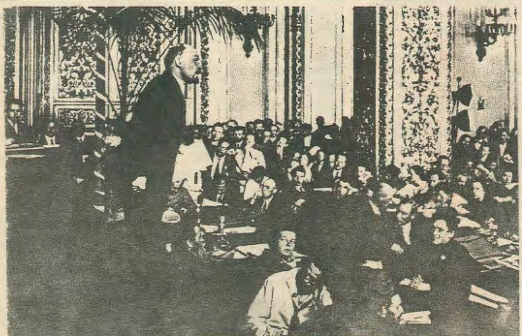
Αφιέρωμα στην 61 Επέτειο της Ρώσικης Επανάστασης σελ. 4