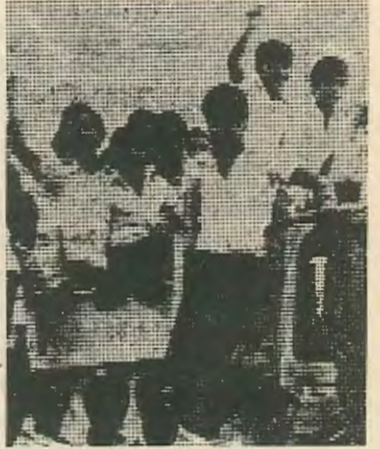
έχει επικοινωνία με τον κύριο δρόμο. Ο κύριος δρόμος απέχει από το χωριό περί το 1 μίλι. Έτσι μόνο με αυτο το μέσο μπορούν να μεταφερθούν στο σχολείο και τους εκβιάζουν με την αύξηση των κομιστρών.

Μας είπαν σχετικά οι μαθητές. — Οι λεωφορειούχοι το κάνουν αυτό διότι το Παλιομέτοχο είναι ένα χωριό 4500 χιλιάδων κατοίκων. Δεν