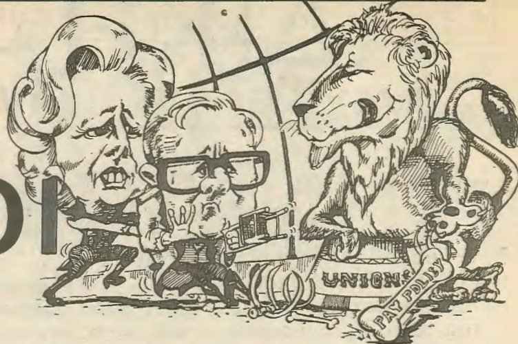
Η Μάρκαρετ Θάτσερ, ηγέτις του Συντηρητικού κόμματος φοβάται να τα βάλει η ίδια με τις συντεχνίες, και σπρώχνει τον Κάλλαχαν. Η ηγεσία του Εργατικού κόμματος αποτελεί σήμερα την ελπίδα της αστικής τάξης...

κίνημα, ενώ ακόμα και οι πιο σοβαροί θεωρητικοί της δεν είναι σε θέση να καταλάβουν