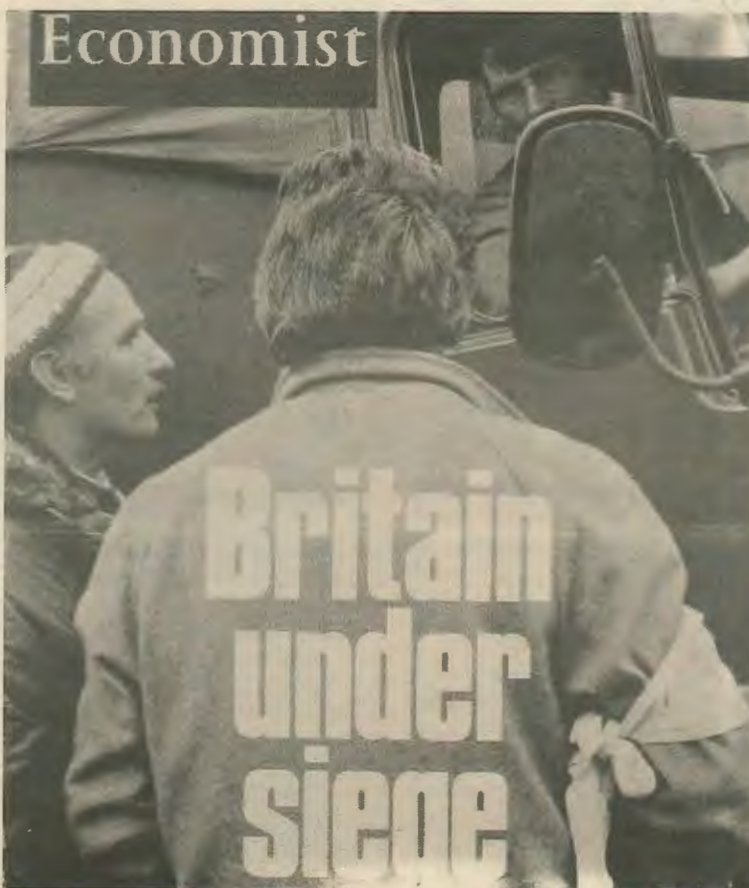
«Η Βρετανία σε Πολιορκία» ο τίτλος του «Οικονομιστ» αντικατοπτρίζει τον πανικό της δεξιάς.

σε θέση να κάμει τίποτε. Η αστική τάξη στέκει τρομοκρατημένη μπροστα στο εργατικό