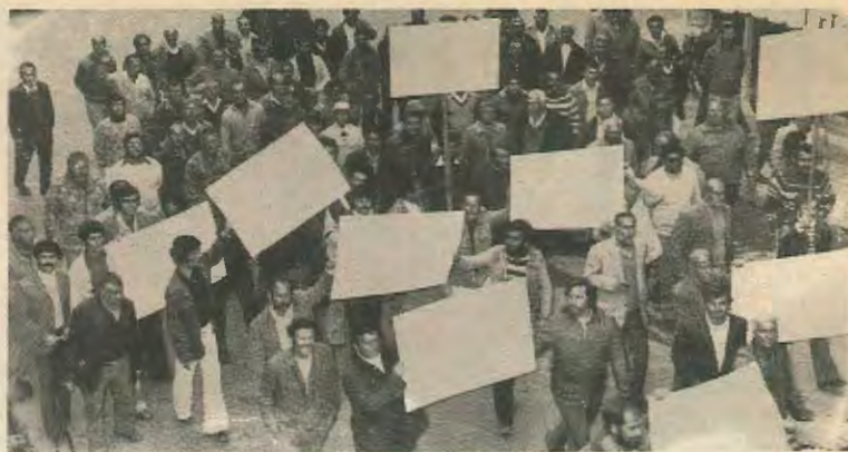
ΛΙΜΕΝΕΡΓΑΤΕΣ ΠΛΗΡΟΦΟΡΟΥΝ ΤΗΝ ΕΚΦΡΑΣΗ: