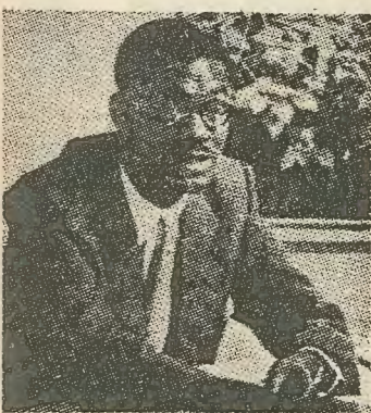
Λουμούμπα: Η 'Αφρική θα γράψει μόνη τή δική της ιστορία.

Με τή βαθιά άφρικανική νύχτα, στά δάση του Κογκό, στίς πεδιάδες τής Ροδεσίας, και ως τά παράλια τής χώρας του 'Αποσταίν, ακούγεται ήδη όλοένα έντονότερα τό επαναστατικό θούριο που ρυθμίζει τά βήματα τών νέων λεγεώνων από τούς άπόγονους τών Μαύρων σκλάβων τής άλλοτε, άποφασισμένων νά σπάσουν πιά τίσ άλυσίδες τους.