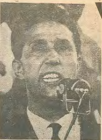
Μπέν Μπέλλα: 'Απ' τόν άγώνα άνεξαρτησίας στή φυλακή.

Η κύρια τέτοια ίθαγενή μειοψηφία που άναπτύχθηκε στά είκοσι τελευταία χρόνια τής νεοαποικιακής περιόδου είναι έκείνη τής νέας «κρατικής γραφειοκρατικής μπουρζουαζίας» που δέν είναι άκριβώς ούτε κλασική κομπραντόρε μπουρζουαζία, ούτε «έθνική άστική τάξη» όπως σέ πιο προχω-