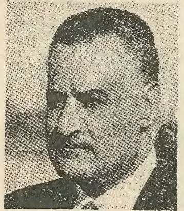
Νάσερ: Τί άπέμεινε από τό μεγάλο όνειρό του;

και τήν άνοδο τών τιμών κυρίως τών βιομηχανικών προϊόντων τό έμπορικό ίσοζύγιο, είναι σταθερά σέ βάρος τής 'Αφρικής και καλύπτεται με άνερχόμενο, έξωφρενικό δανεισμό. «Βοήθεια» και δάνεια από τό έξωτερικό καταναλώνονται κυρίως γιά τήν αγορά έξαι τεχνολογίας και προϊόντων, καθώς και γιά τήν διατήρηση επί τόπου μίας παρασιτικής γραφειοκρατίας.