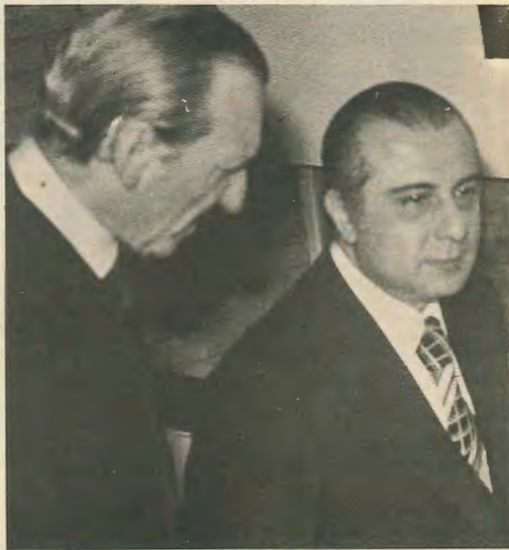
Τουρκοκυπριακών μαζών και θα εξουδετερώσουν αποτελεσματικά τη δύναμη εκείνων που επιδιώκουν ανοιχτά πια την υποταγή.

Η ίδρυση της λαϊκής πολιτοφυλακής κάτω από το λαϊκό έλεγχο είναι απαραίτητη προϋπόθεση για την άμυνα του λαού, ελλήνων και Τούρκων, ενάντια στην επιδρομική μανία ιμπεριαλιστών και των πληρεξουσίων του.