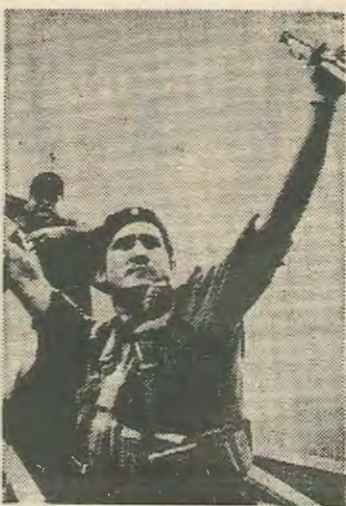
Έβτεν Παστόρα: ο ηγέτης των Σαντινιστών

Ομως είναι πια πολύ αργά. Η πρόταση απορρίφθηκε από τους Σαντινιστές, καταγγέλθηκε από την Κούβα σαν προσπάθεια επέμβασης στη Νικαράγουα και δεν έγινε δεκτή από την ΟΑΣ. Δεν μένει πια καμμία αμφιβολία πως η Νικαράγουα θα περάσει στα χέρια των Σαντινιστών. Οποιοσδήποτε άλλες λύσεις