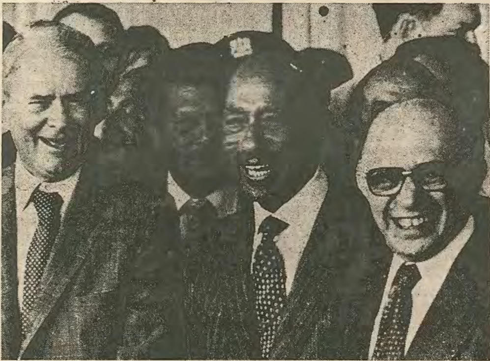
ΧΑΜΟΓΕΛΑ ΠΡΙΝ ΑΠΟ ΤΙΣ ΣΥΝΟΜΙΛΙΕΣ

διάθεση τους για την προώθηση του αγώνα. Το παράδειγμα είναι πολυ έντονο.