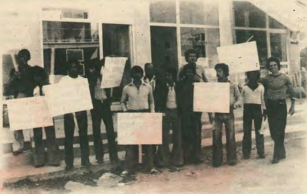
Απεργία διαρκείας στην C.A.C στην 8η σελίδα.

Το πρόβλημα του συνεργατισμού είναι πρόβλημα δομών, παρα από τα σκάνδαλα που έχουν παρατηρηθεί. Είναι λοιπόν άμεσο καθήκον η αλλαγή της νομοθεσίας, η εκδημοκρατικοποίηση του συνεργατισμού, η αφαίρεση των υπερεξουσιών από τη διοίκηση, έτσι που να γίνει δυνατή διοίκηση του συνεργατισμού από τους ίδιους τους συνεργατισμούς. Και τούτο πρέπει να είναι το πρωταρχικό αίτημα των συνεργατιστών: Να επιστρέψει ο συνεργατισμός σ' εκείνους που πράγματι ανήκει.