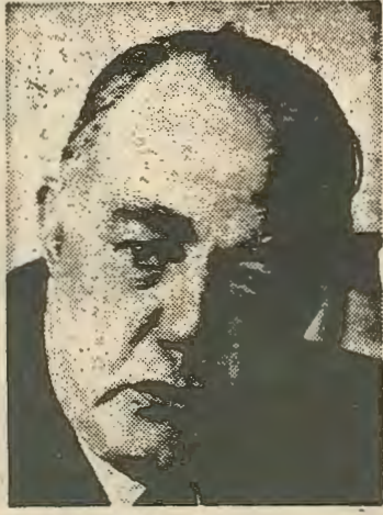
δο της εργατικής τάξης των μαύρων.

Απο την άλλη η μεγάλη βιομηχανική και τεχνολογική ανάπτυξη αύξησε την αριθμητική δύναμη και το μορφωτικό επίπε-