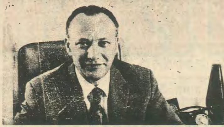
Ο Γλ. Κληρίδης στη τελευταία -του ανοικτή επιστολή ε- χτος από μαθήματα δημοκρατίας δίνει και μαθήματα κοινωνι- κής κριτικής. Ώσπου μπορεί να προχωρήσει;

Είναι ολοκάθαρο ότι ο ΔΗΣΥ προσπαθεί να οικειοποιηθεί με διάφορες φιλολαϊκές κριτικές τα μικροαστικά και πλατιά λαϊκά στρώματα. Μετα την αποτυχία της οικονομικής πολιτικής του ΔΗΚΟ και την δυσφορία των λαϊκών στρωμάτων ο ΔΗΣΥ κάνει μια προσπάθεια να προσεταιριστεί αυτά τα στρώματα. Έτσι προβαίνει σε κοινωνικές κριτικές και μιλά για σπατάλες. Προσοχή όμως να μη θίχτει το κεφάλαιο, η οικονομική πίεση στο λαο είναι αποτέλεσμα κυβερνητικών δαπανών κι όχι ΣΑΠΙΣΜΑ ΚΑΙ ΚΡΙΣΗ ΟΛΟΥ ΤΟΥ ΟΙΚΟΝΟΜΙΚΟΥ ΚΑΙ ΚΟΙΝΩΝΙΚΟΥ ΟΙΚΟΔΟΜΗΜΑΤΟΣ. Αυτό προσπαθεί να πείσει ο ΔΗΣΥ το λαο για να τον εγκλωβωθεί.