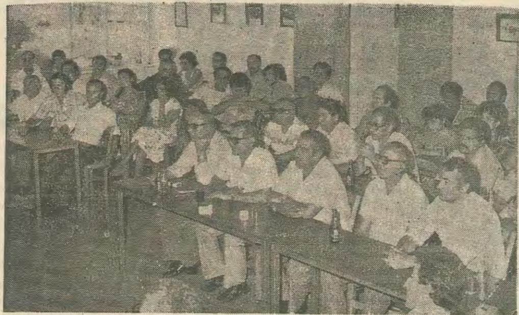
Συνέλευση υπαλλήλων πετρελαιοειδων συζητα αιτήματα

Οι διαπιστώσεις τόσο των Ε/Κ όσο και των Τ/Κ εργαζομένων σχετικά με την εκμεταλλευτική δράση των αστικών τους τάξεων είναι κοινές. Αυτό που μπαίνει μπροστα τους είναι να χιράξουν μαζί μια κοινή πορεία που θα τους απαλλάξει απο κάθε μορφή καταπίεσης ντόπιας ή ξένης και θα τους επιτρέψει να ζήσουν ειρηνικά μέσα σε μια Κύπρο λύτερη μια Κύπρο των Εργαζομένων μια Κύπρο Σοσιαλιστική.