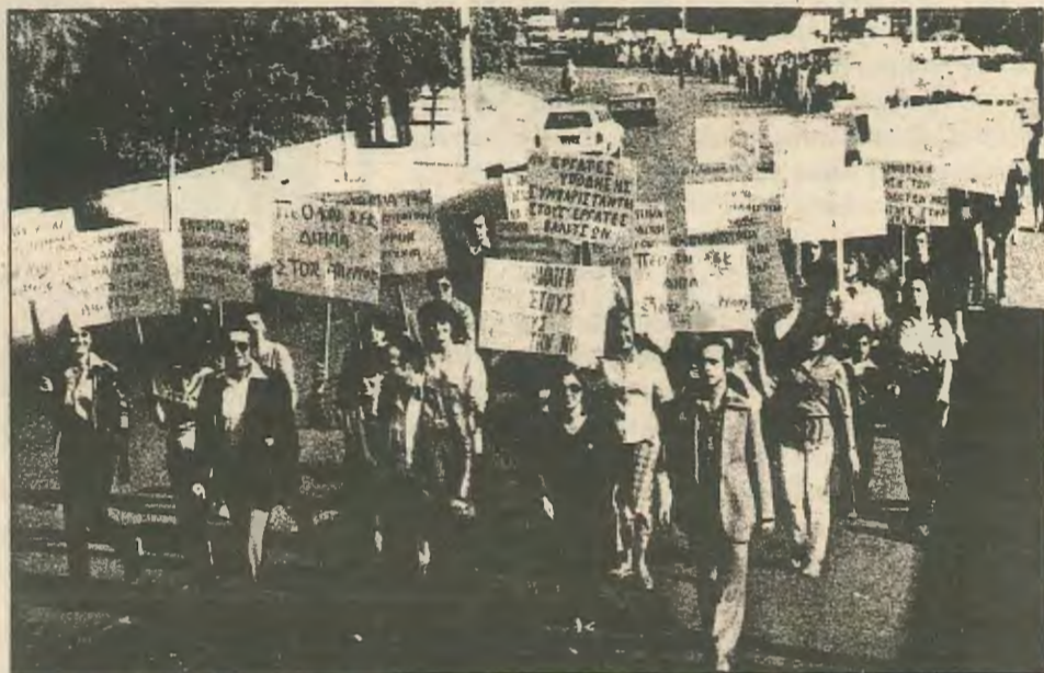
Απο την πικετοφορία των απεργών την περασμένη Πέμπτη

Για τους εργάτες η εμπειρία αυτής της απεργίας είναι μια χρήσιμη αφετηρία για προβληματισμό και κριτική των μέχρι τώρα απόψε-