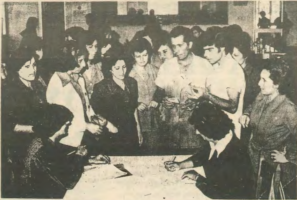
Εργάτες του Λαϊκού καφεκοπτείου συνδράμουν τους συναδέλφους τους απεργούς

Καλεί γι' αυτό όλους τους υποστηρίχτες και τις υποστηρίχτριες της καθώς και όσους άλλους (άλλες) ενδιαφέρονται να γράψουν ή να επικοινωνήσουν με την συντακτική επιτροπή.