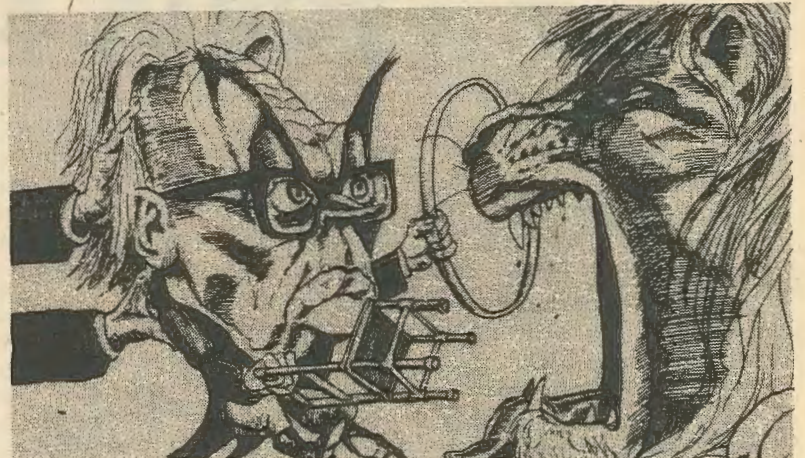
Από το αστικό έντυπο «Οικονομίστ»: Ο Φουτ προσπαθεί να δαμάσει το «λιοντάρι» της αριστεράς

Μεσα στο ίδιο το εργατικό κόμμα, οι δεξιοί-σοσι δηλαδή απέμειναν μετά την διασπαση των δεξιών που δημιούργησαν το Σοσιαλδημοκρατικό Κομμα - βρίσκονται, δίχως υπερβολή, στριμωγμένοι στη γωνία. Τρομοκρατημένοι από την άνοδο της αριστεράς πτέρυγας του κόμματος, και ανικανοί να ελεγχουν την επαναστατική πορεία στην οποία