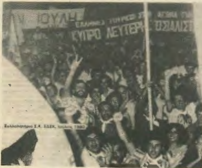
Υπάρχει μια ουσιαστική διαφορά ανάμεσα στα σημερινά συλλαλητήρια της ΕΔΕΚ κι αυτά που γίνονταν μερικά χρόνια πριν

Τόσο το συλλαλητήριο που διοργάνωσε η ΕΔΕΚ, όσο και το παγκύπριο συλλαλητήριο ήταν η επισφράγιση της χρεωκοπίας της πολιτικής, τόσο της δεξιάς όσο και της ηγεσίας των αριστερών κομμάτων. Και τα δυο συλλαλητήρια έδειξαν πόσο απαγοητευμένες είναι οι μάζες από τις ηγεσίες τους, και πως κανένα πια από τα παραμύθια του «Πατριωτισμού» δεν πείθει το λαό ότι το εθνικό πρόβλημα αλλά και τα κοινο-οικονομικά προβλήματα που αντιμετωπίζει θα λυθούν με την ενότητα και τον εθνικισμό.