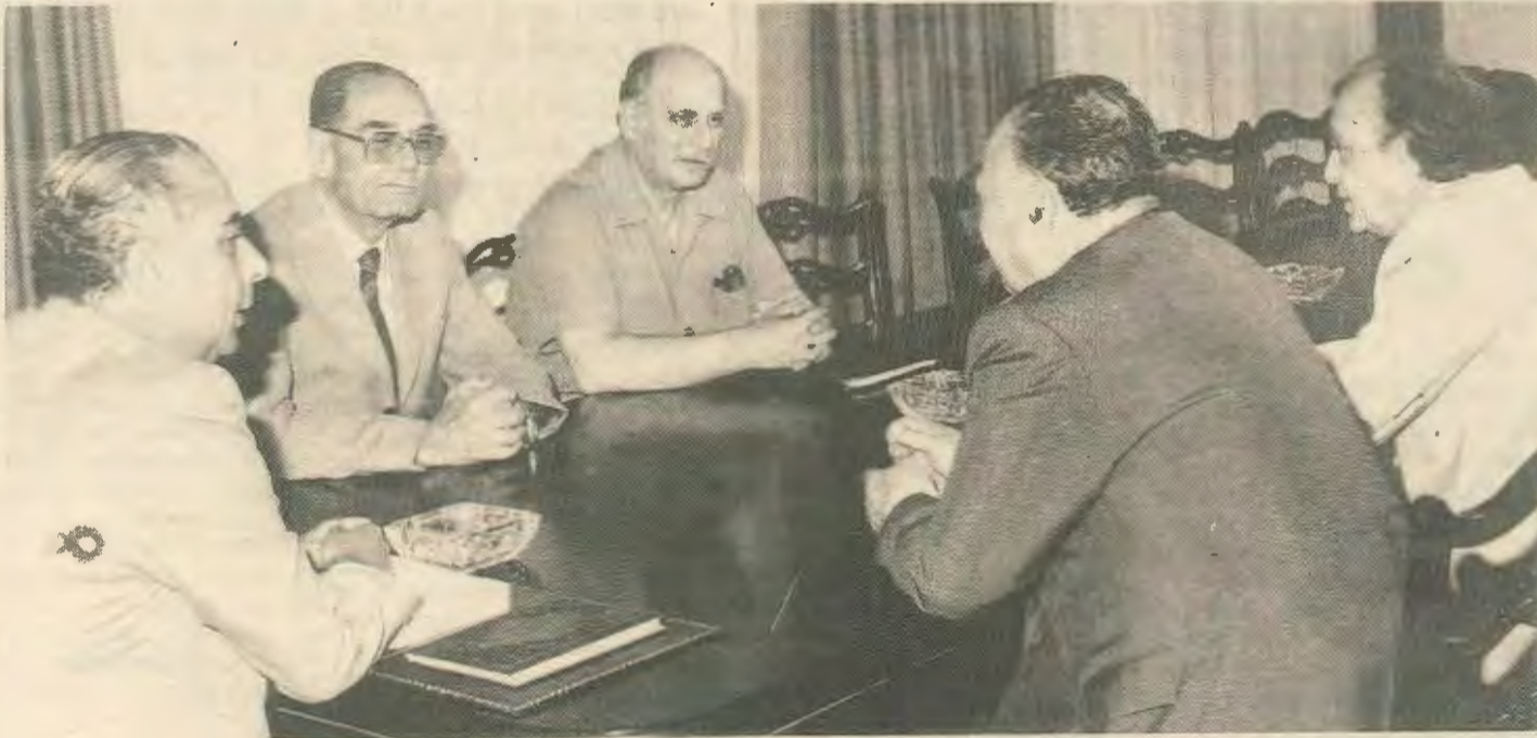
Λυσαριδής, Παπαϊωάννου, Ποσκώτης, Κληρίδης και Κυπριανού σε πρόσφατη συνάντηση μετά την ανακήρυξη κράτους στο Βορρά. Μ' αυτόν τον τρόπο η αριστερά γίνεται συνυπεύθυνη για την αποτυχία της δεξιάς. Στην ενότητα με τους αστούς πρέπει να αντιπαραταχθεί η ενότητα της αριστεράς.

Στη διεθνοποίηση της διπλωματίας πρέπει να αντιπαραθέσουμε μια διεθνή εκστρατεία σ' όλο τον κόσμο με κάλεσμα προς τις εργατικές οργανώσεις κι ιδιαίτερα όπου υπάρχουν Τ/Κύπριοι και Τούρκοι (Αγγλία, Γερμανία, Ελλάδα) να μας βοηθήσουν στην αποκατάσταση επαφής για τη χάραξη κοινής γραμμής ανάμεσα στους Ε/Κύπριους και Τ/Κύπριους αριστερούς.