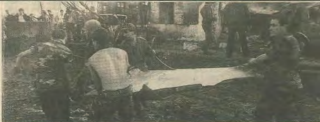
Λιβανέζοι στρατιώτες μεταφέρουν τα συντρίμια ενός από τα Αμερικάνικα αεροπλάνα που κατέρριψαν οι Σύριοι

Πρόσφατα παραιτήθηκε ο Πρωθυπουργός κι αργότερα ο υπουργός οικονομικών του Ισραήλ κι ένα κλίμα πολιτικής αστάθειας έχει καλύψει τη χώρα. Το εξωτερικό χρέος θα φτάσει φέτος τα 20 δισ. δολάρια που είναι το ψηλότερο κατά κεφαλή χρέος σ' ολόκληρο το κόσμο. Μέσα στο οικονομικό χάος που επικρατεί τελευταία οι μετο-