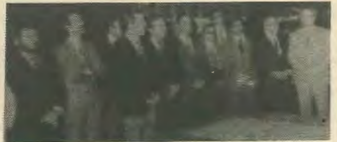
Συλλαλητήριο ΕΔΕΚ 19.11.83

Το ίδιο το συλλαλητήριο έσπρωξε πολύ πίσω αυτή την ενότητα. Οι Τ/κύπριοι αριστεροί εργάτες και νεολαίοι το είδαν ολόκληρο από την Κυπριακή τηλεόραση και δεν μπορεί παρα να