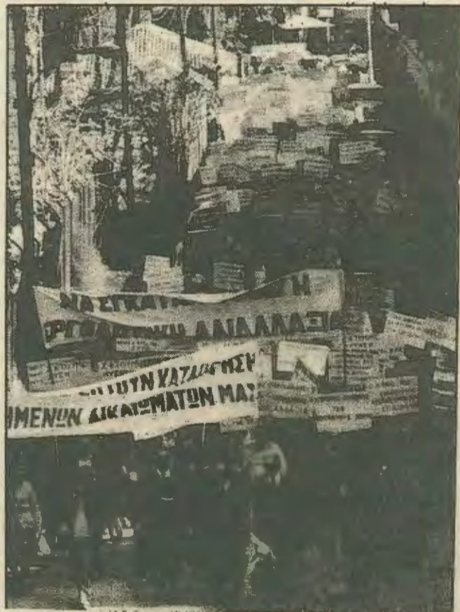
Οι οικοδόμοι στον αγώνα μας δείχνουν το δρόμο.

Η επίθεση των αστών/ κεφαλαιοκρατών και της κυβέρνησης βρίσκει δυστυχώς την εργατική τάξη απροετοίμαστη. Πολύ έγκαιρα η Σοσ. Έκφραση και οι Μαρξιστές της ΕΔΕΚ προειδοποιούσαν για το αναπόφευκτο της αντεργατικής επίθεσης οποιαδήποτε καπιταλιστική κυβέρνηση κι αν