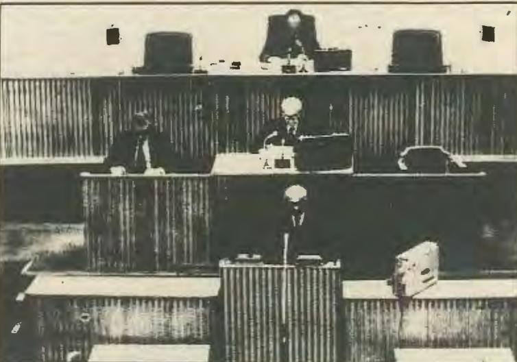
Η δύναμη του εργατικού κινήματος είναι τεράστια. Ακόμα και τη βουλή μπορεί να παραλύσει. Τελικά χρειάστηκε να καταφύγουν στα κασετόφωνα στη θέση των στενογράφων και να γυρέψουν δακτυλογράφηση/πολυγράφηση κειμένων εκτός βουλής.