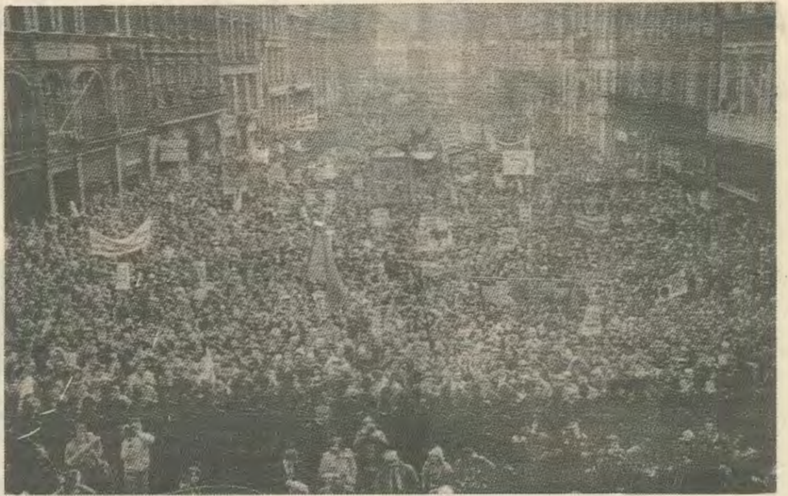
50,000 εργαζόμενοι μπροστά στο δημαρχείο του Λίβερπουλ. Ο Θατσερισμός δεν θα περάσει!