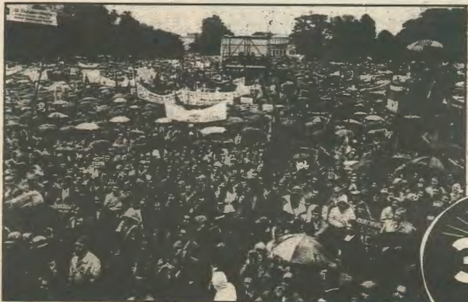
Αποψη της συγκέντρωσης 200.000 απεργών στη Βόννη.

Έντρομη η Γερμανική αστική τάξη προχώρησε σύμφωνα με το περιοδικό «Στερν» σε στρατιωτικές ασκήσεις προετοιμασίας για εμφύλιο πόλεμο στις οποίες χρησιμοποιήθηκαν βαριά πυροβόλα και χειροβομβίδες για ν' αντιμετωπιστούν υποτιθέμενες «ομάδες εξτρεμιστών» κατά τη διάρκεια εξέγερσης που «σημειώνεται στη Δυ-