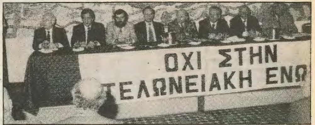
Απο τη σύσκεψη στο Φιλοξενία. Το σύνθημα «όχι στην τελωνειακή ένωση» δεν είναι αρκετό. Πρέπει να συνοδεύεται με πειστικό πρόγραμμα για έξοδο από την κρίση.

Τα καλέσματα των Αριστερών ηγεσιών για αξιοποίηση της μοντέρνας