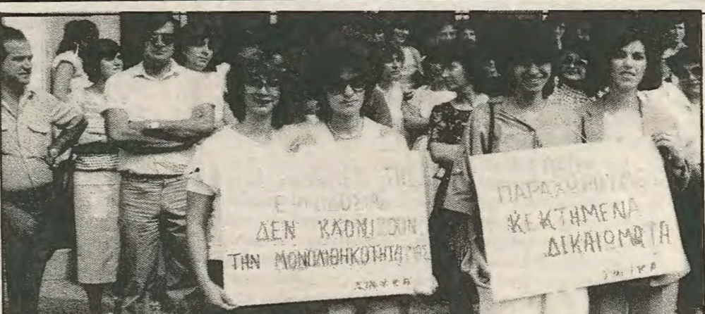
Απο της απεργιακής κινητοποίησης του 1985. Οι υπάλληλοι των Κ. Αερογραμμών είναι έτοιμοι για νέους αγώνες.

Για να μπορέσουμε να αντιμετωπίσουμε αποτελεσματικά τη νέα επίθεση της εργοδοσίας χρειάζεται η προετοιμασία και η γνώση πάνω σε όλα τα στάδια των συζητήσεων. Είναι απαραίτητο το γεγονός ότι οι υπάλληλοι κρατούνται σε άγνοια όσον αφορά τα αντιαιτήματα που έχει υποβάλει η εταιρία. Είναι επείγουσα να συγκαλεστον γενικές συνελεύσεις για ενημέρωση και έγκριση των χειρισμών από το σύνολο των υπαλλήλων. Ε.Μ.