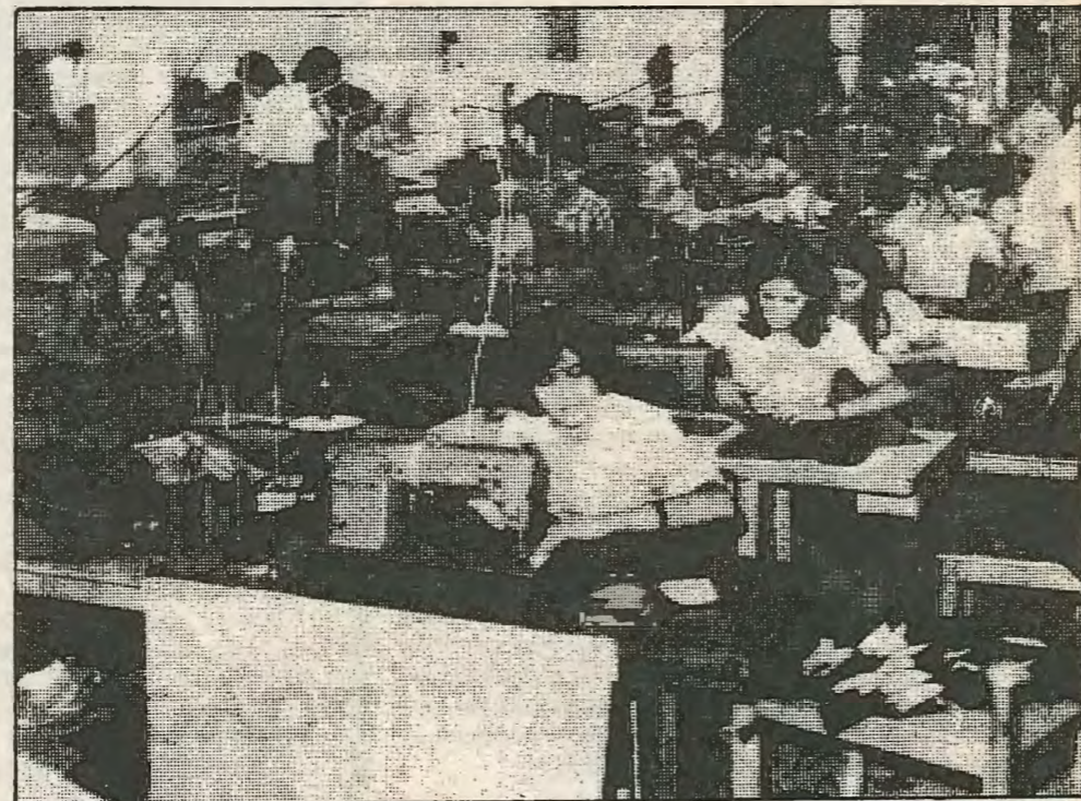
Το προχωρούν κάθε 1 λεπτό. Έτσι ανη να κάνουμε τη σειρά μας 40 κομμάτια την ώρα κάνουμε 60. Σκοτώνουμε στο ράφιο. Εγω για να γλυτώσω τις φωνές κάθω στο διάλειμμα και συμπληρώνω τα καθυστερημένα ή διορ-

«Εργάζομαι τρία χρόνια και παίρνω £27. Η ζωή στο εργοστάσιο είναι απελπισία. Συνέχεια μας απειλούν με απόλυση για να δουλεύουμε χωρίς διακοπή και να σιωπούμε. Μια φορά καθυστέρησε το λεωφορείο μου για τρία λεπτά και μου έδωσαν γραπτή προειδοποίηση. Οι επιστάτριες μας πιέζουν συνέχεια για μεγαλύτερη παραγωγή. Μια μπλούζα που ράβουμε την