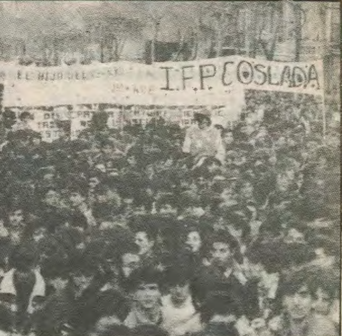
Μαδρίτη 13 Μαρτίου '87. 200.000 νεολαίοι της Μαθητικής Ένωσης και της Μαρξιστικής Τάσης Nuevo Claridad διαδήλουν κάτω από τα πανιά τους.

Μετά τους πρώτες πετυχημένες κινητοποιήσεις του Δεκέμβρη και αφού οι μαθητές εξασφάλισαν υπόσχεση για 25% αύξηση για...