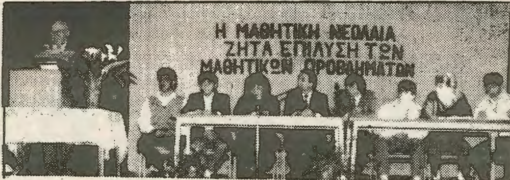
Το προεδρείο του συνεδρίου. Ο αγώνας για τον συνδικαλισμο ξεκίνησε. Το μαθητικό κίνημα χρειάζεται ηγεσία που να μπορεί να πολιτικοποιήσει τον αγώνα.

Στην Λάρνακα οι μαθητες πάλεψαν με το κράτος και κέρδισαν μια πρώτη μάχη. Το υπουργείο ανέχτηκε τελικά το συνέδριο. Απο αψη την άποψη αποτελεί σταθμο στην ανάπτυξη του μαθητικού κινήματος. Απο την άλλη όμως μπορεί να δώσει την αίσθηση της αφο-