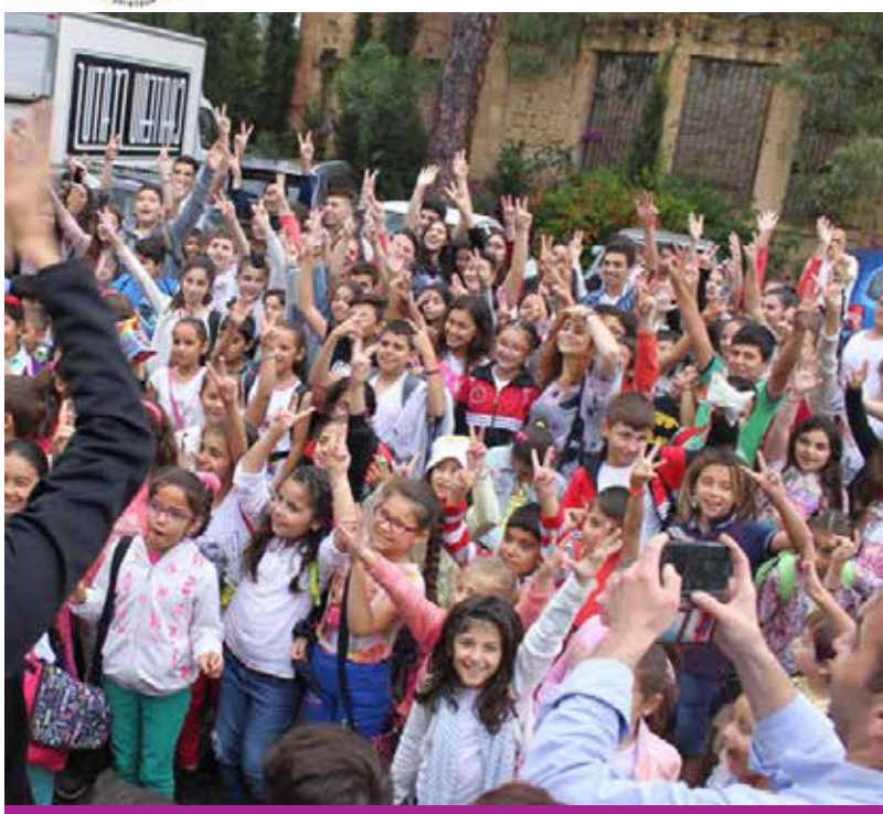
Education for a Culture of Peace, Η4C