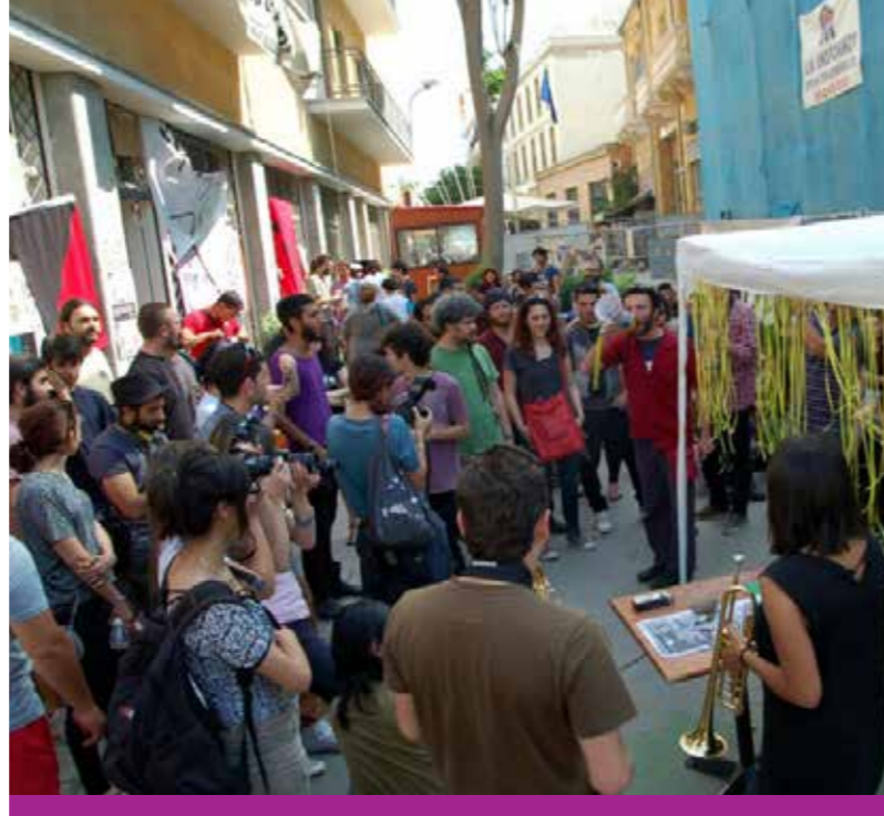
Κατάληψη Νεκρής Ζώνης, OccupyBufferZone (Οκτώβριος 2011-Απρίλιος 2012)