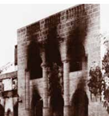
15, 20 Ιουλίου 1974. Πραξικόπημα, Εισβολή