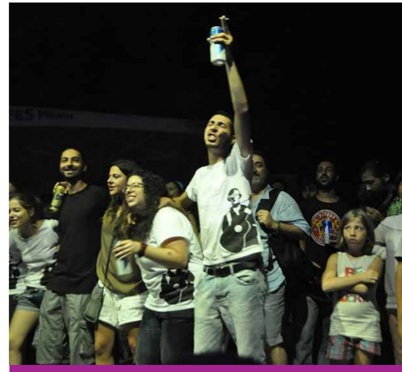
Αντιμilitarιστική Ειρηνική Επιχείρηση, 14 Αυγούστου 2013