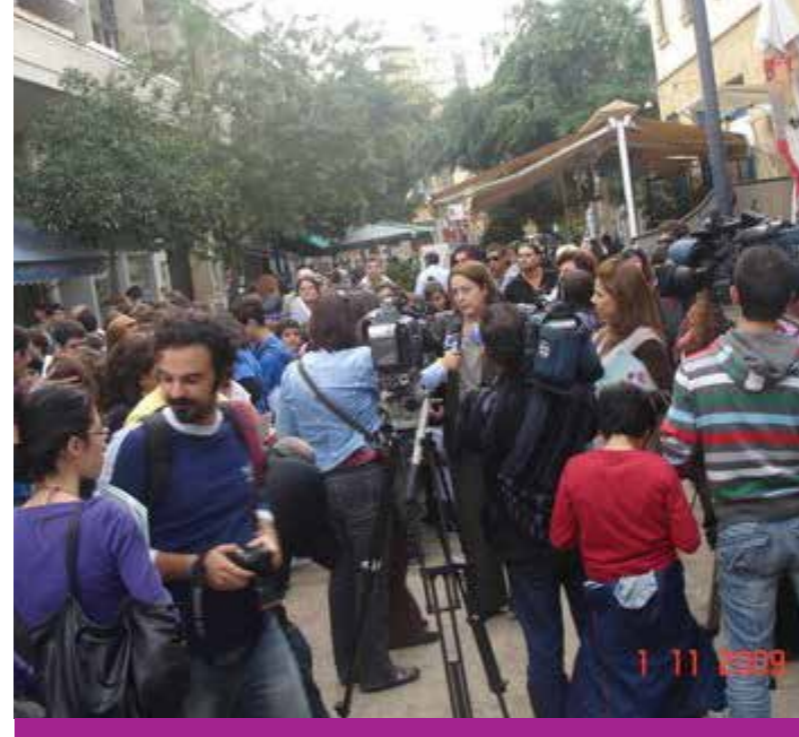
Περπατάμε μαζί και μαθαίνουμε τα μνημεία της πόλης μας, 1 Νοεμβρίου 2009