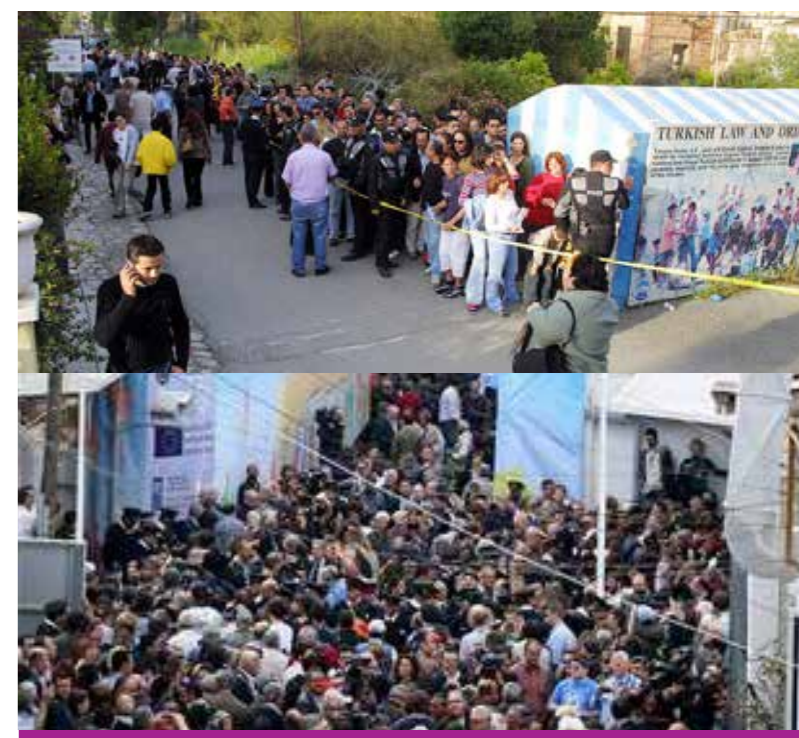
Το άνοιγμα των οδοφραγμάτων, 23 Απριλίου 2003, Άνοιγμα Λήδρας, 3 Απριλίου 2008