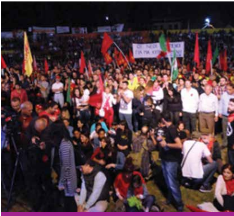
Δικαιοτική Εκδήλωση Πρωτομαγιάς, γήπεδο Τσετίγκαγια, 2014