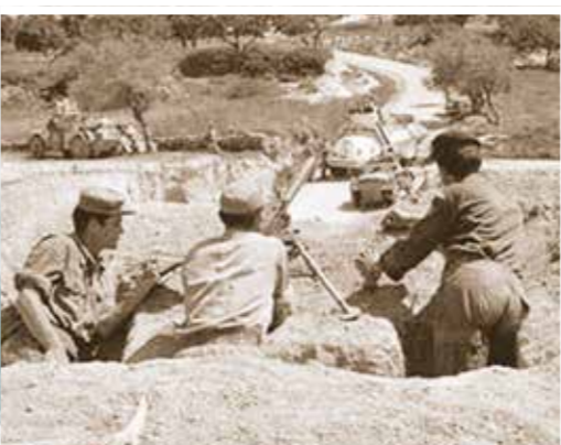
1964-1974. Ε/κ και Τ/κ πρόσφυγες και συγγενείς αγνοούμενων