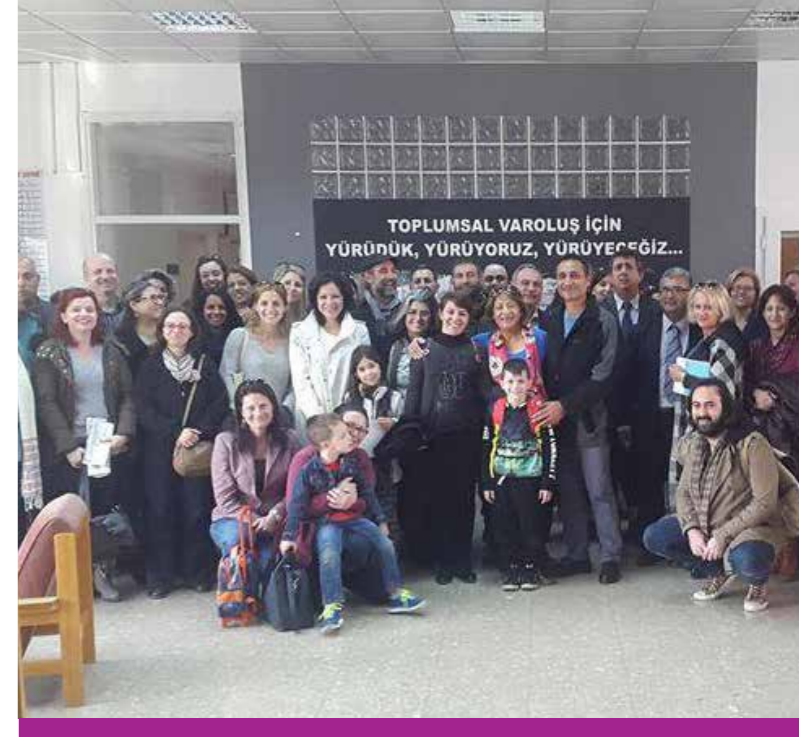
Επισκέψεις σε τ/κ σχολεία από Ε/κ εκπαιδευτικούς, 29 Δεκεμβρίου 2015