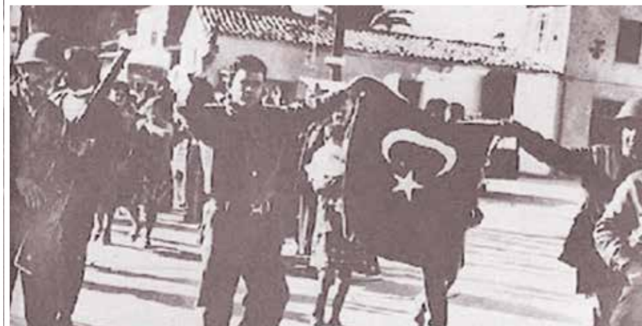
ΟΜΟΡΦΙΤΑ 1963. 25 Δεκεμβρίου, κατάληψη από τις δυνάμεις του Νίκου Σαμσιών