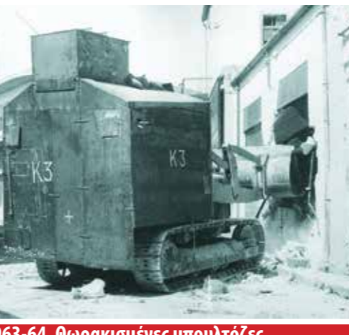
1963-64. Θωρακισμένες μπουλτόζες. Τα ταנקς των ελληνοκυπρίων "αγωνιστών"