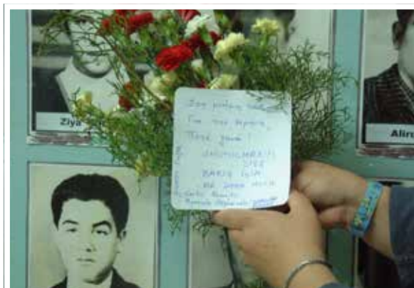
Κατάθεση στεφάνων στο μνημείο των Τ/Κ θυμάτων της Τάχης το 74 (στο χωριό Βουνό)