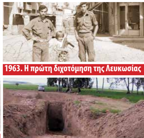
1963. Η πρώτη διχοτόμηση της Λευκωσίας