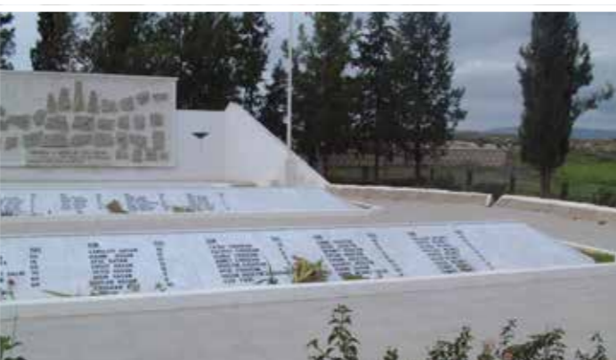
14 Αυγούστου 1974. Δολοφονία γυναικόπαιδων στα τουρκοκυπριακά χωριά Αλόα, Σανταλάρης, Μαράθα