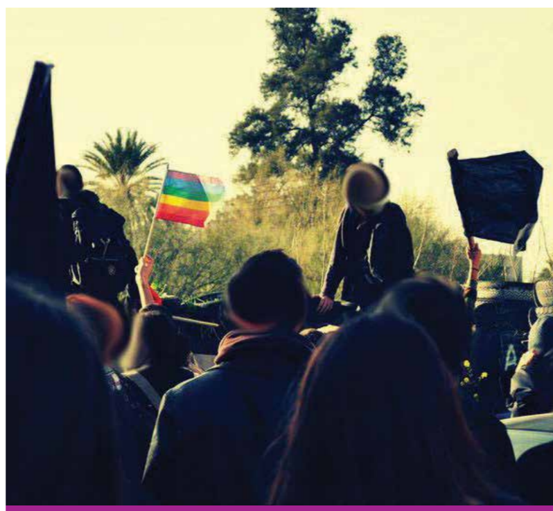
Πορεία για μια Αποστρατιωτικοποιημένη Λευκωσία, 19 Φεβράριου 2011