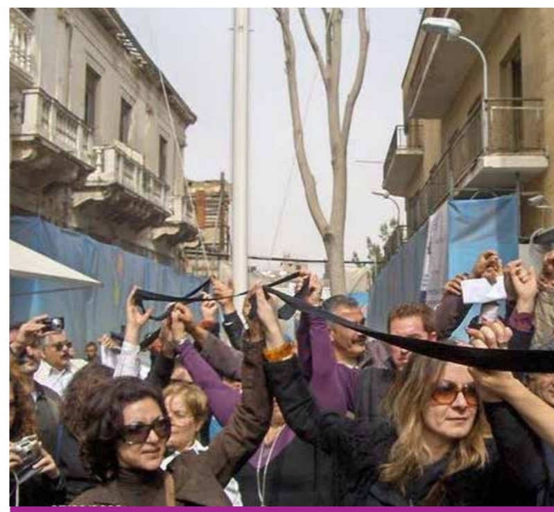
Δικαιοτική Πορεία για την Ελπίδα και την Αλήθεια, 7 Μαρτίου 2009