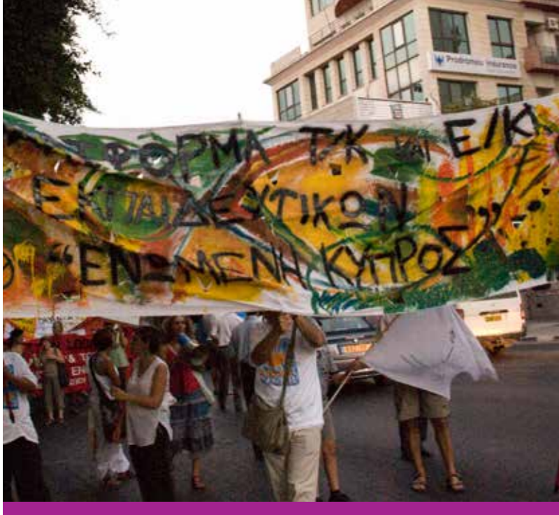
Δικαιοτική Πορεία Ειρήνης, 1 Σεπτεμβρίου 2010