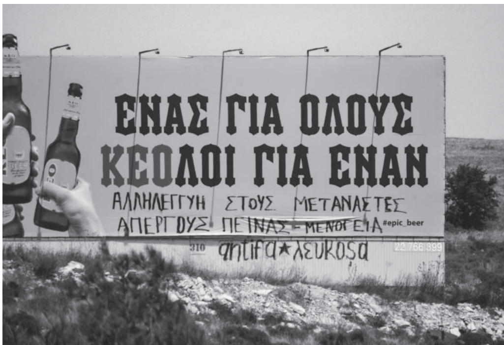
Σύνθημα αλληλεγγύης σε μετανάστες απεργούς πείνας, κρατούμενους στη Μενόγεια. Καλοκαίρι 2019.