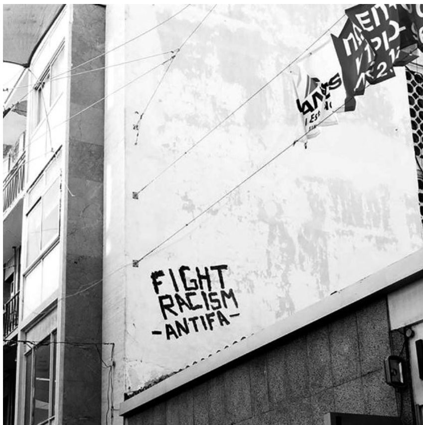
Οδός Λίδρας, 2014.