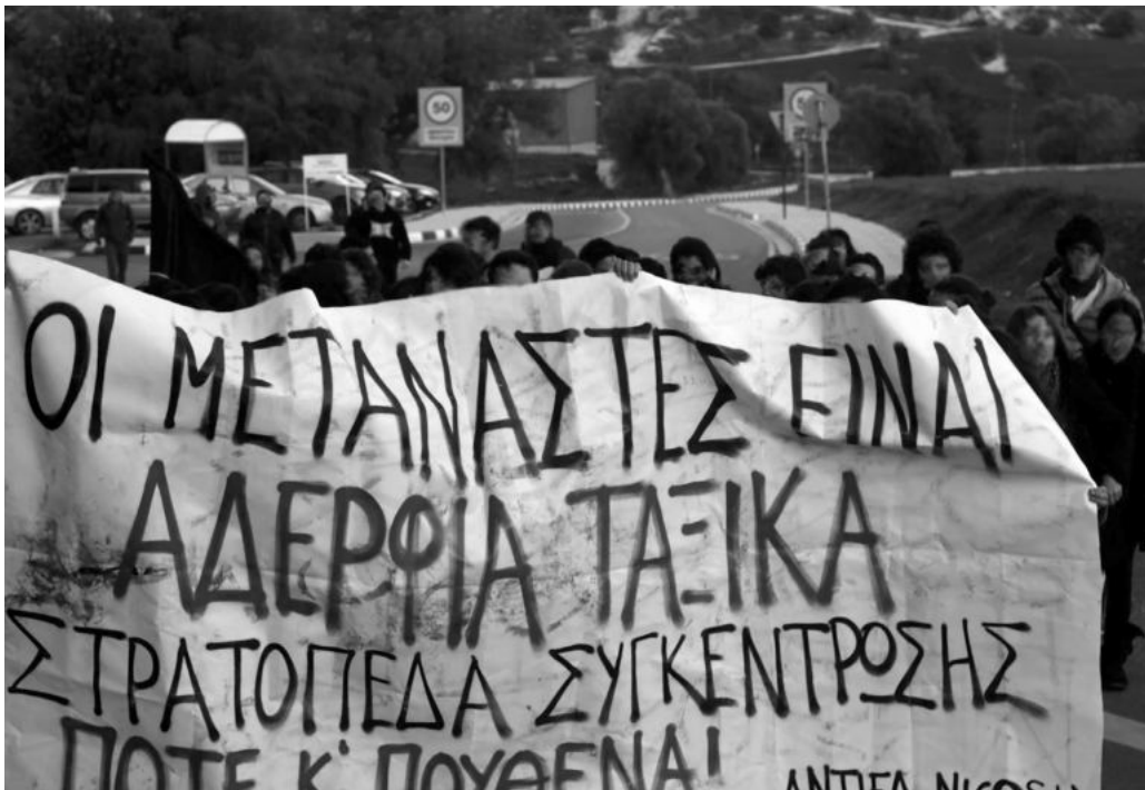
Διαδήλωση έξω από το κέντρο κράτησης μεταναστών στη Μενόγεια, 2014.