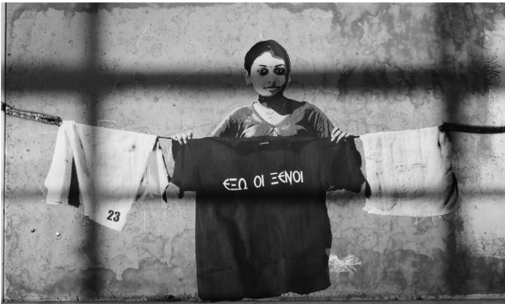
Wheat paste σε τοίχο, 2014.

Μια οικιακή εργάτρια κρεμάει άπλυτα. Μια μαύρη μπλούζα γράφει «έξω οι ξένοι».