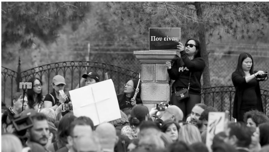
Διαδήλωση οικιακών εργατριών στο προεδρικό, Απρίλης 2019.