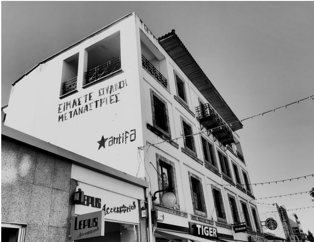
Είμαστε ούλλοι μετανάστριες. Οδός Λήδρας, 2014.