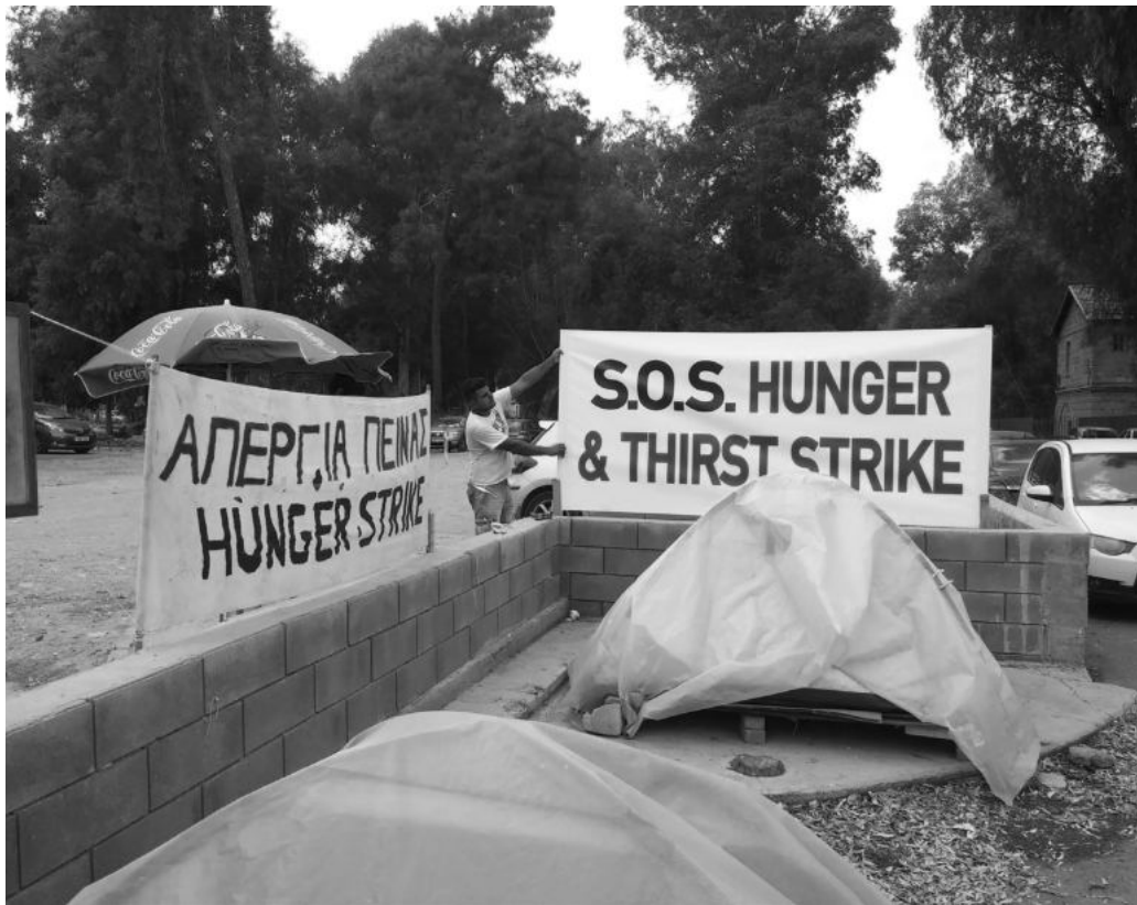
Αιτητές ασύλου σε απεργία πείνας έξω από το υπουργείο εσωτερικών, 2018.