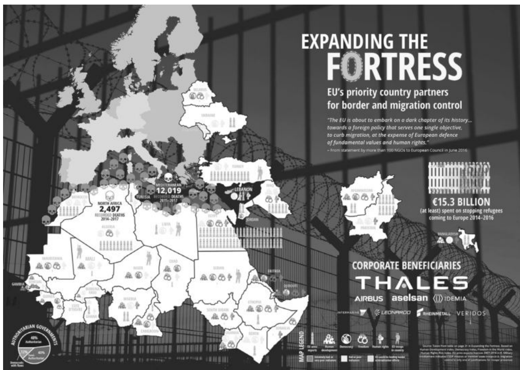
Μια σύντομη ματιά στο στρατιωτικο-βιομηχανικό σύμπλεγμα της Ευρώπης-Φρούριο.