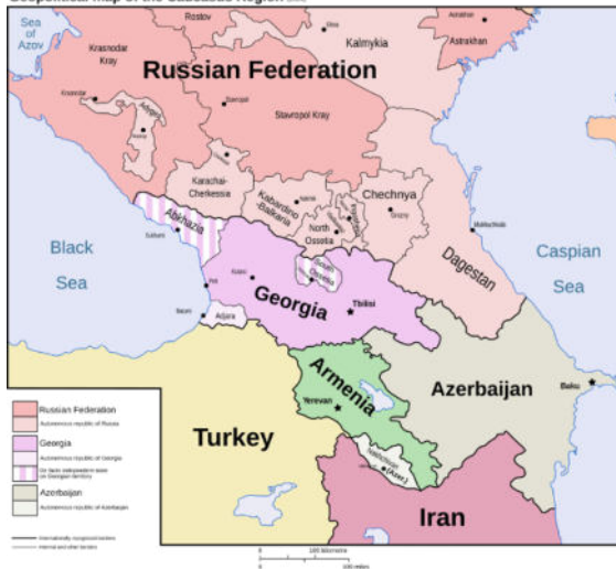
Geopolitical map of the Caucasus Region 2018

Όπως φαίνεται, προετοιμάζονται ή αρχίζει να ανοίγει η όρεξή τους για να επιχειρήσουν διείσδυση στην περιοχή του Καυκάσου με προετοιμασία του εδάφους στη Μ. Ανατολή, φέρνοντας το Κουρδικό ζήτημα στην πρώτη γραμμή και αξιοποιώντας την ανάγκη που έχει η άρχουσα τάξη του Ισραήλ να αναζητεί τρόπους επέκτασης του μικρού της χώρας, που θα την απομακρύνει από την εδαφική ασφυξία. Και αυτό μπορεί να το πετύχει με προσάρτηση περισσότερων εδαφών σε βάρος των Παλαιστινίων και με αμυντικές και στρατιωτικές συνεργασίες, όπως αυτές που ανέπτυξε με τις κυβερνήσεις της Ελληνικής