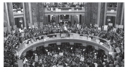
Το κατειλημμένο κοινοβούλιο στο Γουισκόνσιν

Στο μεταξύ, χιλιάδες πολιτειακοί υπάλληλοι και οι υποστηρικτές διαδηλώνουν επί μέρες τώρα στο Μάντισον του Γουισκόνσιν με αποτέλεσμα να έχουν κλείσει τα σχολεία σε πολλές περιοχές της πολιτείας.