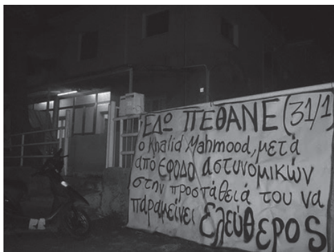
Ακολουθεί το κείμενο που μοιράστηκε:

6/2 - Παρέμβαση για τον θάνατο του Khalid Mahmood. Το μεσημέρι, σύντροφοι και συντρόφισσες κάναμε βόλτα στο πάρκο απέναντι απ'το παλιό νοσοκομείο και στην αφετηρία των λεωφορείων όπου μοιράσαμε το δελτίο για τον θάνατο του Khalid Mahmood. Πολλοί ήταν αυτοί που ανταποκριθήκαν θετικά, μιλίσαμε, εκφράστηκαν ανσυχίες και ανάγκη για κοινούς αγώνες.