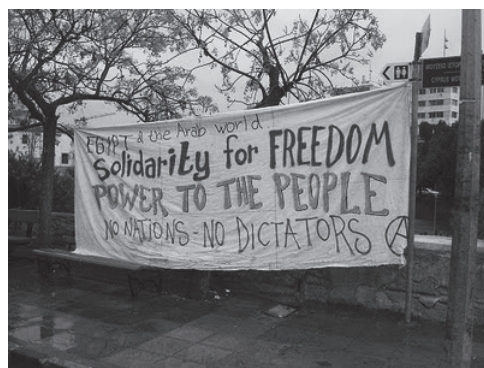
Το πανό από την πορεία αλληλεγγύης στους εξεγερμένους της Αιγύπτου

Συγκέντρωση αλληλεγγύης, Αιγυπτιακή Πρεσβεία: 6/2 - Συγκέντρωση έξω από την Αιγυπτιακή πρεσβεία. Η συγκέντρωση έξω από την πρεσβεία της Αιγύπτου ήταν μικρή σε αριθμό (40 - 50 Αιγύπτιοι και αλληλέγγυοι αναρχικοί / αντιεξουσιαστές). Φωνάχτηκαν συνθήματα για την παραίτηση Μουμπάρακ και μοιράστηκαν φυλλάδια στα Αραβικά.