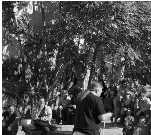
Αυτοδιαχειριζόμενο πάρκο Ναυαρίνου

Το πάρκο είναι τόπος δημιουργίας, χειραφέτησης και αντίστασης, ανοικτός σε δράσεις πολιτικές, πολιτιστικές, αντικαταναλωτικές κλπ. Φιλοδοχεί να είναι, ακόμα, ένας κήπος της γειτονιάς που φιλοξενώντας μέρος της κοινωνικής ζωής των κατοίκων της πέρα από λογικές κέρδους κι ιδιοκτησίας, λειτουργεί σαν τόπος παιχνιδιού και περιπάτου, συνείρεσης και επικοινωνίας, άθλησης, δημιουργίας και προβληματισμού, καταργώντας τα στεγανά της διαφορετικής ηλικίας, καταγωγής, μορφωτικού επιπέδου, κοινωνικής και οικονομικής κατάστασης. Το πάρκο συνδιαμορφώνεται από μια ανοικτή συλλογικότητα κι αλλάζει μέρα με τη μέρα. Κάθε ιδέα μπορεί να εκφραστεί και τίποτα δεν απορρίπτεται χωρίς διάλογο κι εγχειρήματα. Όμως οι συναινετικές αποφάσεις της συνέλευσης είναι δεσμευτικές για όλους. http://parkingparko.blogspot.com/