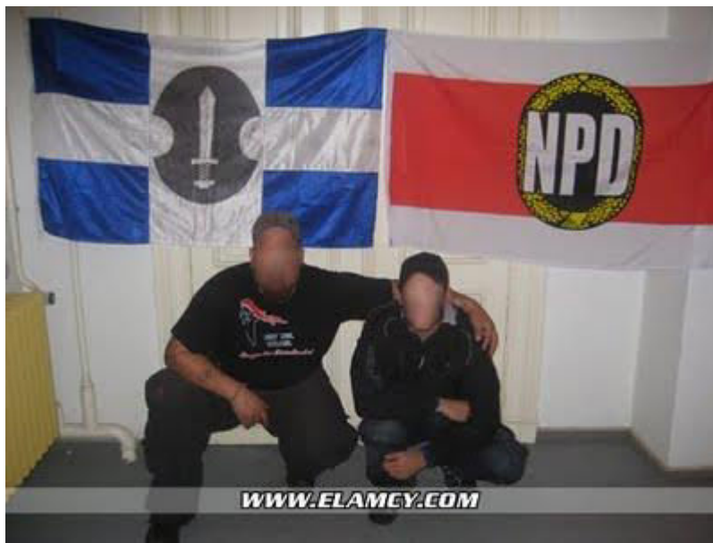
Επίσημη συνάντηση ΕΛΑΜ με το Γερμανικό νέο-νεοναζιστικό κόμμα NDP.