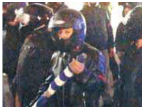
Μέλη του ΕΛΑΜ με ρόπαλα, κράνη και αυτοσχέδιες ασπίδες σε πορεία προς την πλατεία Φανερωμένης, 16/01/13.