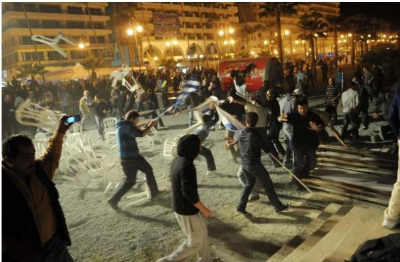
Ακροδεξιοί επιτίθενται στο φεστιβάλ Rainbow στην Λάρνακα, 5/11/10.