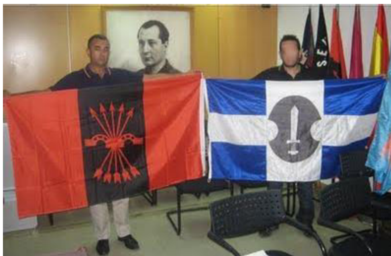
Επίσημη συνάντηση ΕΛΑΜ με το νέο-φασιστικό Ισπανικό κόμμα Falange.