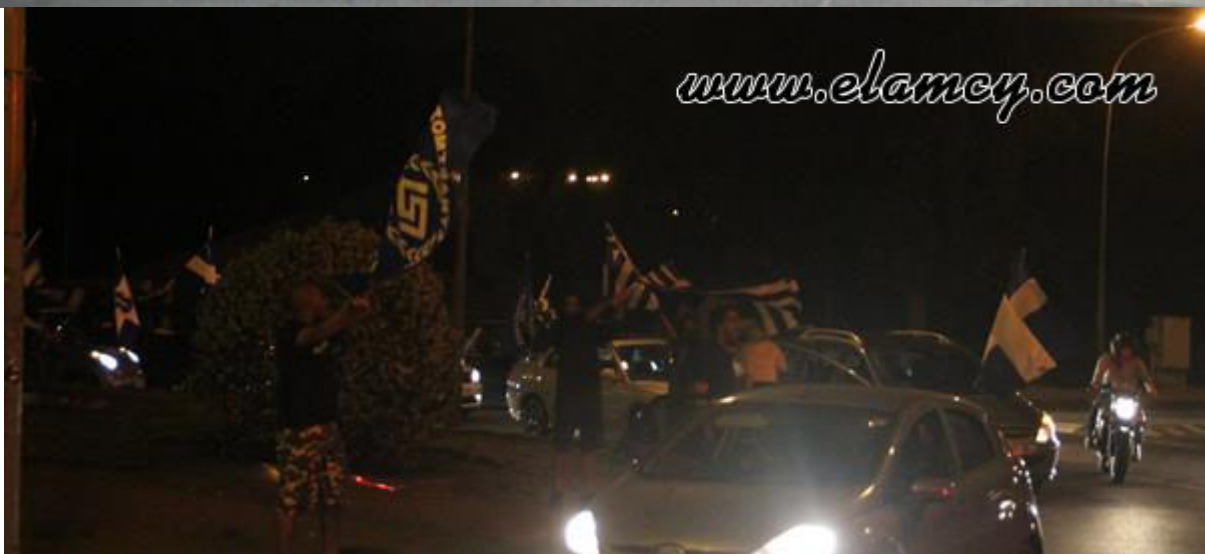
Πανηγυρισμοί ΕΛΑΜιτών για την εκλογή της νέο-ναζιστικής Χρυσής Αυγής στο Ελληνικό κοινοβούλιο, Μάης 2012.