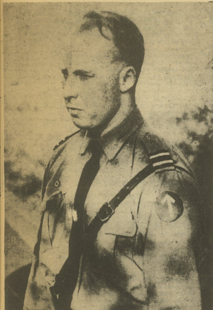
'Ο Ναζιστής άρχηγός του NATIONAL FRONT, John Tyndall. Κάποτε είχε ότι ο ΧΙΤΛΕΡ είχε δίκαιο !!! Κιζεί τώρα το NF έχοντας αυτό σαν βασική ιδέα. NF'in Nazi lideri J. Tyndall bir kere şöyle demisti; "Hitler doğru idi! Şimdi ise NF'i aynı prensipler üzerinde kuruyor.

ματες διαδηλώσεις και επιβλητικές παρελάσεις φωνάζοντας συνθήματα εναντίον των μαύρων εργατών και άκαιτώντας άμεσα τερματισμό στην μεταναστευση. Για χιλιάδες, έως εκατομμύρια, εργάτες συγχισμένους και άπογοτευμένους από την μαζική ανεργία, το χαμηλό βιοτικό επίπεδο, το ανέβασμα των τιμών, τις περιεκτικές και την δλη άντεργατική στάση της κυβέρνησης, ο ρατσισμός του National Front είναι κάτι που δημιουργεί έλπιφαιίνεται να προσφέρει μια πιθανή λύση στα προβλήματα που υπάρχουν. Όταν για παράδειγμα υπάρχουν 1 εκατομμύριο άνεργοι φαίνεται μια απλή άπάντηση να διωχτούν 1 εκατομμύριο μαύροι. Είναι για αυτό το λόγο που χιλιάδες εργάτες φηφισαν για το κόμμα αυτό και για τον ίδιο λόγο που πολλοί το υποστηρίζουν και μερικοί γίνονται μέλη του. Οι ρατσιστικές ιδέες είναι ένας καρκίνος για το εργατικό κίνημα. Όταν οι ιδέες αυτές οδηγήσουν σε δράση τότε ο καρκίνος αυτός γίνεται θανατηφόρος. ΕΙΝΑΙ ΓΙ ΑΥΤΟ ΠΟΥ ΠΡΕΠΕΙ ΝΑ ΚΤΥΠΗΘΟΥΜΕ ΤΟ NATIONAL FRONT