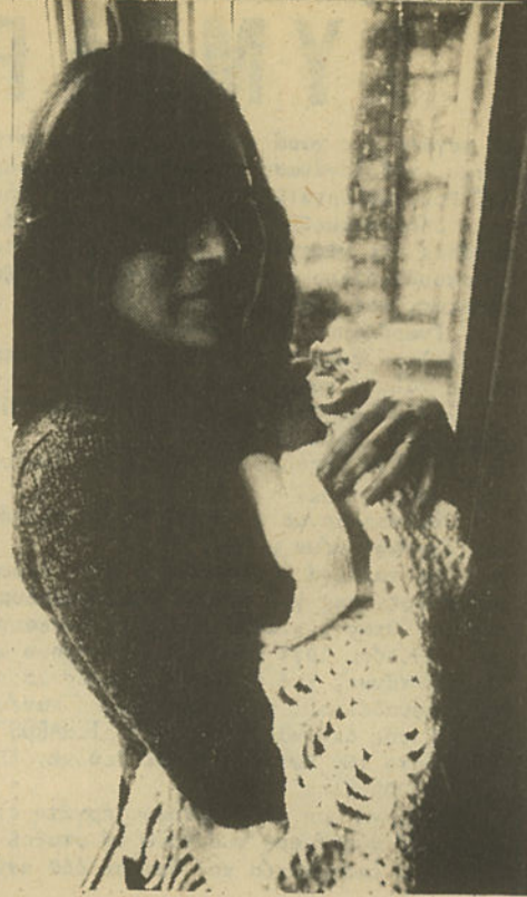
Voksa ölüm döşegimizde bile doktor bulamaz olacağız.

Netice olarak eski gücüm kalmadığından eskisi gibi çalışmıyorum. İyi ki artık eskisi gibi çalışmam gerekmiyor.