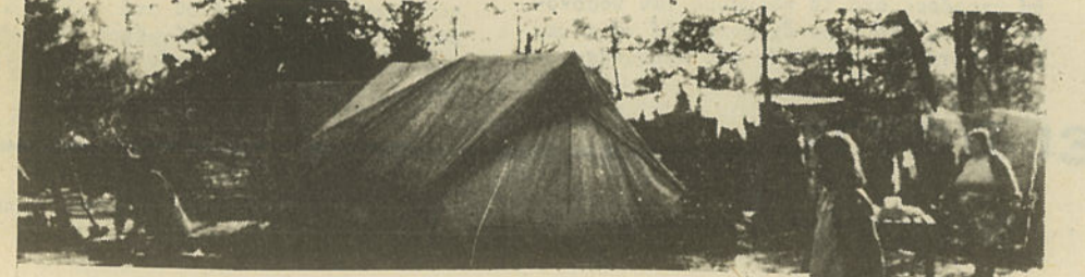
Και όλα αυτά από έλλειψη τσιμέντου. Για να βγάλουν μερικοί πιδκόλλα κέρδη.

Σοβαρή έλλειψη τσιμέντων παρουσιάστηκε στην Κύπρο, παρ' όλες τς ύποσχέσεις των διαφόρων ύπευθύνων των τσιμεντοποιών ότι θα προμήθειαν την Κυπριακή άγορά με 350-400 χιλιάδες τόνους χρονιάτικα. Έπίσης πριν λίγες βδομάδες ανακοινώθηκε ή αύξηση της τιμής του τσιμέντου. Για κάθε τόνο, ή τιμή αύξήθηκε 1 Κυπριακή λίρα, μιά αύξηση 8.7%. Στο μεταξύ οι έξαγωγές τσιμέντου συνεχίζονται και αυξάνονται. Υπολογίζεται ότι με τς έξαγωγές οι κεφαλαιοκράτες θα βγάλουν κέρδη μεταξύ 350-400 χιλιάδες λίρες πε-