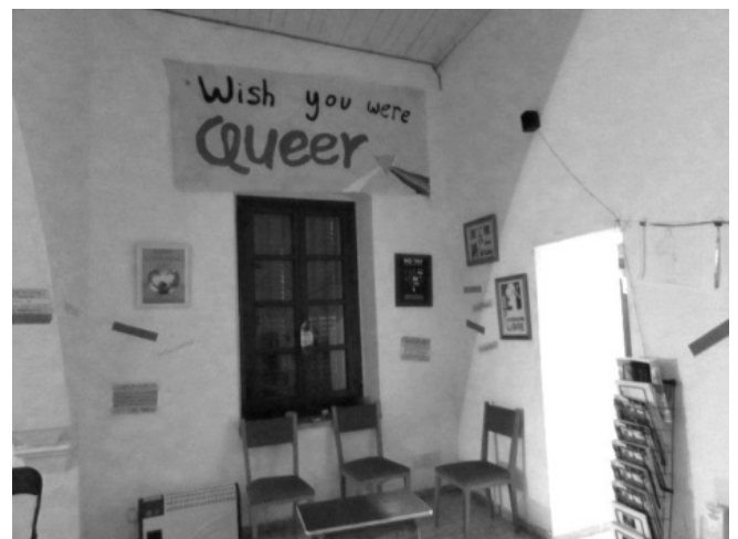
Όλες οι φωτογραφίες στην ενότητα αυτή είναι από το Φεστιβάλ Φύλα και Εξουσία, vol.3

την ομοκανονική) μήτρα όπου συγκεκριμένοι μορφολογικοί περιορισμοί που δεν συνάδουν με τις κυρίαρχες αφηγήσεις για το τι συνιστά ένα «ικανό» σώμα διαταράσσουν μια «αρμόζουσα» επιτέλεση σεξουαλικότητας, ενώ την ίδια ώρα θεωρούνται αναπόφευκτες συνέπειες του disability. Το τι με εκπλήσσει όμως είναι το ότι αυτές οι ableist υποθέσεις οικειοποιούνται και οριοθετούν την πολιτισμική νοητότητα τόσο των disabled όσο και των non-disabled ατόμων. Αυτή η οικειοποίηση (colonization) θα μπορούσε να διαβαστεί υπό την έννοια της κυβερνητικότητας (governmentality), η οποία έχει να κάνει με περίπλοκες σχέσεις ανάμεσα στους κυρίαρχους θεσμούς και τους πληθυσμούς, ενώ κύριο της χαρακτηριστικό είναι ότι επιβάλλεται στα άτομα μέσω εξω-θεσμικών τακτικών, οι οποίες εσωτερικεύονται οδηγώντας σε αυτο-ρυθμιστικές πρακτικές