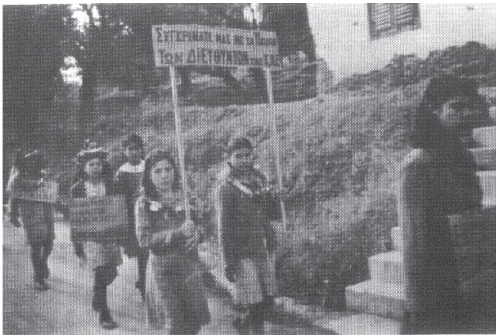
Στη μεγάλη απεργία των μεταλλωρύχων συμμετείχαν και οι γυναίκες και τα παιδιά των απεργών

Το βιβλίο του Παντελή Βαρνάβα «Κοινοί εργατικοί αγώνες ελληνοκυπρίων και τουρκοκυπρίων», έκδοση του 1997, αναφέρεται στην υπογραφή ανάμεσα στην ΠΕΟ και τις Τουρκικές Συντεχνίες Κύπρου, την 8 η του