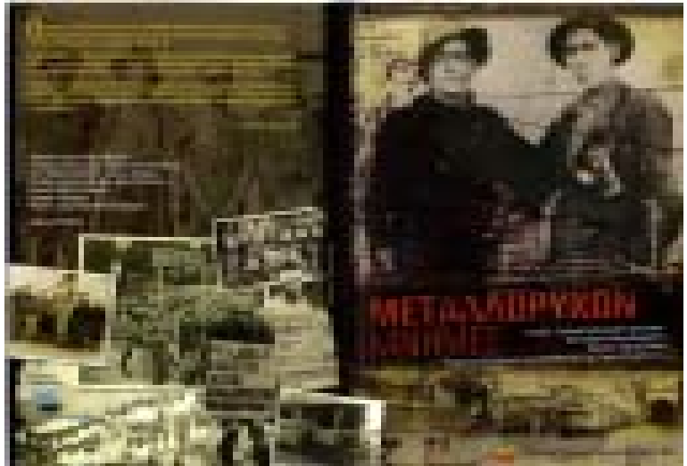
Το εξώφυλλο του DVD με το ντοκιμαντερ, που είναι σε σκηνοθεσία του Πασχάλη Παπαπέτρου, φωτογραφία Νίκου Αβρααμίδη και μουσική του Πάμπου Σακκά. Με συμβούλους παραγωγής τον Παντελή Βαρνάβα και τον δρ. Γεώργιο Κωνσταντίνου. Το ντοκιμαντέρ είναι παραγωγή της ΠΕΟ και έχει διάρκεια 60 λεπτά.

Πέρα από τους νεκρούς δεκάδες ήταν οι τραυματίες και οι μόνιμα ακρωτηριασμένοι εργάτες των μεταλλείων. Όπως γράφει ο Παντελής Βαρνάβας στο βιβλίο του «Ένας μεταλλωρύχος θυμάται» κάποιος νόμιζε ότι βρισκόταν σε περιοχή που πέρασε πόλεμο βλέποντας τον μεγάλο αριθμό των ακρωτηριασμένων αναπήρων που κυκλοφορούσαν στην περιοχή των μεταλλείων.