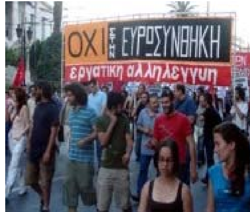
Φωτό πάνω: Διαδήλωση στην Αθήνα ενάντια στην Ευρωσυνθήκη. Φωτό δίπλα: Παφλέττα από την καμπάνια για το όχι στην Ιρλανδία

Παράλληλα, τα τελευταία χρόνια το αντιπολεμικό κίνημα της Ιρλανδίας δεν έχει σταματήσει να οργανώνει διαδηλώσεις και κινητοποιήσεις ενάντια στον «πόλεμο κατά της τρομοκρατίας» του Μπους. Κέντρο της δράσης του αντιπολεμικού κινήματος είναι να σταματήσει τη χρησιμοποίηση του αεροδρομίου Σάνον ως βάση μεταφοράς των αμερικάνικων στρατευμάτων στο Ιράκ και το Αφγανιστάν. Οι αντιπολεμικές κινήσεις της χώρας υπολογίζουν ότι, από το 2002 μέχρι και τον Οκτώβρη του