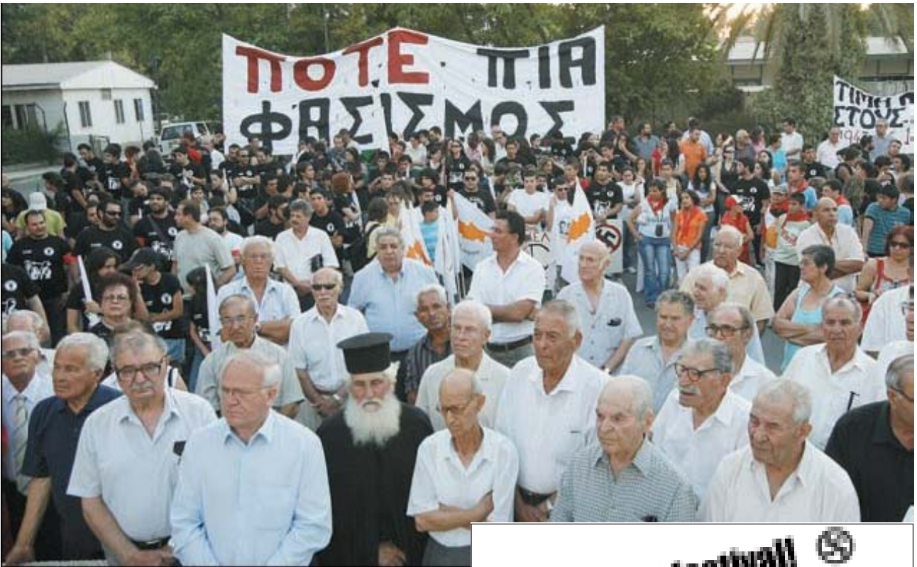
Φωτό πάνω: απο την εκδήλωση που οργάνωσε η ΕΔΟΝ με την ευκαιρία της κατάταξης των εθελοντών του ΑΚΕΛ στον Αγγλικό στρατό στον Β'ΠΠ.