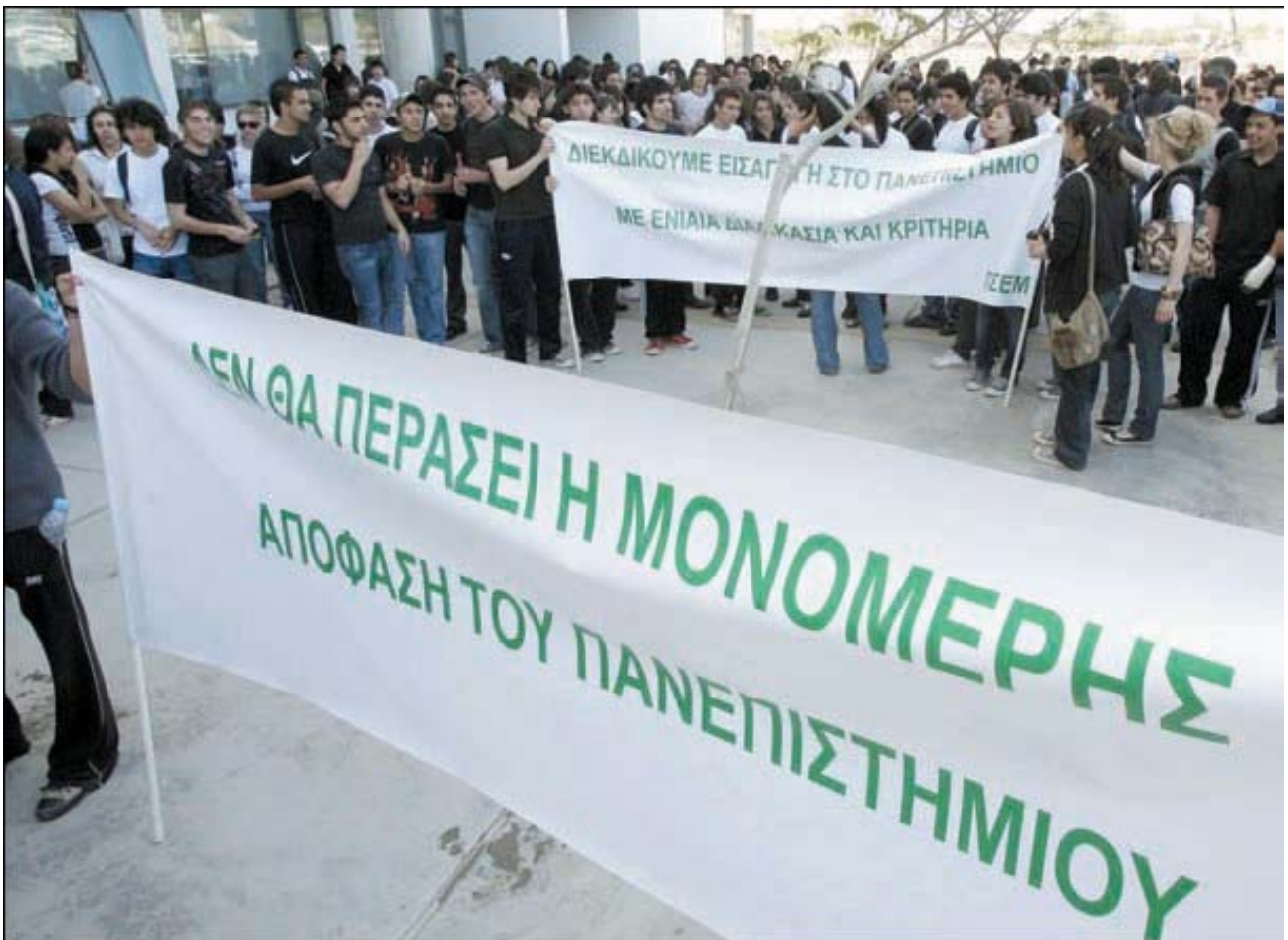
Με σύνθημα «Όχι στα GCE των ιδιωτικών, θέλουμε εξετάσεις των εισαγωγικών» οι μαθητές των δημοσίων σχολείων διαδήλωσαν στις 6/4/08 έξω από το κτήριο της Συγκλήτου στην πανεπιστημιούπολη

κόσκινο, τους καλύτερους, την ελίτ τους κρατά και τους υπόλοιπους τους απορρίπτει σαν άχρηστους, τους πετά σαν σκουπίδια