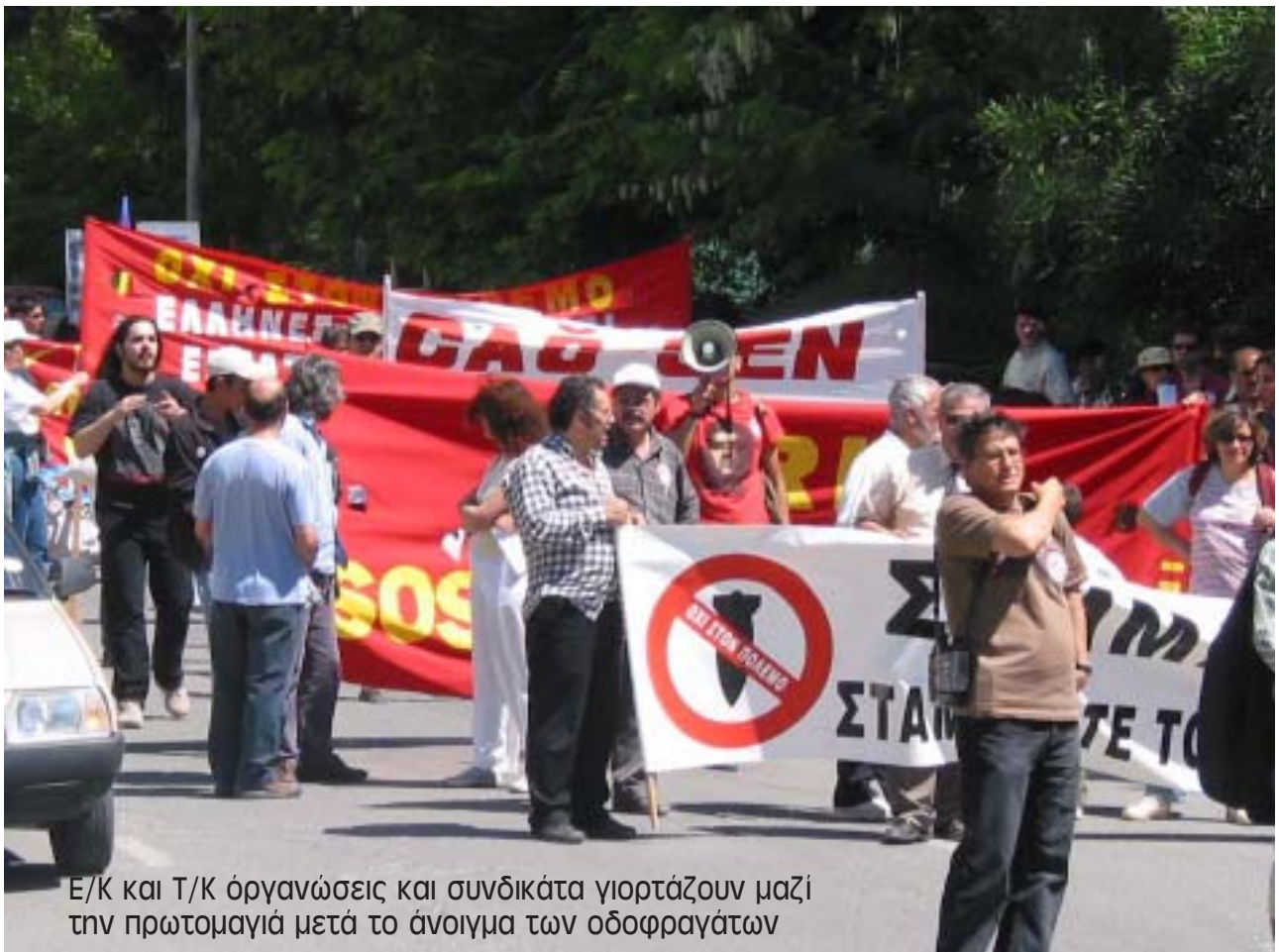
Ε/Κ και Τ/Κ οργανώσεις και συνδικάτα γιορτάζουν μαζί την πρωτομαγιά μετά το άνοιγμα των οδοφραγμάτων

Να σταματήσουμε τους ρατσιστές και τους φασίστες σελ. 4