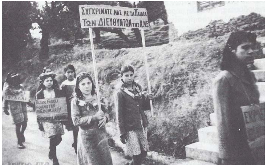
Τα παιδιά των μεταλλωρύχων διαμαρτύρονται επειδή η εταιρεία τους έκοψε το γάλα. Το πανό τα λέει όλα.

Η Εταιρεία με την αστυνομία απαντούν με νέες προκλήσεις και στις 8 του Μάρτη πυροβολούν εναντίον απεργών που προσπαθούν να εμποδίσουν απεργοσπάστες να ξεφορτώσουν ξυλεία από πλοίο στο λιμάνι του Ξερού (η μάχη του πλοίου όπως ονομάστηκε). Έξι απεργοί τραυματίζονται, ένας από αυτούς σοβαρά.