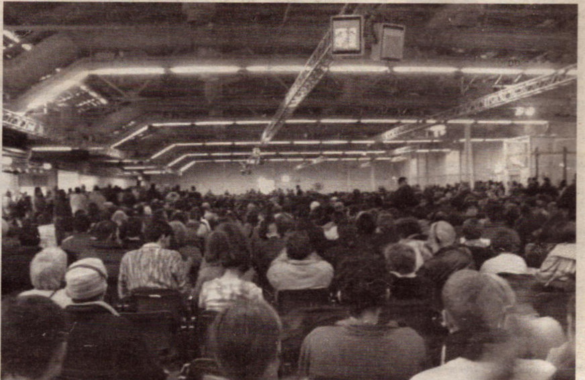
Σε κατάμεστες αίθουσες, πολλές φορές με ακροατήριο 5-6 χιλιάδες κόσμο έγιναν οι περισσότερες συζητήσεις στη Φλωρεντία

Την Πέμπτη το απόγευμα στην ανοικτή συγκέντρωση που έκανε η Τάση στην πλατεία της Φορτέτσα ο ενθουσιασμός και η αισιοδοξία ήταν