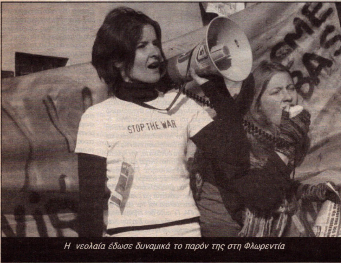
Η νεολαία έδωσε δυναμικά το παρόν της στη Φλωρεντία