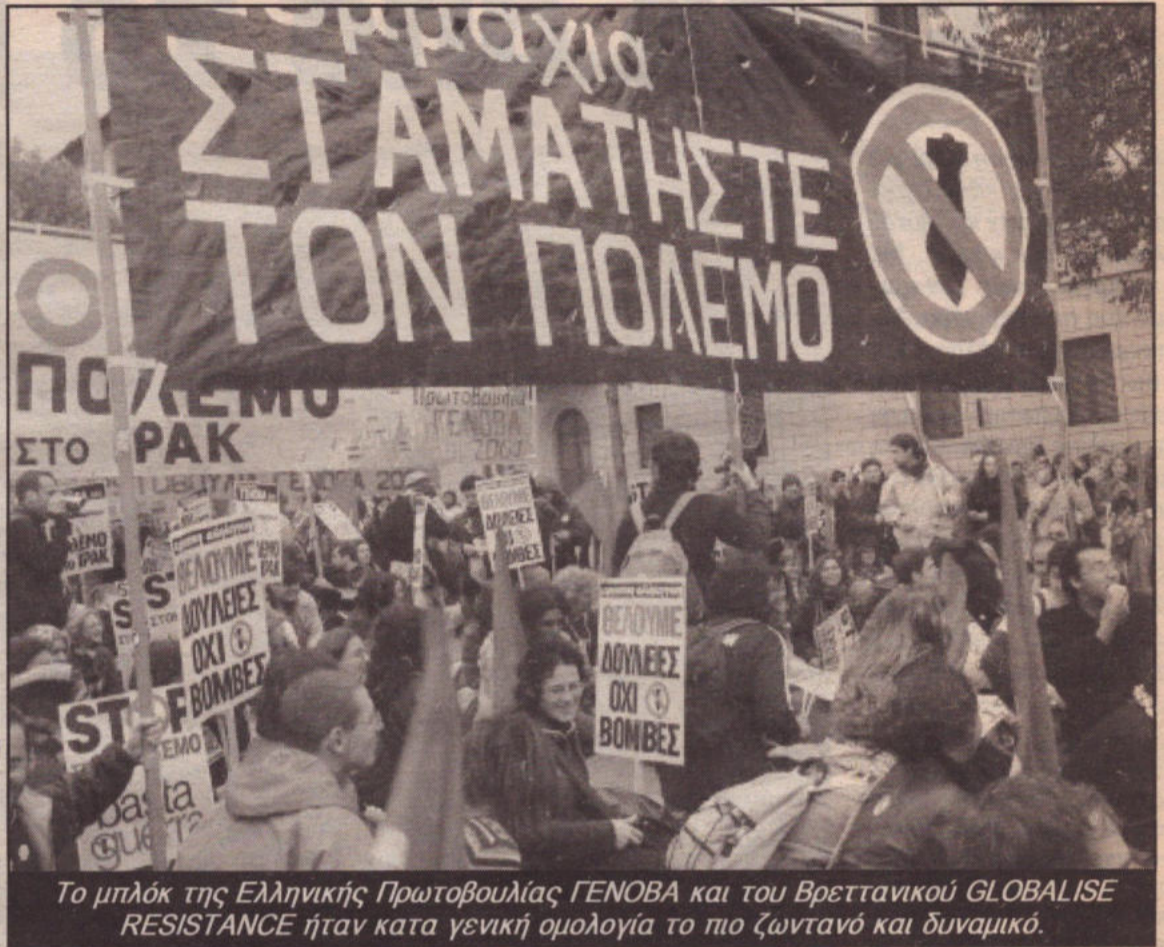
Το μπλόκ της Ελληνικής Πρωτοβουλίας ΓΕΝΟΒΑ και του Βρετανικού GLOBALISE RESISTANCE ήταν κατά γενική ομολογία το πιο ζωντανό και δυναμικό.