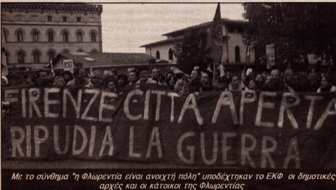
Με το σύνθημα "η Φλωρεντία είναι ανοιχτή πόλη" υποδέχτηκαν το ΕΚΦ οι δημοτικές αρχές και οι κάτοικοι της Φλωρεντίας