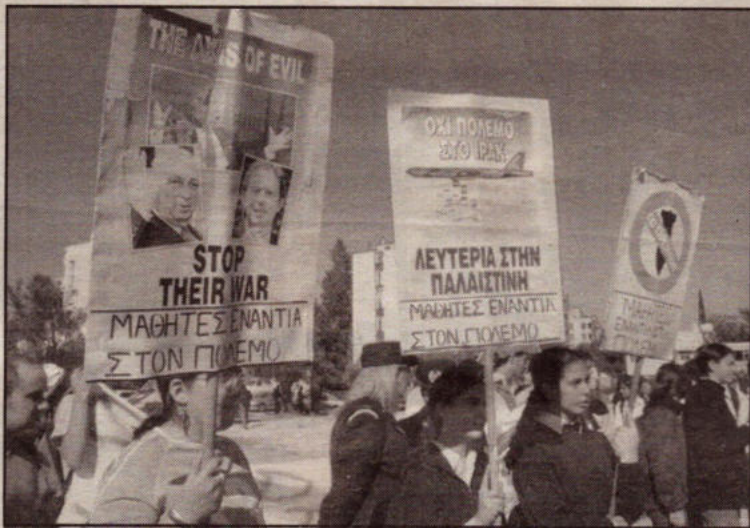
Πάνω φωτό, το μπλόκ της πρωτοβουλίας στη πορεία του πολυτεχνείου. Φωτό δεξιά, από την βιντεοπροβολή που έγινε στο Πανεπιστήμιο.

Ήταν ένα φιλμ που έκανε το αίμα των μαθητών να βράζει μπροστά στην φρίκη που επέφερε η πολεμική μηχανή των ΗΠΑ στον κόσμο του Ιράκ. Τερατογεννήσεις, μικρά μωρά να υποφέρουν από αρρώστιες που είχαν φοβερή άνοδο μετά τον πόλεμο του 1991, όπως την λευκαμία και τον καρκίνο. Αυτές οι σκηνές έσπρωξαν τους μαθητές να βγουν έξω να οργανωθούν και να κτίσουν μια επόμενη βιντεοπροβολή, αυτήν την φορά με