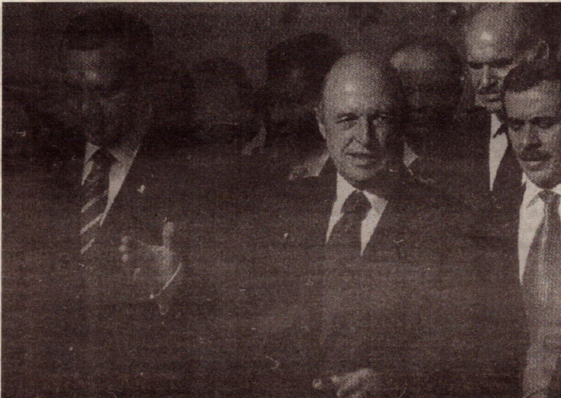
Οι μήνες του μέλιτος μεταξύ Ελλάδας και Τουρκίας κρατούν όσο εξυπηρετούνται τα συμφέροντα τους. Μετά ξανά προς την αντιπαράθεση και την σύγκρουση τραβούν.

ματικής δράσης σε ολόκληρο το νησί που αναπόφευκτα θα έλθει μετά από μερικά χρόνια θα είναι για τους ελληνοκύπριους καπιταλιστές μεγάλη ευκαιρία για μπιζινες ενώ θα μπορούν άμεσα να εκμεταλλευτούν τους τουρκοκύπριους εργάτες που βρίσκονται σε μειονεκτική θέση. Ήδη όλοι βλέπουν τους τουρκοκύπριους να «αντικαθιστούν» τους ξένους εργάτες.