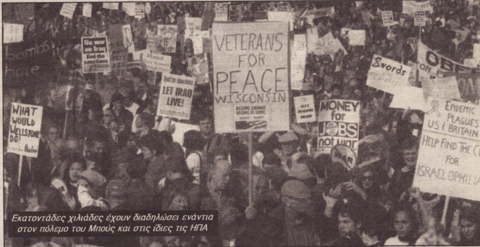
Εκατοντάδες χιλιάδες έχουν διαδηλώσει ενάντια στον πόλεμο του Μπους και στις ίδιες τις ΗΠΑ

Το κείμενο αντλεί μαθήματα από προηγούμενες απόπειρες για κατάληψη μεγάλων πόλεων. Η Βαγδάτη δεν