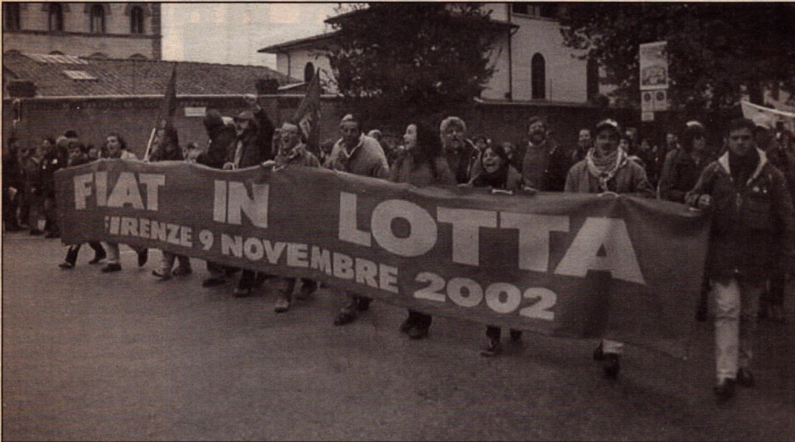
Οι εργάτες της FIAT, που αυτή την περίοδο κάνει μαζικές απολύσεις, μπήκαν επικεφαλής της πορείας