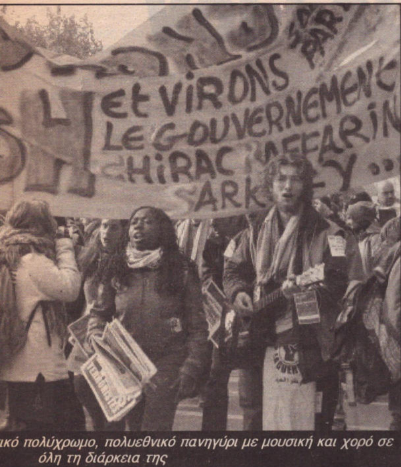
Πολύχρωμο, πολυεθνικό πανηγύρι με μουσική και χορό σε όλη τη διάρκεια της