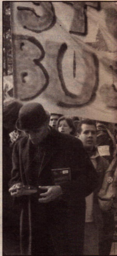
Η πορεία ήταν ένα πραγματικό γεγονός