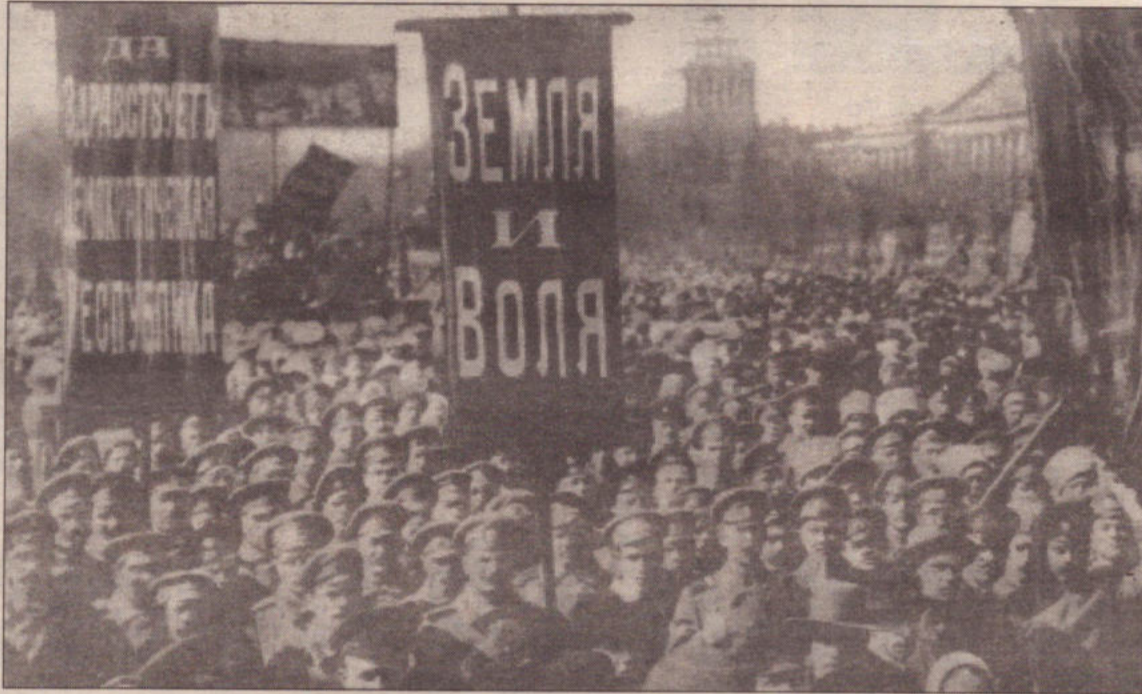
Εργάτες και στρατιώτες διαδηλώνουν στην Πετρούπολη το 1917. Σε ένα από τα πανά που κρατούν γράφει "κάτω ο παλιός κόσμος"

Αντέξε μέχρι το τέλος της βράρας. Αναγκάστηκε να παραδοθεί όταν τα κανόνια στράφηκαν απειλητικά κατά πάνω του. Στην Μόσχα οι μάχες διάρκεσαν περισσότερο, αλλά σύντομα όλη η χώρα βρέθηκε στα χέρια των επαναστατών.