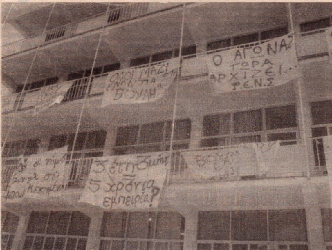
Μπορεί στο τέλος με τον αγώνα τους οι φοιτητές την νοσηλευτικές να κέρδισαν αλλά πολλά άλλα κομμάτια εργαζομένων νοιώθουν προδομένα από την κυβέρνηση της "αλλαγής"

Στα μέτρα που προτείνει είναι ο περιορισμός των δικαιούχων για τα επιδόματα τέκνου και της φοιτητικής χορηγίας. Ο τερματισμός της ετήσιας αναπροσαρμογής του επιδόματος τέκνου βάση του ρυθμού πληθωρισμού. Ο διπλασιασμός της συνεισφοράς των δημοσίων υπαλλήλων στο Ταμείο Κοινωνικών Ασφαλίσεων και η ταυτόχρονη περικοπή της αντίστοιχης συνεισφοράς της Κυβέρνησης. Η συγκράτηση του ρυθμού αύξησης των συντάξεων και των δημοσίων βοηθημάτων. Παγοποίηση μισθών και ωφελημάτων στο ευρύτερο δημόσιο τομέα. Αύξηση του ορίου αφιπηρετήσεων από τα 60 σε 63 για το δημόσιο τομέα και από 63 σε 65 στο ιδιωτικό. Παρά το ότι δηλώνει ότι δεν είναι στις προθέσεις της η επιβολή νέων φορολογιών εισηγείται νέα φορολογία για τα κινητά τηλεφώνια (2 λίρες το μήνα) και προτίθεται να αυξή-