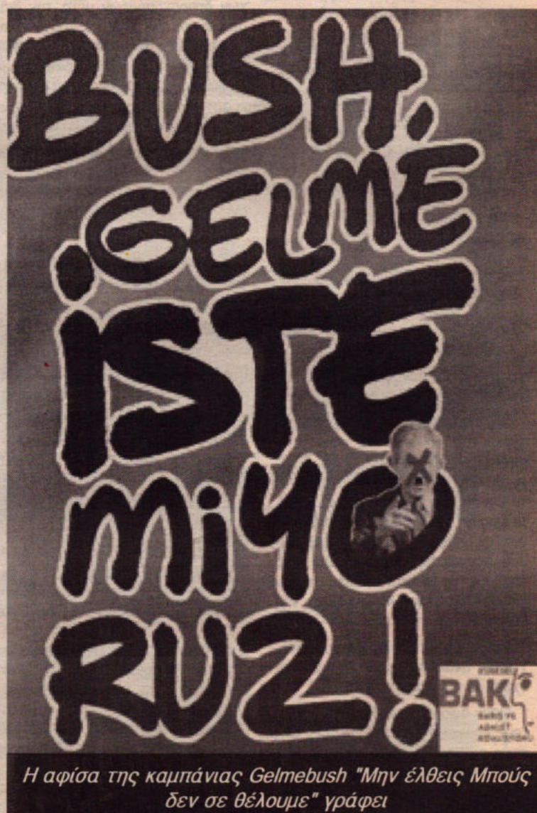
Η αφίσα της καμπάνιας Gelmebush "Μην έλθεις Μπούς δεν σε θέλουμε" γράφει

Τα μέτωπα της πάλης ενάντια στον πόλεμο και ενάντια στη λιτότητα είναι κοινά. Οι εργαζόμενοι που απεργούν τις τελευταίες βδομάδες στην Ελλάδα, οι νοσοκομειακοί οι εργαζόμενοι στο Σκαρμαγκά, οι συμβασιούχοι, όλα τα εργατικά κομμάτια που αγωνίζονται έχουν εκφράσει Ξανά και Ξανά την αντίθεσή τους στον πόλεμο. Ολοι μαζί μπορούν να ενωθούν σε μια πανίσχυρη μαζική αντίσταση στην κυβέρνηση του Καραμανλή. Η τύχη του Αθνάρ θα σιάζει τα βράδια πολλών από αυτούς που αποτελούν σήμερα τη συμμαχία των "προθύμων"