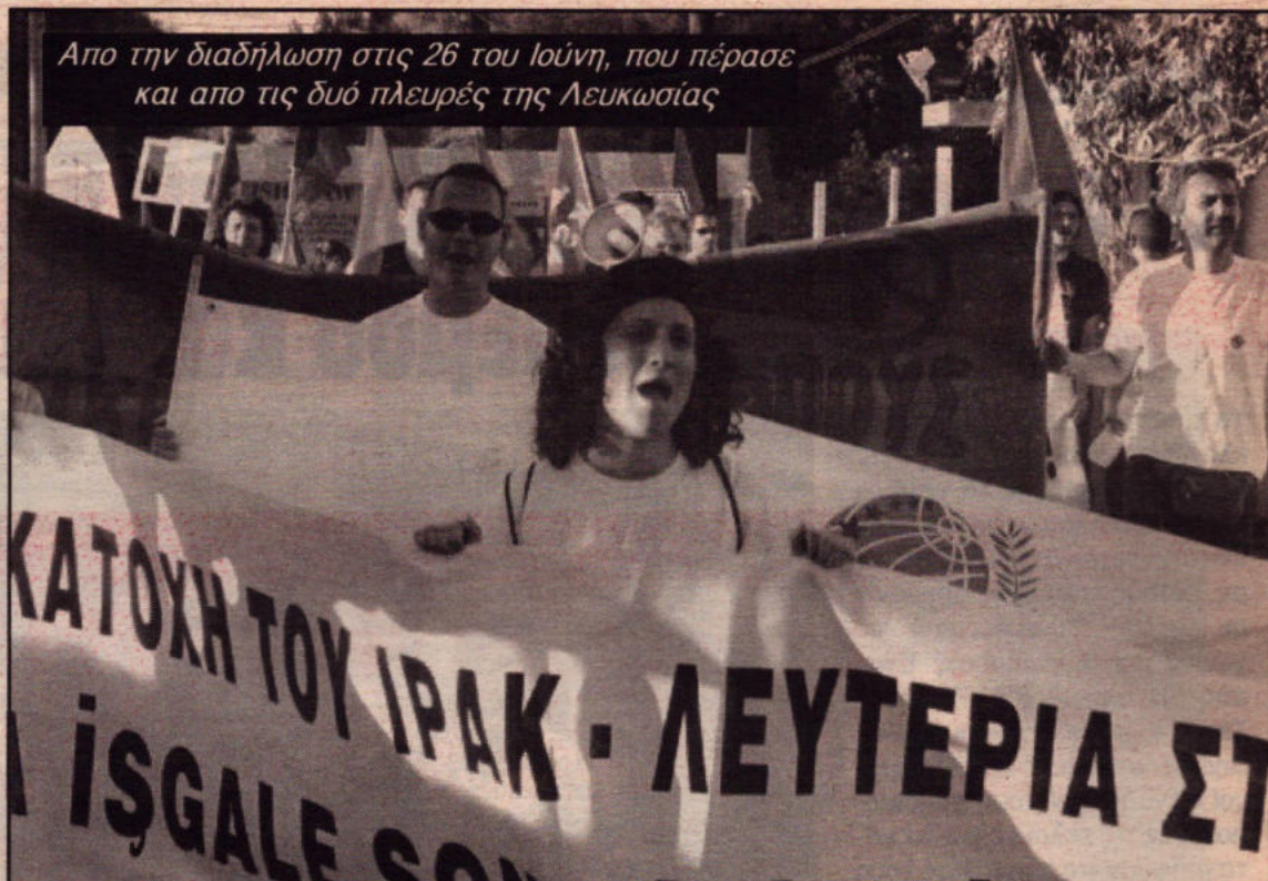
Απο την διαδήλωση στις 26 του Ιούνη, που πέρασε και από τις δύο πλευρές της Λευκωσίας

Ούτε τις φιέστες τους δεν μπορούν να οργανώσουν με τον τρόπο που θέλουν οι δυνάμεις κατοχής στο Ιράκ. Η "μεταβίβαση εξουσίας" που προετοιμαζόταν εδώ και καιρό για τις 30 Ιούνη, μεταφέρθηκε εσπευσμένα δύο μέρες νωρίτερα και έγινε τη Δευτέρα 28 Ιούνη, από φόβο ότι θα γίνονταν τόσες πολλές και συντονισμένες επιθέσεις της Αντίστασης στις 30 Ιούνη που θα έκλεβαν την παράσταση.