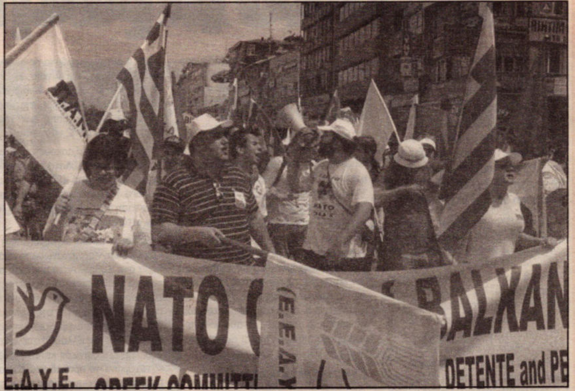
Απο τις διαδηλώσεις στην Ισταμπούλ ενάντια στη σύνοδο του ΝΑΤΟ και την παρουσία των Μπους και Μπλερ

αντίστασης ενάντια στην κατοχή στο Ιράκ είναι, όμως, σήμερα φανερό σε όλους μέσα και έξω από τη Μέση Ανατολή. Αυτός είναι ο λόγος που οι Βρετανοί ψηφοφόροι μαύρισαν τον