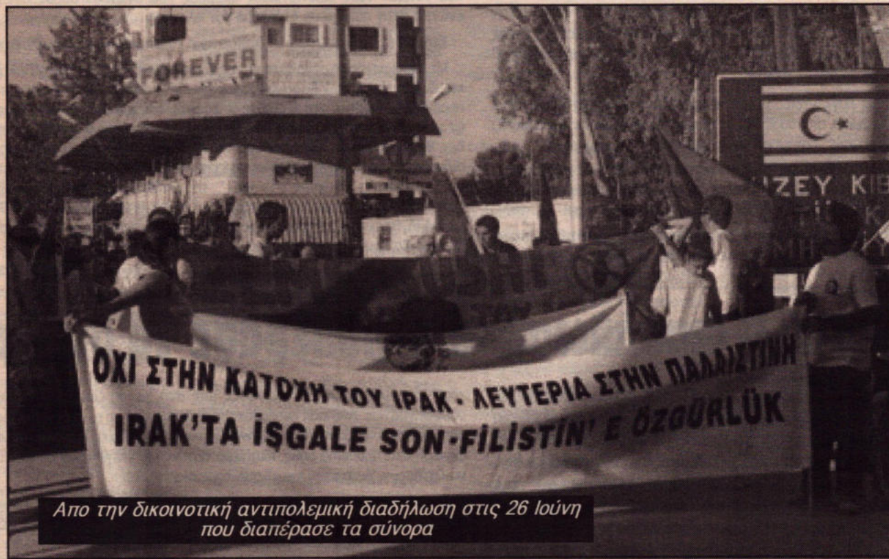
Από την δικινοτική αντιπολεμική διαδήλωση στις 26 Ιούνη που διαπέρασε τα σύνορα

Πέρσι μετά το άνοιγμα των συνόρων και το μεγάλο συναπάντημα των απλών ανθρώπων των δύο πλευρών, για πρώτη φορά μετά από 40 χρόνια πολέμων και συγκρούσεων εμφανίστηκε ένα κλίμα φιλειρηνικής διάθεσης, συμφιλίωσης και συναδέλφωσης σε μαζική κλίμακα. Στο πολιτικό σκηνικό εισέβαλε ξαφνικά και απροειδοποίητα ένας νέος παίκτης, ένα κίνημα από τα κάτω που μπορούσε να επηρεάσει τις εξελίξεις προς όφελος των απλών ανθρώπων και των δύο πλευρών. Εκείνο το κλίμα είναι που κατάφεραν να αναστρέψουν με το σχέδιο Ανάν και τα δημοψηφίσματα. Ξαναέσπρωξαν τον κόσμο να οχυρωθεί μέσα στη κοινότητα του και με βάση την εθνική του ταυτότητα και οι πρωτοβουλίες πέρασαν ξανά στα χέρια των διάφορων πολιτικάντηδων των δύο πλευρών και των ιμπεριαλιστών.