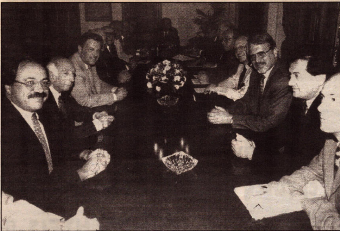
Ο Κληρίδης με τους υπουργούς του σε κοινή συνεδρία με το ΚΕΒΕ. Είναι γνωστό τι συζητήσαν: ιδιωτικοποιήσεις, δανειοδοτήσεις, φοροαπαλλαγές, και επιδοτήσεις. Τους ψαράδες, τους ξενοδοχοϋπάλληλους, τους εργαζόμενους στις δασικές βιομηχανίες ούτε που κατάδεχεται όμως να τους δει. Και τολμούν να ζητούν από πάνω και συναίνεση για να περάσουν αυτές τις επιθέσεις

Ο πόλεμος όχι μόνο συνεχίζεται αμείωτος αλλά ολοένα και κλιμακώνεται. Οι ξενοδοχοπάλληλοι, οι ψαράδες, οι εργαζόμενοι στις Δασικές Βιομηχανίες, οι πιλότοι, οι οικοδόμοι, οι πατατοπαραγωγοί, οι τηλεφωνητές, οι λιμενεργάτες δίνουν αγώνες για να προστατεύσουν το ήδη λεηλατημένο από τις φορολογικές βιωτικό τους επίπεδο. Για να προστατεύσουν τις υπηρεσίες τους από την ιδιωτικοποίηση και τις μαζικές απολύσεις, για να υπερασπιστούν τη ζήση τη δική τους και των οικογενειών τους.