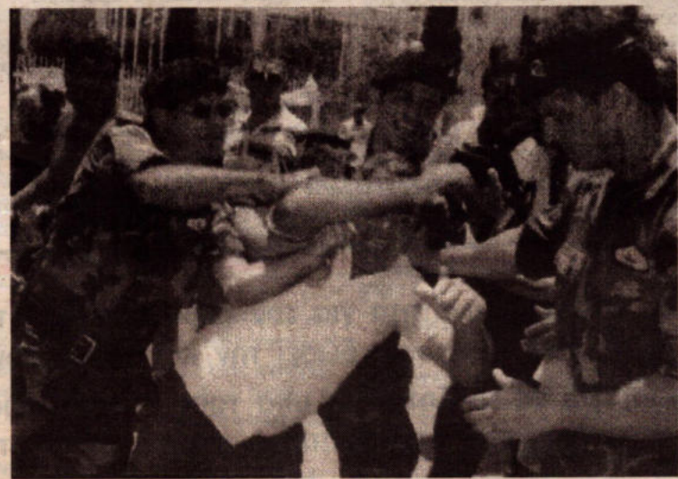
Αυτή την υποδοχή είχαν οι ψαράδες έξω από το προεδρικό

Τα αιτήματα των ψαράδων είναι δίκαια και δεν στρέφονται ενάντια στα δελφίνια, όπως θέλουν να τους παρουσιάσουν. Ζητούν ουσιαστική αποζημίωση για τα κατεστραμμένα