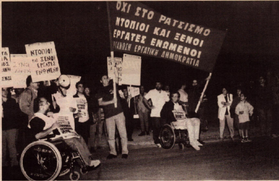
Απο την κινητοποίηση που έγινε πέρυσι ενάντια στο Ξυλοδαρμό των μεταναστών στα αστυνομικά κελιά της Λάρνακας

Η ρατσιστική επίθεση ενάντια στους ξένους εργάτες δεν είναι τυχαία. Πρόσφατα τα κανάλια έστησαν μια ολόκληρη παράσταση για μας πουν ότι η εγκληματικότητα των Ποντίων έχει καταντήσει πραγματική μάστιγα για τους κατοίκους της Πάφου. Μικρά, ασήμαντα ή μεμονωμένα γεγονότα μεγαλοποιούνται για να στηρίξουν αυτή την εικόνα. Σ' αυτό συμβάλλουν και τα αστυνομικά δελτία που τροφοδοτούν τα κανάλια