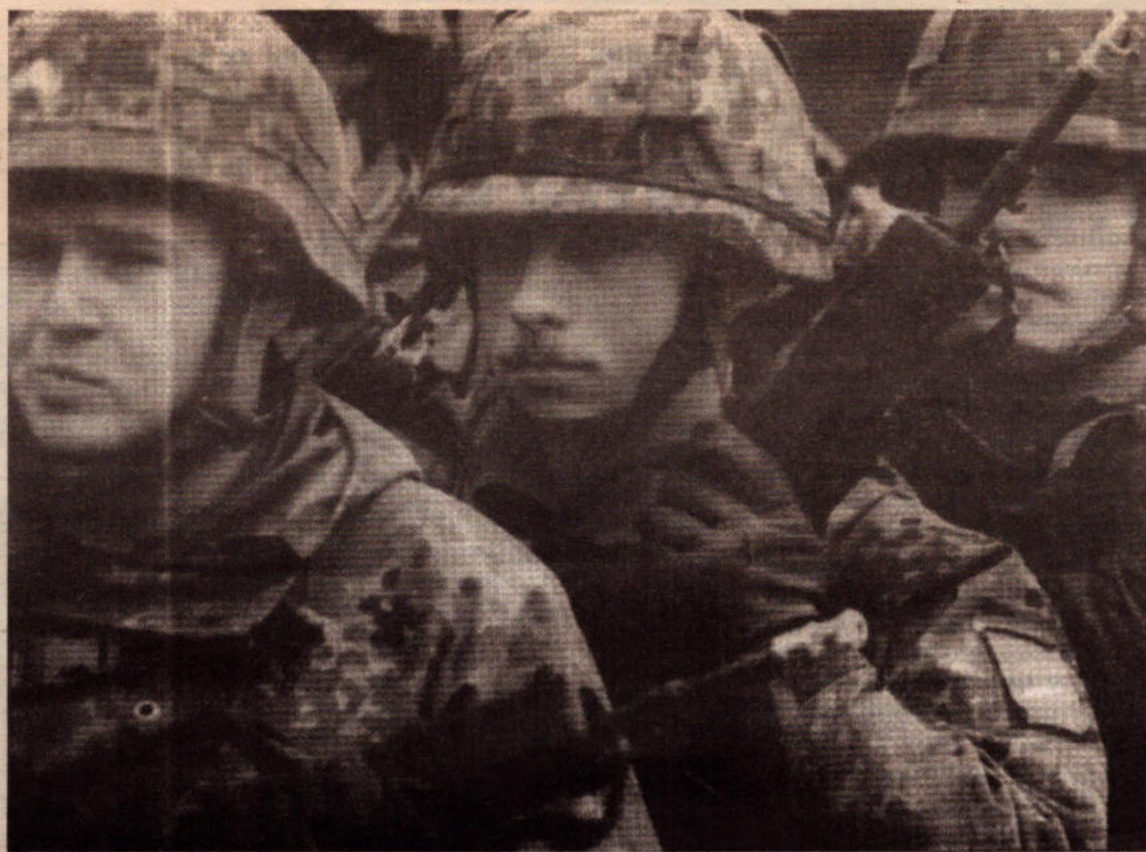
Αμερικανοί στρατιώτες μπαίνουν στο Κόσοβο για να ολοκληρώσουν την "ανθρωπιστική" επιχείρηση που ξεκίνησαν τα βομβαρδιστικά του ΝΑΤΟ

Στο Γκράτσε, βρετανικά και γαλλικά στρατεύματα απλά παρακολου-