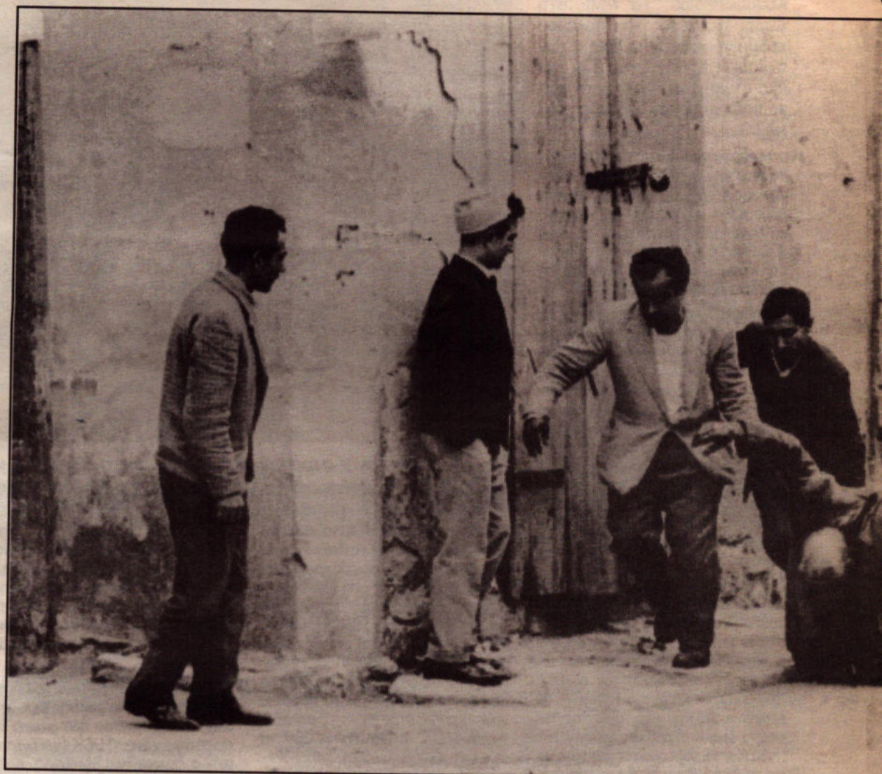
Απο τις συγκρούσεις του Δεκέμβρη του 1963

Στην πραγματικότητα οι τουρκοκύπριοι είχαν την ίδια και χειρότερη μετα-