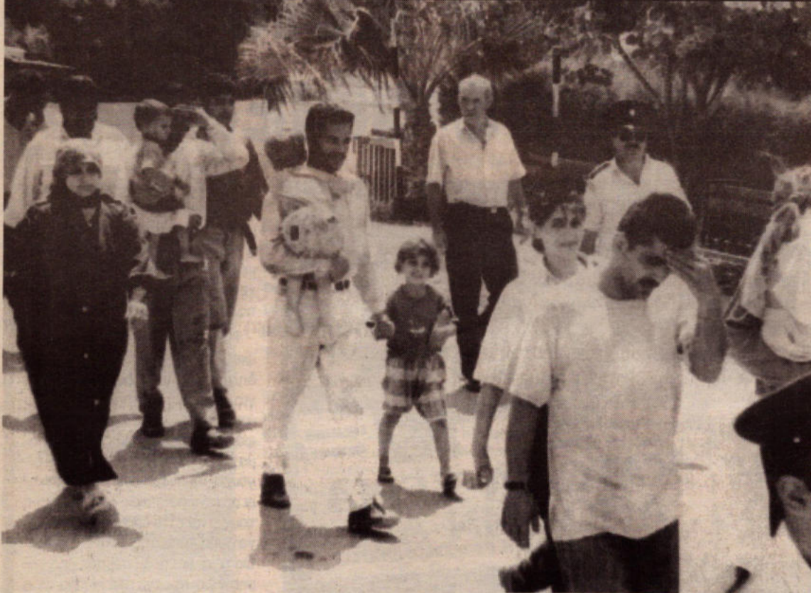
Είναι ντροπή να βλέπουμε τέτοιες σκηνές με ανθρώπους που το μόνο τους έγκλημα είναι ότι αναζήτησαν μία καλύτερη ζωή για τους ίδιους και τις οικογένειές τους