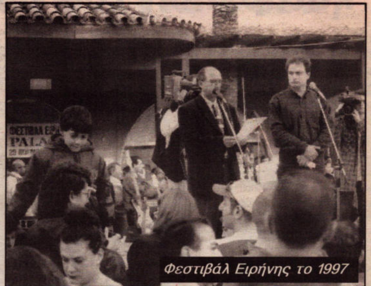
Φεστιβάλ Ειρήνης το 1997

Ομαδικός τάφος τουρκοκυπρίων στην Αλόα (Αύγουστος του '74. Τα εγκλήματα των εθνικιστών και στις δύο πλευρές εκτός από τον απέραντο πόνο που προκάλεσαν στους συγγενείς των θυμάτων συνέβαλαν στο να δυναμώσει το μίσος και η καχυποψία ανάμεσα στους απλούς ανθρώπους και των δύο πλευρών. Οι υπεύθυνοι αυτών των εγκλημάτων όχι μόνο δεν τιμωρήθηκαν αλλά επιβραβεύτηκαν με δημόσιες θέσεις και στις δύο πλευρές.