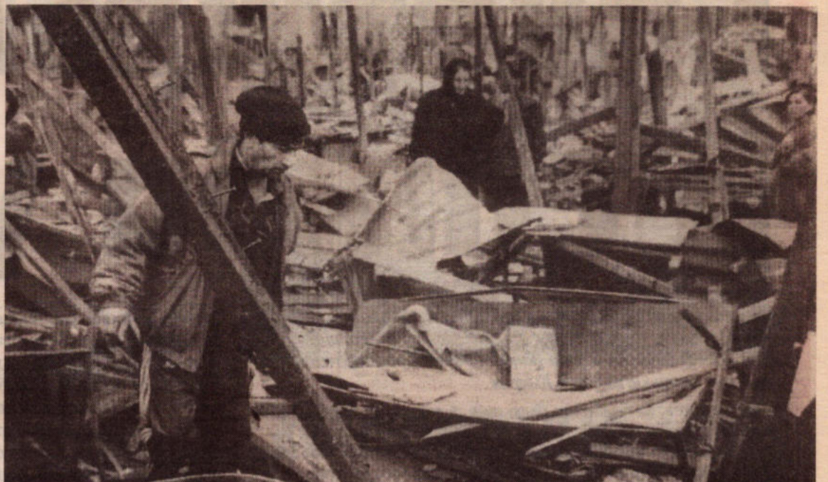
Οι Ρώσοι ισοπεδώνουν τη Τσετσενία όπως ακριβώς έκανε το ΝΑΤΟ στη Γιουγκοσλαβία

Η Ρωσία κατέχει σήμερα τα παγκόσμια πρωτεία στην ανισότητα ανάμεσα στους πλούσιους και τους φτωχούς: το ανώτερο 20% του πληθυσμού έχει εισοδήματα 11 φορές μεγαλύτερα από το κατώτερο 20%.