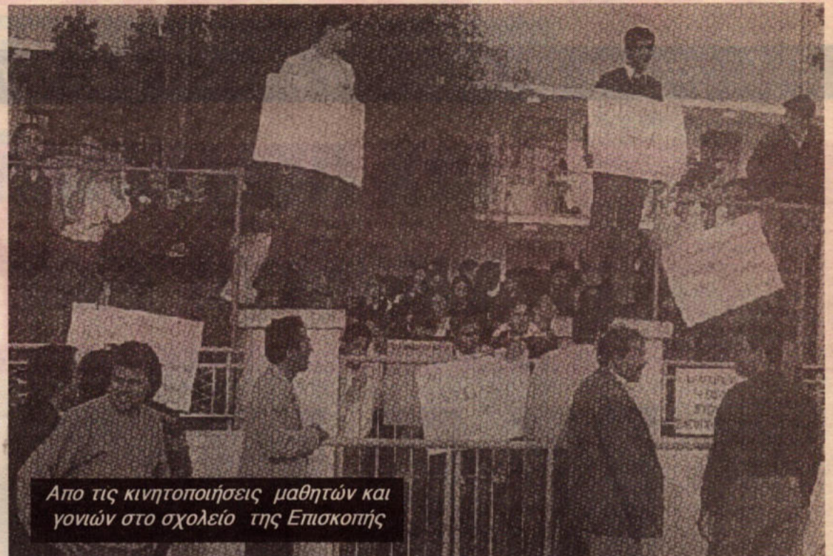
Απο τις κινητοποιήσεις μαθητών και γονιών στο σχολείο της Επισκοπής

Παραπαιδί επίσης του εκπαιδευτικού συστήματος είναι και η βία ανάμεσα στους μαθητές, συγκαλυμμένη η απροκάλυπτη και ακραία όπως την είδαμε να εκφράζεται τον χρόνο που πέρασε. Μια βία απάντηση στη "βία" που ασκείται ποικιλοτρόπως καθημε-