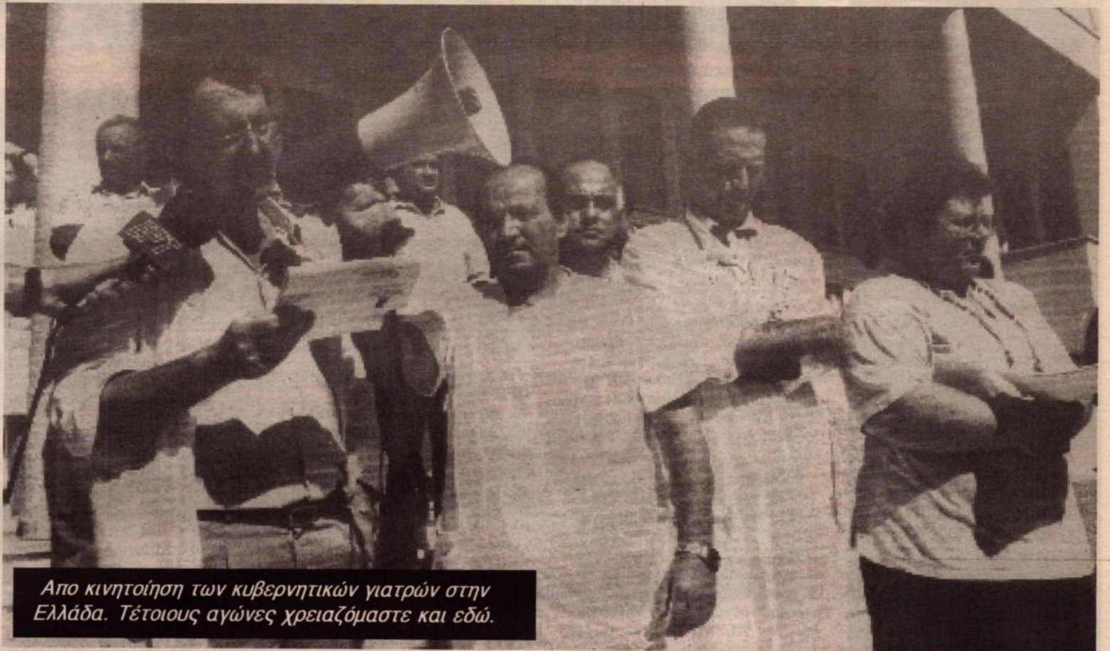
Απο κινητοποίηση των κυβερνητικών γιατρών στην Ελλάδα. Τέτοιους αγώνες χρειαζόμαστε και εδώ.