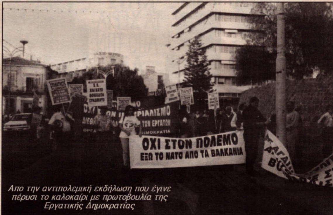
Απο την αντιπολεμική εκδήλωση που έγινε πέρυσι το καλοκαίρι με πρωτοβουλία της Εργατικής Δημοκρατίας

Οι απολογητές του συστήματος ισχυρίζονται ότι η παγκόσμια οικονομία βρίσκεται σε ανάκαμψη. Οι ΗΠΑ βρίσκονται σε πορεία οικονομικής ανόδου, η Ελλάδα ετοιμάζεται να μπει στην ΟΝΕ και η Κυπριακή Δημοκρατία καλύπτει τα όρια για την Ε.Ε. Οι καπιταλιστές σ' ολόκληρο το κόσμο περιμένουν ότι οι ΗΠΑ θα λειτουργήσουν σαν ατμομηχανή που θα τραβήξει του άλλους. Το οικονομικό «θαύμα» των ΗΠΑ όμως, είναι ασαφές. Στηρίζεται στο άγριο χτύπημα των μεροκαμάτων και στην προσδοκία ότι τα κέρδη θα συνεχίσουν να φουσκώνουν διαρκώς.