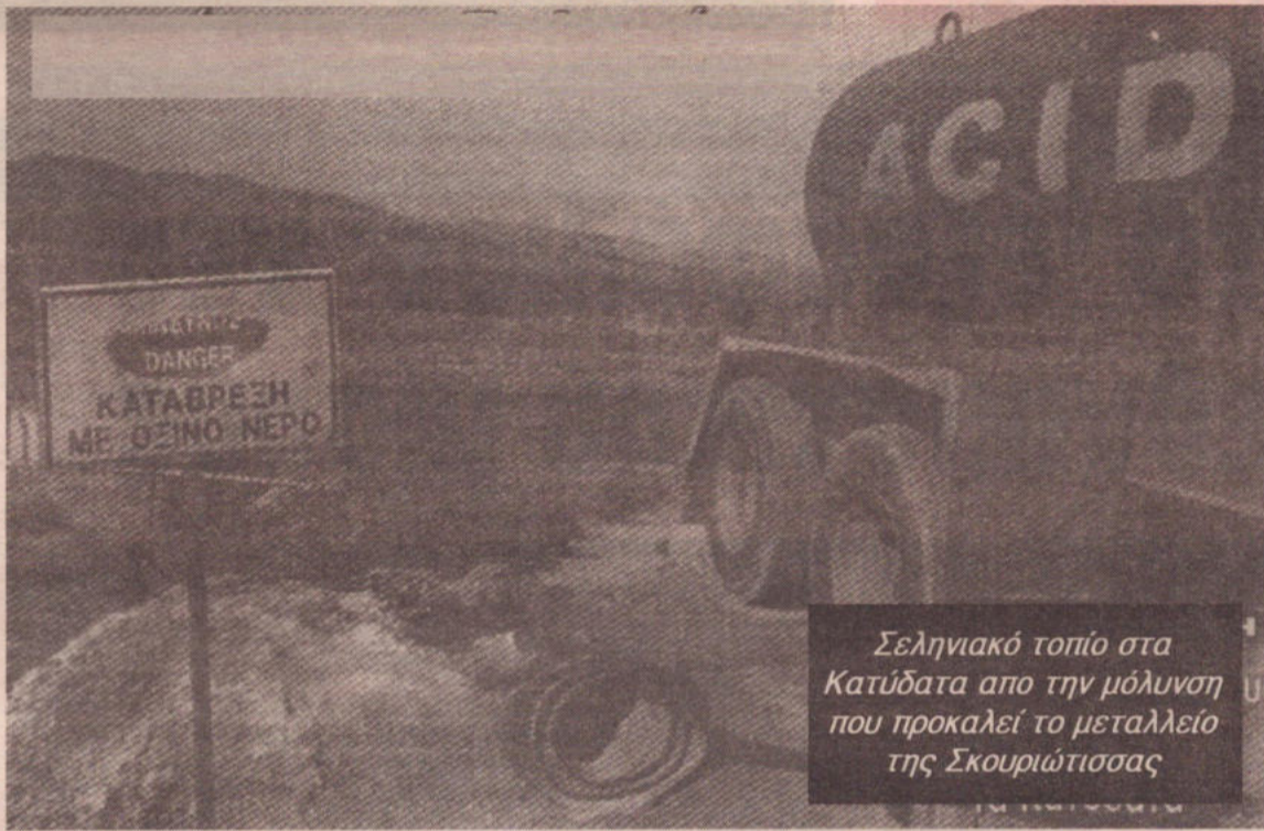
Σεληνιακό τοπίο στα Κατύδατα από την μόλυνση που προκαλεί το μεταλλείο της Σκουριώτισσας

Οι στατιστικές είναι φοβερές, θα μπορούσε να χαρακτηρίσει κανείς τη Γη σαν ένα πλανήτη που οδεύει ολοταχώς στην αυτοκαταστροφή, σαν ένα τόπο που η μόλυνση σκοτώνει σταθερά κάθε μορφή ζωής, και προφανώς, σαν ένα τόπο αφιλόξενο και εχθρικό για το ανθρώπινο είδος.