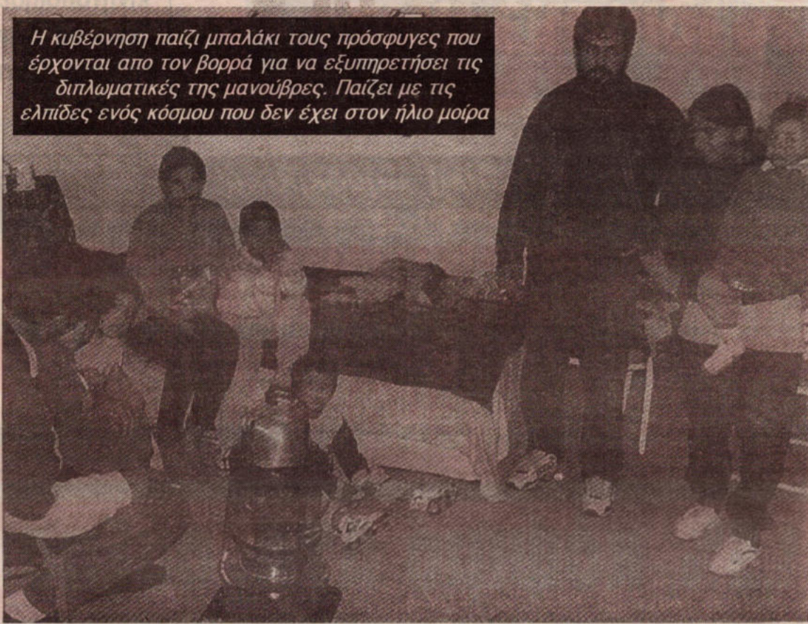
Η κυβέρνηση παίζει μπαλάκι τους πρόσφυγες που έρχονται από τον βορρά για να εξυπηρετήσει τις διπλωματικές της manούβρες. Παίζει με τις ελπίδες ενός κόσμου που δεν έχει στον ήλιο μοίρα

Στις 18 Απρίλη του 1994 είχαν έρθει και πάλι ομαδικά, γύρω στους 15 τσιγγάνους κάτι που ανησύχησε και πάλι την ΚΥΠ. Μέσα στις επόμενες τρεις μέρες, μετά από μια επιχείρηση "σκούπα" συνελήφθησαν όλοι και μαζί με άλλους τουρκοκύπριους που διέμεναν στην Λεμεσό στάλθηκαν νύχτα στη νεκρή ζώνη απ' όπου υποχρεώθηκαν να περάσουν στο βορρά.