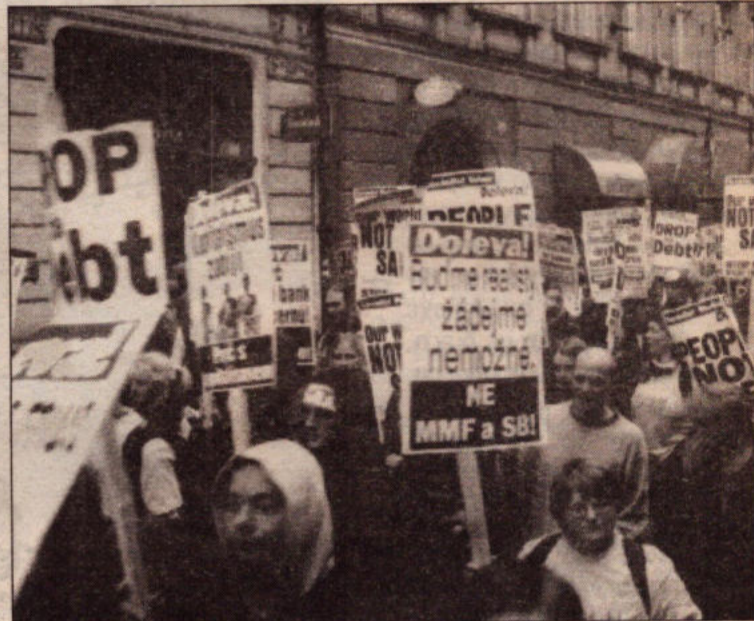
Οι κινητοποιήσεις στο Σιάτλ όπως και στη Πράγα άνοιξαν πολλά ερωτηματικά για τη παγκοσμιοποίηση, τον ιμπεριαλισμό, για τον άν μπορεί να γίνει επανάσταση σήμερα. Σ' αυτά τα ερωτήματα έρχονται ν' απαντήσουν τα βιβλία που παρουσιάζουμε.