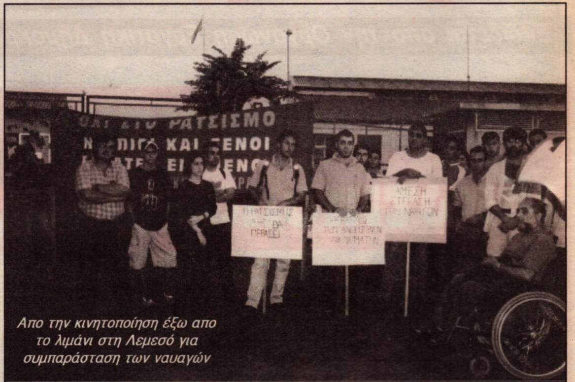
Απο την κινητοποίηση έξω από το λιμάνι στη Λεμεσό για συμπαράσταση των ναυαγών

Δυστυχώς οι συντεχνίες έμειναν αδιάφορες και απαθείς απέναντι σε αυτή την βαρβαρότητα. Τι στιγμή που η αστυνομία αντιμετώπιζε σαν ζώα κάποιους εργάτες που το μόνο τους έγκλημα είναι ότι προσπάθησαν να μεταναστεύσουν από την φτώχεια και την μιζέρια που είναι καταδικασμένοι να ζουν στις χώρες τους, ψάχνοντας την ελπίδα μιας καλύτερης ζωής, οι συντεχνίες έκαναν ότι δεν βλέπουν. Αυτό δεν είναι καθόλου άσχετο με την γενικότερη στάση που κρατούν οι συντεχνίες απέναντι στους ξένους εργάτες. Αποδέχονται όλα τα ρατσιστικά παραμύθια που καλλιεργεί η κυβέρνηση ότι οι ξένοι εργάτες φέρνουν την ανεργία και την εγκληματικότητα. Αντί με την πολιτική τους να ενώνουν την εργατική τάξη και να αγωνίζονται για τα