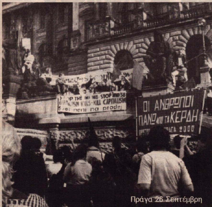
Πράγα 26 Σεπτέμβρη

Η κυβέρνηση μετά την αύξηση του ΦΠΑ και τις αλληπάληδες αυξήσεις στη τιμή των καυσίμων και του ρεύματος ετοιμάζει νέο προϋπολογισμό λιτότητας, ιδιωτικοποιήσεις και περικοπές στις δαπάνες για κοινωνική πρόνοια. Την ίδια στιγμή που χαρίζει εκατομμύρια σε επιδοτήσεις και φοροαπαλλαγές στους βιομήχανους και τους ξενοδόχους τα σχολεία και τα νοσοκομεία ρημάζουν από ελλείψεις σε προσωπικό και εξοπλισμό. Πρέπει να σταματήσουμε αυτόν τον παραλογισμό του συστήματος που βάζει πάνω από του ανθρώπους τα κέρδη.