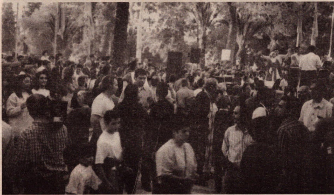
Οι μαζικές εκδηλώσεις επαναπροσέγγισης δείχνουν τη διάθεση των ε/κ και τ/κ εργαζομένων για ειρηνική διευθέτηση του κυπριακού

Την ίδια στιγμή που συνομιλούν ετοιμάζουν το επόμενο κτύπημα στον αντίπαλο τους, είτε αυτό είναι μια διπλωματική μανούβρα είτε ενίσχυση της στρατιωτικής μηχανής του. Την ώρα που Κληρίδης ετοιμάζεται για τον πέμπτο γύρο των συνομιλιών ο Χάσικος προγραμματίζει τον Νικηφόρο με τη συμμετοχή αεροσκαφών της ελληνικής πολεμικής αεροπορίας και εξαγγέλλει νέα εξοπλιστικά προγράμματα. Μόνο για να αντικαταστήσει τις διόπτρες σ' όλα τα αρματα τις Εθνική Φρουράς με διοπτρες θε-