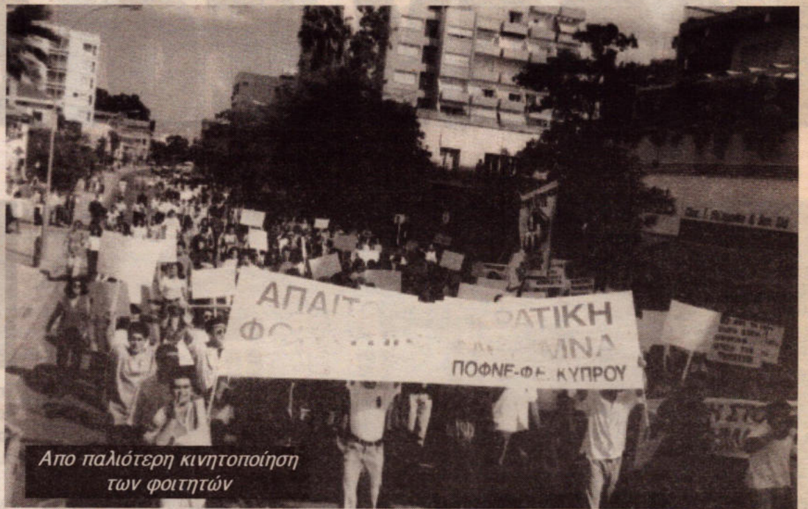
Απο παλιότερη κινητοποίηση των φοιτητών

Δεν είναι μέσα στις προτεραιότητες της η επίλυση αυτών των προβλημάτων. Προτιμά να δίνει επιδοτήσεις και φοροαπαλλαγές εκατομμυρίων σε μεγαλοεπιχειρηματίες όπως το Λόρδο. Να χαρίζει εκατομμύρια λίρες στις εταιρείες πετρελαιοειδών, στους τζογαδόρους του χρηματιστηρίου και τους χρηματιστές. Προτιμά να ξεδεύει εκατομμύρια σε εξευτελιστικές, για τις γυναίκες, φιέστες όπως τα καλλιστεία για τη «Μίς Υφήλιος» ή να ξεδεύει εκατοντάδες εκατομμύρια σε εξοπλιστικά προγράμματα και για ασκήσεις όπως το «Νι-