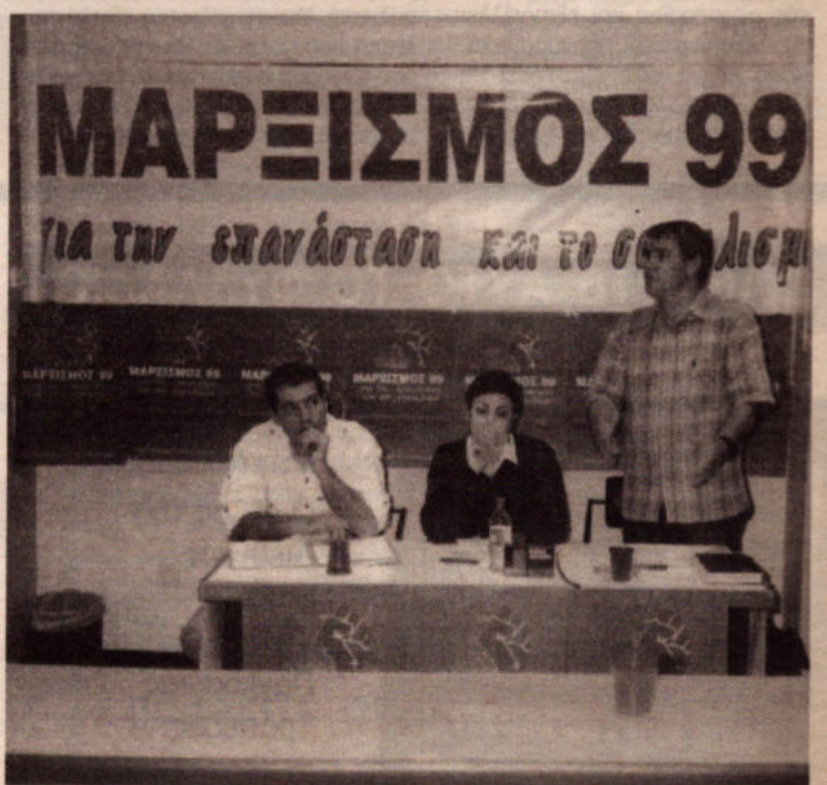
Απο τις συζητήσεις του περσινού τριήμερου που έγινε στο Intercollege στη Λευκωσία.

Μπορείτε να πάρετε κάρτες συμμετοχής από τους συντρόφους που πουλούν την εφημερίδα προς 3 λίρες για ολόκληρο το τριήμερο ή 1.50 σέντ για μία ημέρα.