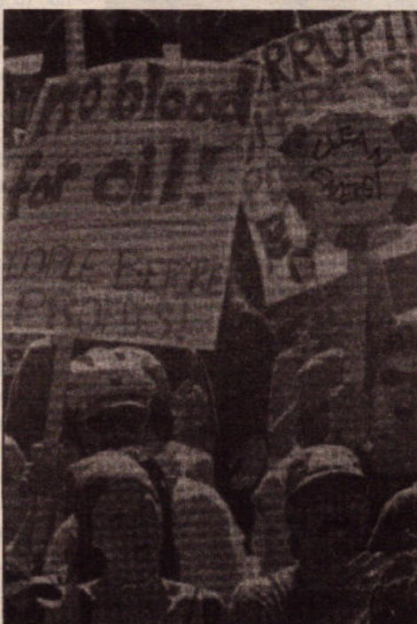
"Οχι αίμα για πετρέλαιο - Οι άνθρωποι πάνω από τα κέρδη" γράφουν τα πλακάτ των διαδηλωτών από τον Καναδά

προκληθεί μόνο από τον ΟΠΕΚ και τις πετρελαιοπαραγωγικές χώρες αλλά κύρια από τις πολυεθνικές του πετρελαίου που ελέγχουν ολόκληρο το κύκλωμα και κερδοσκοπούν ασύστολα. Η πρόβλεψη για τα συνολικά