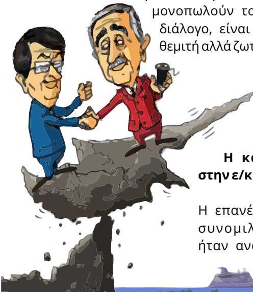
Η κατάσταση στην ε/κ πλευρά

Το πώς θα σταθεί κανείς απέναντι σε αυτό το πολύπλοκο και γεμάτο εκπλήξεις τοπίο ιμπεριαλιστικών ανταγωνισμών είναι κρίσιμο, είτε οδηγηθούμε σε σχέδιο λύσης είτε όχι. Η ριζοσπαστική/αντικαπιταλιστική αριστερά οφείλει να εκτιμήσει συγκεκριμένα αυτήν την πολιτική κατάσταση και να εκπονήσει το δικό της σχέδιο για τις μέρες που έρχονται. Σ' αυτό το πλαίσιο, η υπεράσπιση της διακριτής και αυτόνομης πολιτικής στάσης απέναντι στα στρατόπεδα των εθνικιστών και των φιλελεύθερων αστών που μονοπωλούν τον δημόσιο διάλογο, είναι όχι απλώς θεμιτή αλλά ζωτική.