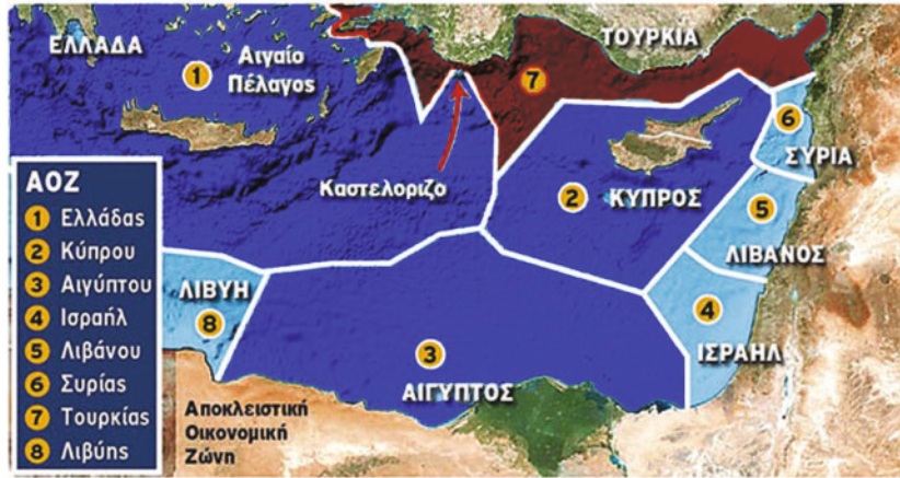
Χάρτης:Αοζ χωρών Ανατολικής Μεσογείου

Επιπλέον, γνωρίζοντας ότι η ΑΟΖ δεν αφορά μόνο τους υδρογονάνθρακες αλλά και το θαλάσσιο εμπόριο και την αλιεία καταλαβαίνουμε ότι η συμφωνία κρύβει πίσω της ισχυρά οικονομικά συμφέροντα πολυεθνικών και εταιριών και εφοπλιστικού κεφαλαίου.