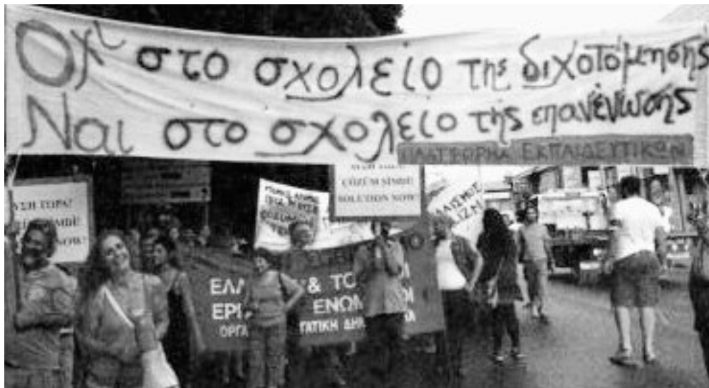
1η του Σεπτεμβρίου, Πορεία Ειρήνης