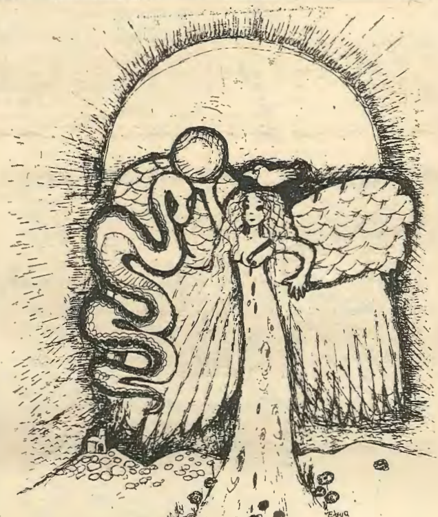
Τη Ρωμοισυνη μην την κλαις

Πρωτοπόροι πάντα στον 'Αγώνα είμαστε μεις οι φοιτητές Στήν φοβέρα και στή βία δέν δειλιάζομε ποτέ. Μπορεί όλα νά τό πάρουν μά κανένας δέν μπορεί νά μάς πάρη νά μάς κλέψη τήν αδούλωτη ψυχή Γιατί έμεις με τόλμη θάρρος και ότσάλινη καρδιά πολεμούμε για τό δικιο και για την ΕΛΕΥΘΕΡΙΑ Είμαστε όλοι ενωμένοι και τραβάμε πάντα έμπρός κι' ο νικητές θά είναι ο κυρίαρχος λαός Λαλάλάλα λαλάλα λάλα λαλάλάλα λάλα λαλάλάλα λά «λαός λαός λαός ΛΑΟΣ».