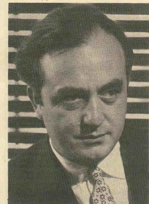
του Κυπριακού. ΣΧΕΔΙΟ ΝΑΤΟΠΟΙΗΣΙΣ

Η δξηση της κατάστασης στη Μέση Ανατολή, η διάλυση των ξένων βάσεων στην Λιβύη ή διατάραξη του συσχετισμού δυνάμεων στην Μεσόγειο, φέρνει την Κύπρο στο επίκεντρο του «ένδιαφέροντος». Από την άλλη η εκκρεμότητα, εκτός από τό «άνεπιθύμητο» της ύπαρξης μιας αδέσμευτης μικρής χώρας στην Ανατολική Μεσόγειο, απειλεί σε περίπτωση υποτροπής ταράχων, να διασαλεύσει την ομαλότητα στις ενδοΝατοϊκές σχέσεις στην περιοχή. Από αυτό πηγάζει η ανάγκη καιότητα για τούς μεγάλους παράγοντες για την επιβολή λύσης στο Κυπριακό πρόβλημα. Δέν συζητιέται η Ένωση από αυτούς τούς κύκλους κάτω από τις δοσμένες συνθήκες και με την Τουρκία να διαδραματίζει βασικό ρυθμιστικό παράγοντα στην διαμόρφωση λύσης. Όυτε όμως και η λύση της ανεξάρτητης, ενιαίας αποστρατικοποιημένης Κύπρου. Ικανοποιεί τά συμφέροντα που επεμβαίνουν στην λύση