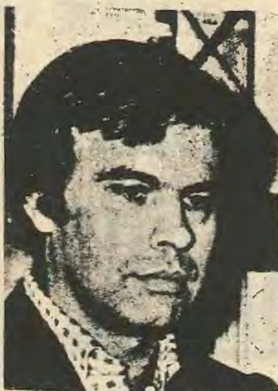
Φελίπε Γκονζάλες (ΠΣΟΕ)

δεν αλλοιώνουν καθόλου την πιο πάνω ανάλυση. Αντίθετα τα ίδια τα αποτελέσματα των εκλογών δείχνουν ξεκάθαρα πως