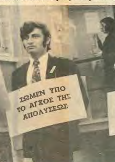
ΟΙ ΣΩΤΕΣ ΠΡΟΒΛΕΨΕΙΣ

την πρόσφατη ύπογραφή του Κώδικα Βιομηχανικών Σχέσεων που άφήνει τους εργαζόμενους άκάλυπτους μπροστά στους εργοδότες και άποτελεί ένα άπο τα μεγάλα χτυπήματα που δέχτηκαν οι εργαζόμενοι, γιατί άκριθός ο Κώδικας κατοχυρώνει τα δικαιώματα των εργοδοτών πάνω στους εργάτες ένώ άπο την άλλη άναλαμβάνονται δε-