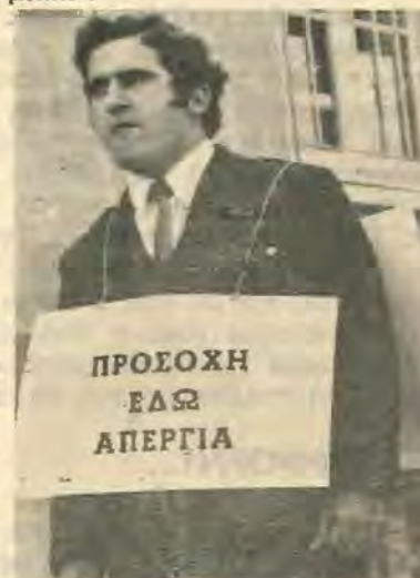
ΟΙ ΣΩΤΕΣ ΠΡΟΒΛΕΨΕΙΣ

νιστικότητας των Κυπριακών προϊόντων. Μπαίνουμε σε μια περίοδο εργατικών προσπειρών αλτία των όποιων θα είναι ή άδυναμία του συστήματος να άύξησει ή άκόμα να διατηρήσει σταθερό το βιοτικό επίπεδο των εργαζομένων. Η μόνη λύση είναι μια τολμηρή πολιτική έθνικιστή έλέγχου πάνω στην οικονομία...».