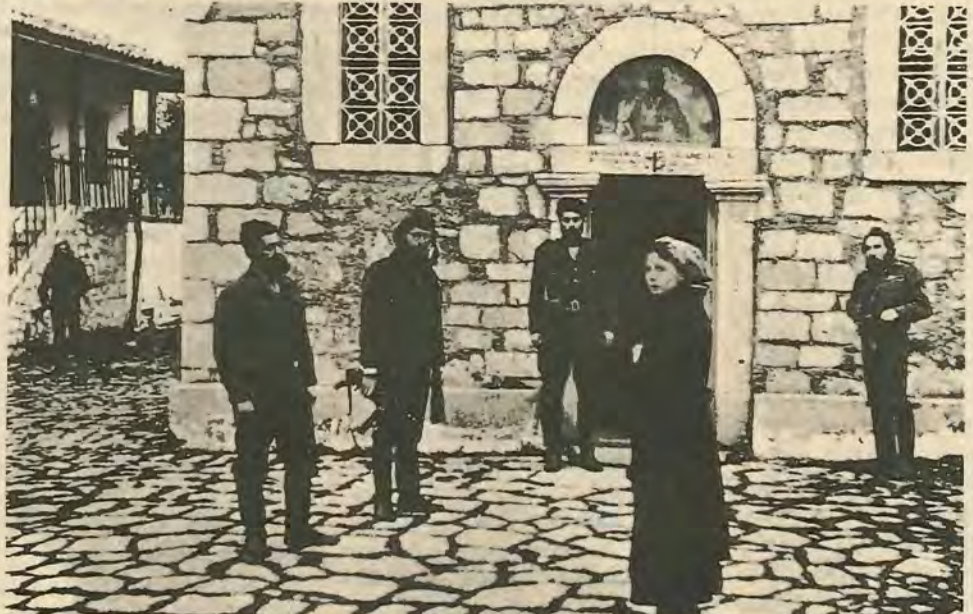
Οὔτε σάν τὸν «Θίασο» τοῦ Ἄγγελόπουλου δὲν μποροῦμε να δοῦμε. Οἱ εἰσαγωγεῖς ἔκριναν ὅτι παρόλες τὶς κριτικὲς και τὰ βραβεῖα, ἡ ταινία δὲν εἶναι ἐμπορικὴ στὴν Κύπρο.

Οἱ δυσκολίες δὲν μποροῦν να ξεπεραστοῦν ἀπο τὴ μια μέρα στὴν ἄλλη. Ἄν δὲν λυθεῖ το θέμα θέμα τῆς εξασφάλισης τῶν ταινιῶν ἀπο το ἐξωτερικὸ που εἶναι δεμένο με τους νόμους του κράτους για εἰσαγωγὲς και ἐξαγωγὲς ταινιῶν, ἀν δὲν δημιουργηθεῖ νομοθεσία που να κατοχυρῶνε τὶς λέσχες, ἀν δὲν ἐπιδειχθεῖ κρατικὸ ἐνδιαφέρον προς τὸν κινηματογράφο ὥστε να δημιουργηθοῦν και να ἐνισχυθοῦν αἰθουσὲς προβολῆς καλῶν ταινιῶν, ἀν δὲν ὀργανωθοῦν ἀποτὴ μια οἱ ἀσχολούμενοι με τὴν κινηματογραφικὴ παραγωγή (κινηματογραφιστῆς, ὀπερατέρ κτλ.) και οἱ εἰσαγωγεῖς ἀπο τὴν ἄλλη, εἶναι πολὺ δύσκολο να γίνε κά-