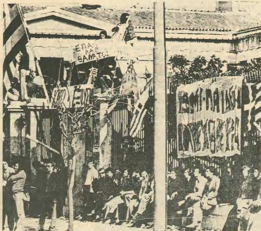
Το Έλληνικό Πολυτεχνείο, όπως και τόσα άλλα Πανεπιστήμια, σε αγωνιστική κινητοποίηση ενάντια στη Χούντα.

Άσφαλώς η αρχουσα κεφαλαιοκρατική τάξη θα επιδιώξει να χρησιμοποιήσει το Κυπριακό πανεπιστήμιο για παραγωγή δεξιάς κουλτούρας και τεχνοκρατών στελεχών για επάνδρωση και συντήρηση του