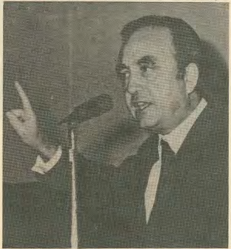
προσφέρει την σωστή πορεία τηρη στις θλιβερές κραυγές αποτελεί την καλύτερη απάντηση για «ενότητα της Δεξιάς».

Οι θέσεις της ΕΔΕΚ είναι γνωστές. Η λεπτομερειακή παρουσίαση ενός προγράμματος θα αποτελέσει την πρακτική απόδειξη της τοποθέτησης του κόμματος. Η επίτευξη ενός κοινού προγράμματος των αντιιμπεριαλιστικών δυνάμεων, ενός προγράμματος που να