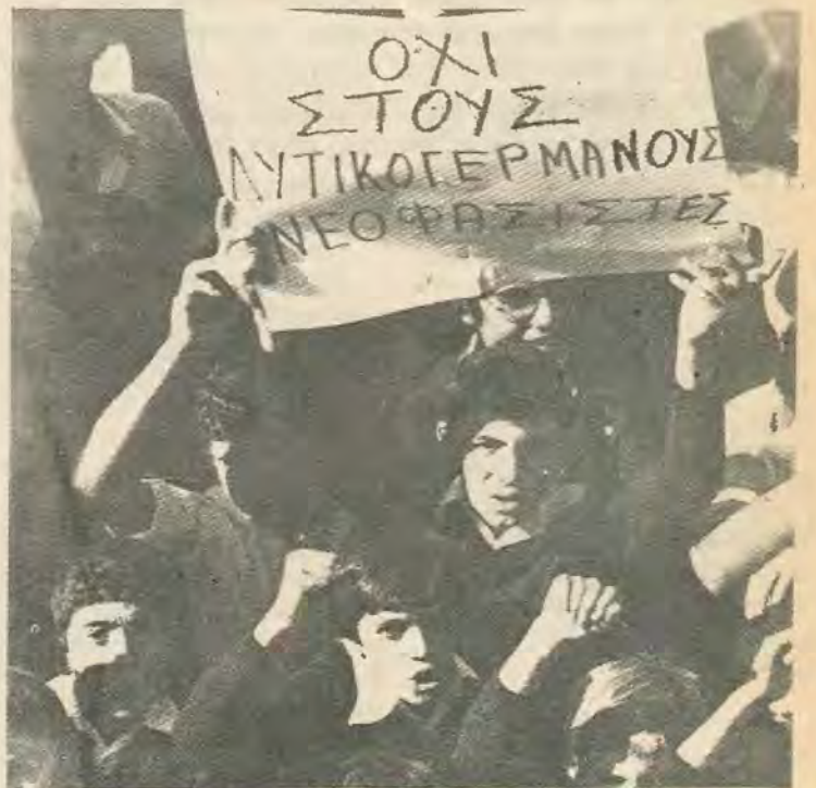
κλπ., μπορεί να είναι δικαιολογημένες δεν μπορούμε όμως να παραμένουμε σ' αυτό, αρκούμενοι μόνο σε έκ των ύστερων παρατηρήσεις προς την Κυβέρνηση, γιατί τή λύση μπορεί να δώσει μόνο ο λαϊκός αγώνας.