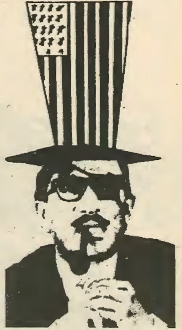
παραγωγής που πιθανόν να υπήρχε μετά το 1952 με το Νασερικό καθεστώς. Συνηθισμένο φαινόμενο στην Αίγυπτο είναι σήμερα, ιδιωτικές επιχειρήσεις μεγάλης κλίμακας που ανήκουν στους πρώ-

χει δώσει η Αμερικανική βοήθεια και συμπαράσταση. Στην Διάσκεψη που έχει καλέσει ο Σαντάτ μπορεί να είναι σύγουρος για την υποστήριξη της Ιορδανίας και της Σαουδικής Αραβίας. Ο βασιλιάς Χουσεϊν ήδη έχει επισκεφθεί τον Σαντάτ και ενεργεί πρακτικώς για να καλέσει και άλλη συμπάρασταση. Επίσης η Σαουδική Αραβία με την τεράστια της επιρροή στον Αραβικό κόσμο κάνει παρόμοια. Στην Διάσκεψη η Αίγυπτος έχει καλέσει μόνο μη μέλη της Ο.Α.Π. Παλαιστίνιους από την Δυτική Όχθη, και καθημερινά κάνει επιθέσεις εναντίον της Ο.Α.Π. Σκοπός του Σαντάτ είναι να κάνει την προεργασία μιας συμφωνίας, βασικά μεταξύ της Αιγύπτου, Ιορδανίας και Ισραήλ (θα λάθουν μέρος και Ισραηλίτες) στην Διάσκεψη που μετά θα επικηρυχθεί από άλλη Διάσκεψη που θα καλέσει στην Γενεύη κάτω από την αιγίδα των Ην. Έ-