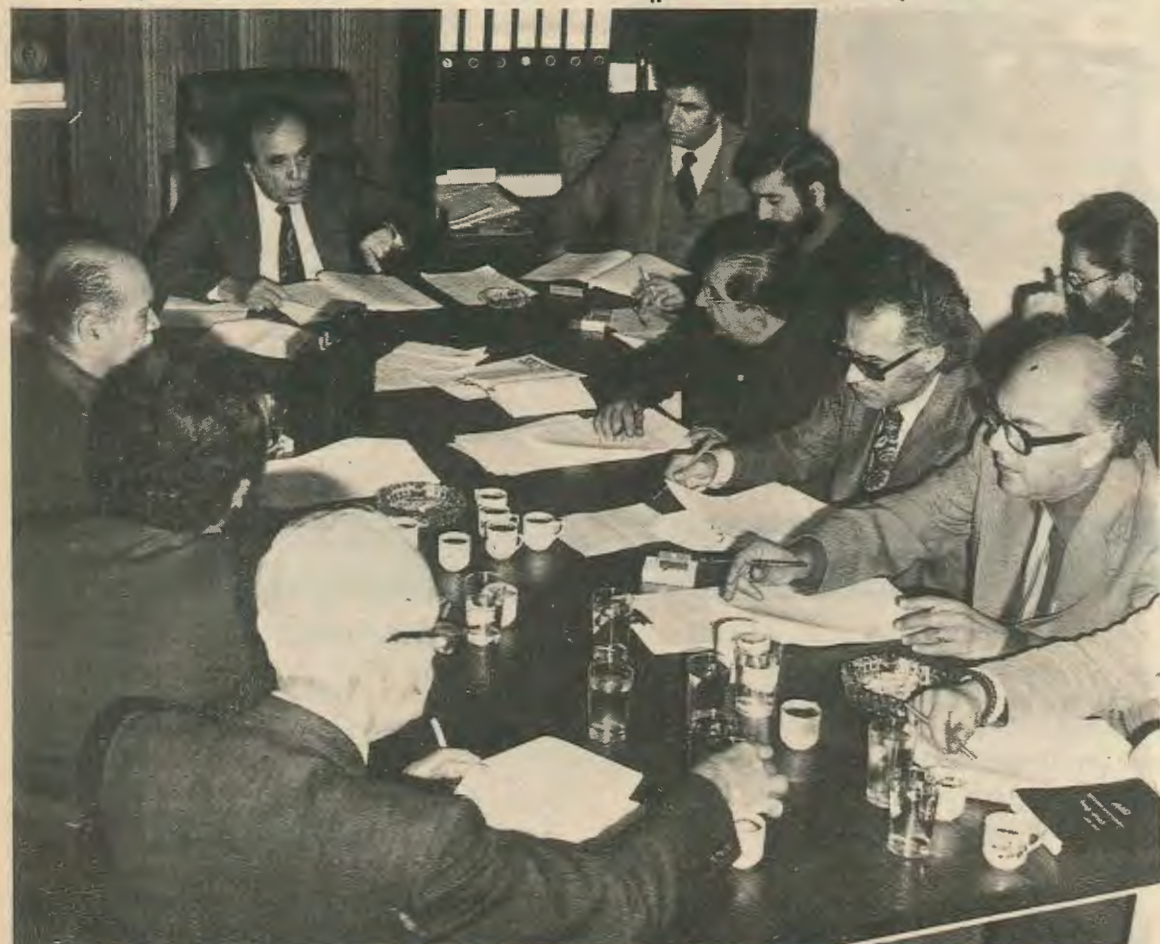
Ὁ Πρόεδρος τῆς ΕΔΕΚ Δρ. Βάσος Λυσαρίδης ἀναλύει τὸ κοινὸ πρόγραμμα τοῦ κόμματος στοὺς δημοσιογράφους.