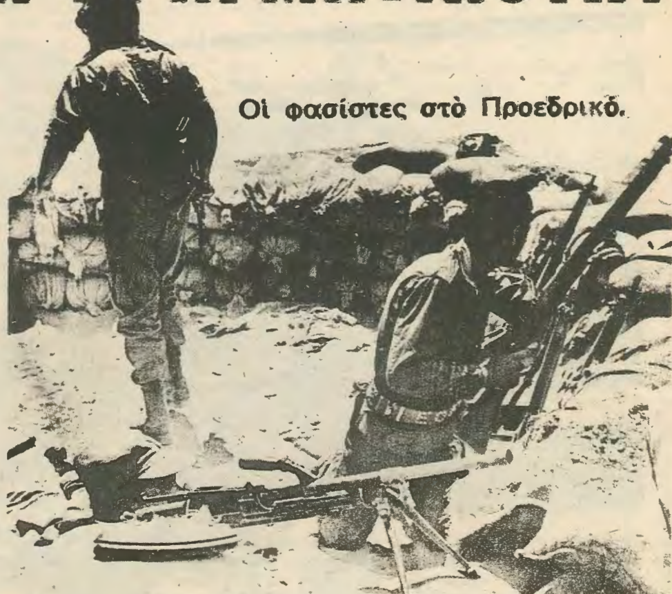
Οι φασίστες στο Προεδρικό.

Ξεκινώντας από τη θέση πως οι άνθρωποι φτιάχνουν την ιστορία μέσα σε δοσμένες αλλά τροποποιήσιμες συνθήκες καταλήγουμε πως ο φορέας της αλλαγής είναι το ανθρώπινο εκείνο στοιχείο που το κοινωνικό σύστημα — στην εποχή μας ο καταπιεστικός — καταδικάσει στην εκμετάλλευση. Μέσα από την αντίφαση του καπιταλισμού γεννιέται η τάξη των εργαζομένων που θα ανατρέψει το έλο οικοδόμημα. Η αντίφαση της κοινωνικοποίησης της εργασίας και της ιδιοποίησης του προϊόντος της εργασίας από λίγους δημιουργεί τις συνθήκες για την ανατροπή του συστήματος από την εργατική τάξη και την οικοδόμηση του σοσιαλισμού. Η αλλαγή, όμως, δεν έρχεται αυτόματα: είναι