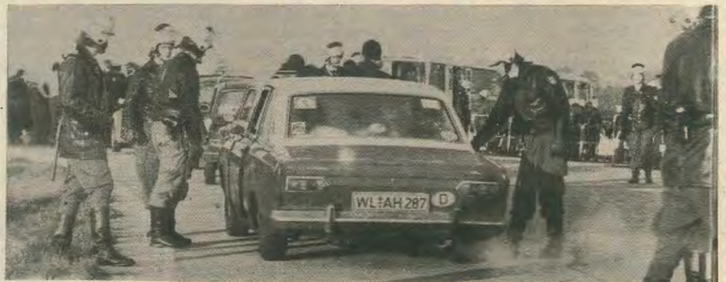
Από την καθημερινή τρομοκρατία του Γερμανικού Κράτους σε βάρος του λαού.

Η καταγωγή πολλών μελών της ΡΑΦ από μικροαστικές οικογένειες γίνεται για να δικαιολογήσει την αποψη που επικρατεί στο κείμενο ότι η δράση τους είναι καθαρά μικροαστική. Θα ήταν αντιδιαλεκτικό να κρίνουμε ο-