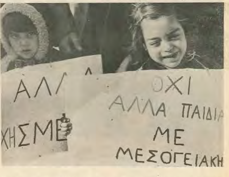
δεν είναι νέα. Έδώ και αρκετά χρόνια πιέζει ο ΠΑΣ για τ' λύση τους. Από τις άρχες τ' 1976

απαιτείται στην ζωή ένα παιδί που πάσχει από Μ. Α. Τό φάρμακο αυτό είναι έντελώς άδύνατο να αγοράζεται από τ' φαρ-