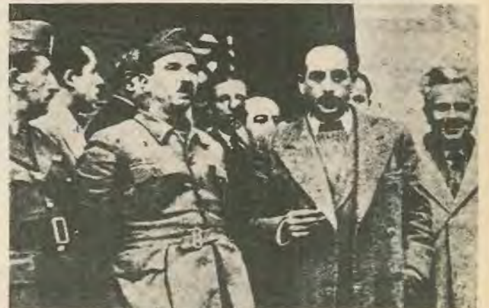
Συνέδριο τής Βάρκιζας, 12 Φεβρουαρίου 1945. Σαράφης, Σιάντος, Τσιριμώκος και Παρτσαλιδής.

Όμως, παρόλο το σφάλμα τής 12 του Φεβράρη, ο καθένας γονατίζει εύλαβικά μπροστά στους άγώνες των Έλλήνων Άριστερών. Στο ένδοξο λαϊκό κίνημα πού καταπόντισε τον καταχτικό Γερμανικό Στρατό. Ένα κίνημα πού αγωνιζόταν για μια Ελλάδα πού νά ανήκει στους Έλληνες, για μια Ελλάδα πού νά δίνει στους πολίτες τής ζώας εύκαιρίες δίχως έκμεταλλευτές και έκμεταλλευόμενους.