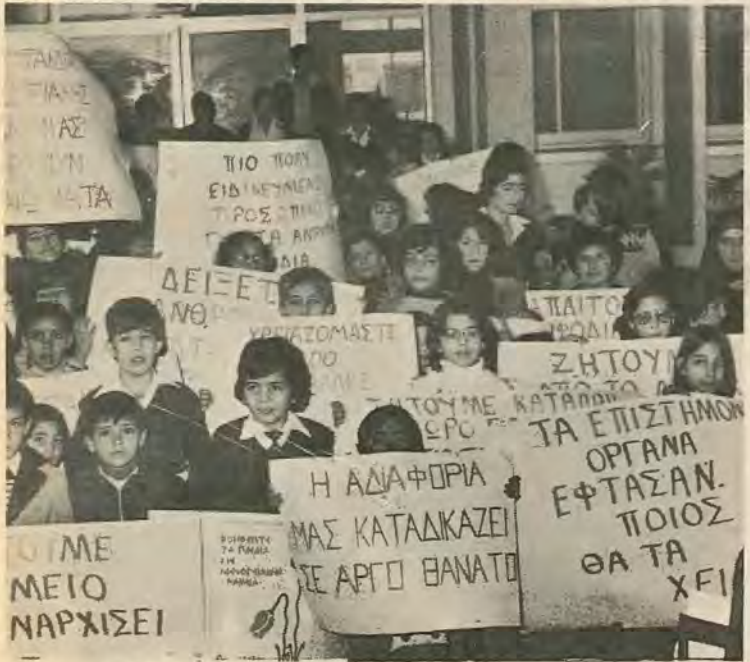
που ξεκίνησε από τ' Γεν. Νοσοκομείο Λευκωσίας και κατάληξε στο προεδρικό. Κύριος λόγος τ' την όργάνωση της πινακίδα-

ή κυβέρνηση είχε υποσχεθεί πως μέχρι το τέλος του ίδιου χρόνου τ' Αντιανειμικό Κέντρο θά ήταν έτοιμο και πως ολόκληρος ο πληθυσμός της Κύπρου θά εξετάζοταν για τ' στίγμα της Μ. Α. με ρυθμό 10.000 άτόμων τ' χρόνο. Σήμερα, άρχες του '78, τ' κτίσιμο του Κέντρου δεν έχει καν άρχίσει ενώ οι εξετάσεις για τ' στίγμα έχουν τελειώσει σταματήσει. Τον περασμένο χρόνο '78, αντί των 10.000 εξετάσεων έγιναν μόνο 900. Μηχανήματα άξιας δεκάδων χιλιάδων λιρών πουν ο ΠΑΣ άγόρασε με δικά του λεπτά από την θετική άνταπόκριση του κοινού,