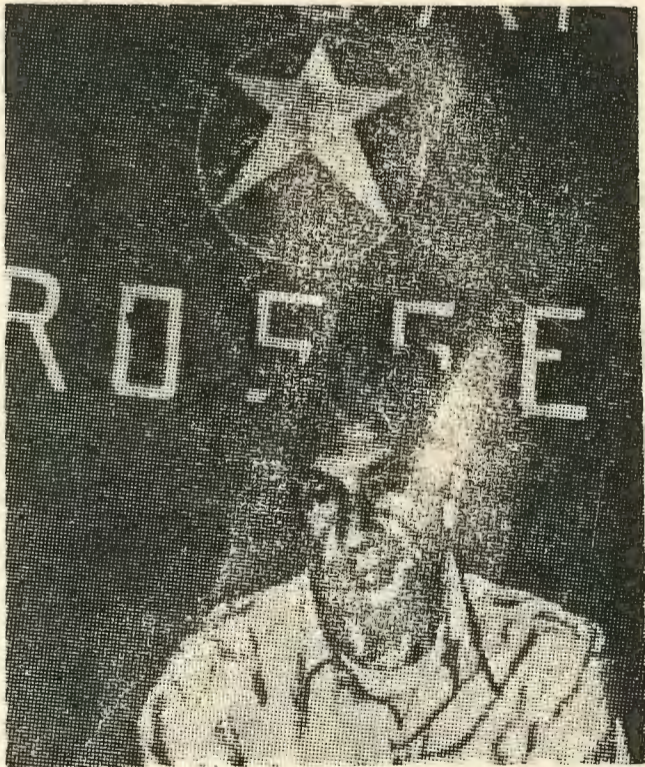
Η φωτογραφία του άπαχθέντος Άλντο

ζουν. Στην καταπίεση, στην εκμετάλλευση του ανθρώπου από τον άνθρωπο, στην επιβολή «δημοκρατικών» μέσων ζωής.