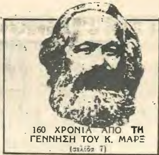
160 ΧΡΟΝΙΑ ΑΠΟ ΤΗ ΓΕΝΝΗΣΗ ΤΟΥ Κ. ΜΑΡΕ (σελίδα 7)