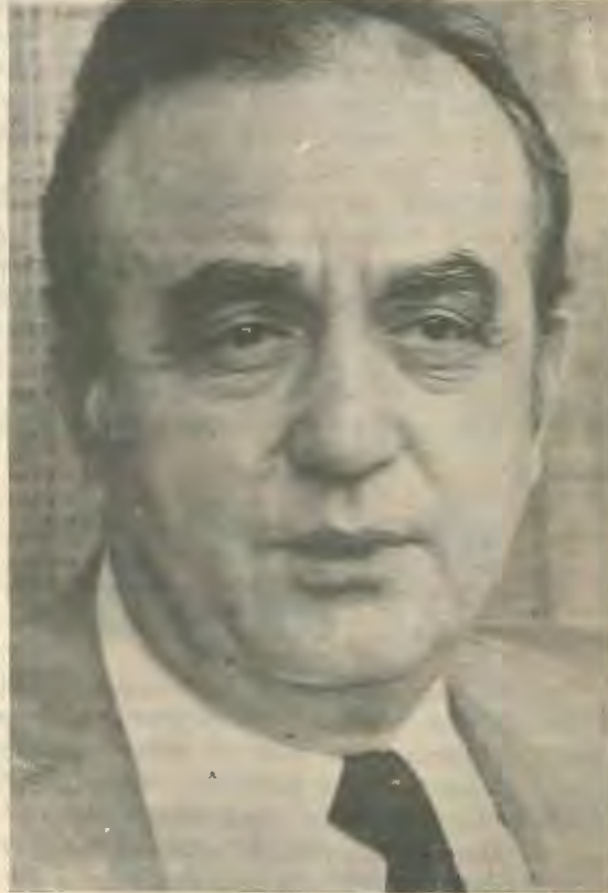
τητα και για λόγους πατριωτικούς.

Να αξιοποιηθούν σωστά οι οικονομικοί πόροι ούτως ώστε να χρησιμοποιηθούν και για τον αγώνα και για το σύνολο του λαού και είναι η μόνη μέθοδος των σωστων δραστηριων κοινωνικο-οικονομικών μέτρων, μέσα ά ένα καπιταλιστικό σύστημα, που θα αποτρέψει ακόμα και εκείνους που τυχόν θα θέλουν να εκμεταλλευτούν μια κατάσταση εχθρούς του αγώνα. Αλλά δεν είναι με τις υποχωρήσεις της εργατικής τάξης που είναι δυνατό να αποφευχθεί μια αναμέτρηση πάνω ά αυτο τον τομέα αλλά με ορισμένα μέτρα, που να ανακουφίζουν τα εργατοαγροτικά, και τα οποία είναι απαραί-