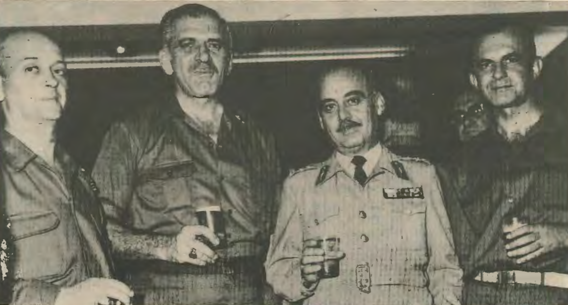
Μερικοί από τα όργανα που χρησιμοποιήθηκαν για την προδοσία και κατονομάζει ο «Φάκελλος» της Λαϊκής Σκηνης.

Στην Κύπρο ή Λαϊκή Σκηνη συνεχίζει τις παραστάσεις με το «Φάκελλο της Κύπρου» και ετοιμάζεται παράλληλα