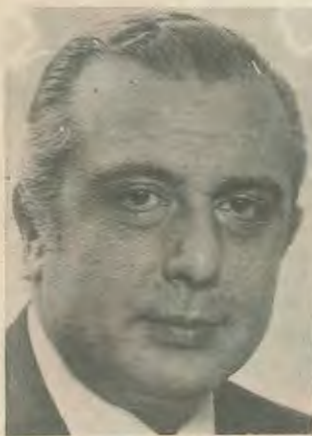
Τα γεγονότα στην Περσία αφείρεσαν απο τις ΗΠΑ ένα πολύτιμο σύμμαχο, που αντικειμενικα ισχυροποιει στα μάτια του

Υστερα απο πολλους μήνες αδιεξόδου αναγγέλθηκε η επικείμενη συνάντηση του προέδρου Κυπριανου με τον τουρκοκύπριο ηγέτη κ. Ντενκτας, που προγραμματίζεται κάτω απο την αιγίδα του Γ.Γ. του ΟΗΕ κ. Βάλντχαϊμ. Τα δεδομένα στην περιοχή έχουν αλλάξει αρκετα, αν και τα διεθνη δεδομένα γενικα και η στάση της τουρκικης πλευρας δεν επιτρέπουν καμμια αισιοδοξία. Εκείνο που έχει κάτω απο τούτο το φακο σημασία είναι οι επιπτώσεις που μπορεί να έχει μια τέτοια συνάντηση.